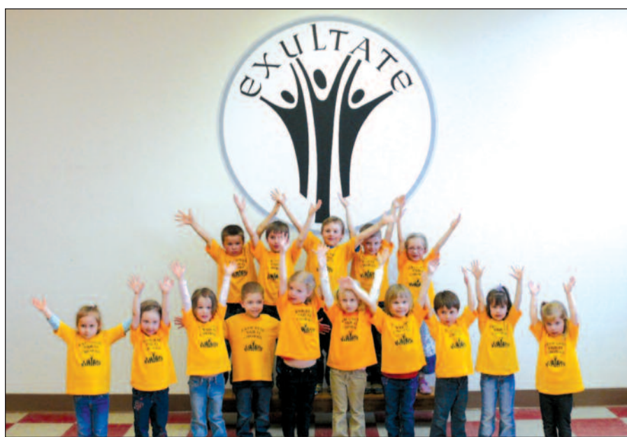
Vaikų choro „Exultate“ dainininkai.

Aukštos indėlių palūkanos. 2.25 proc. dvejiems ir 2.50 proc. trejiems metams terminuotas indėlis California Lithuanian Credit Union Santa Monica, California Tel. 310-828-7095 Valdžios apdrauda iki $250,000