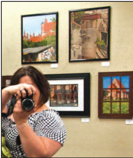
Lietuvių menininkų paroda Orlando, FL – 5 psl.