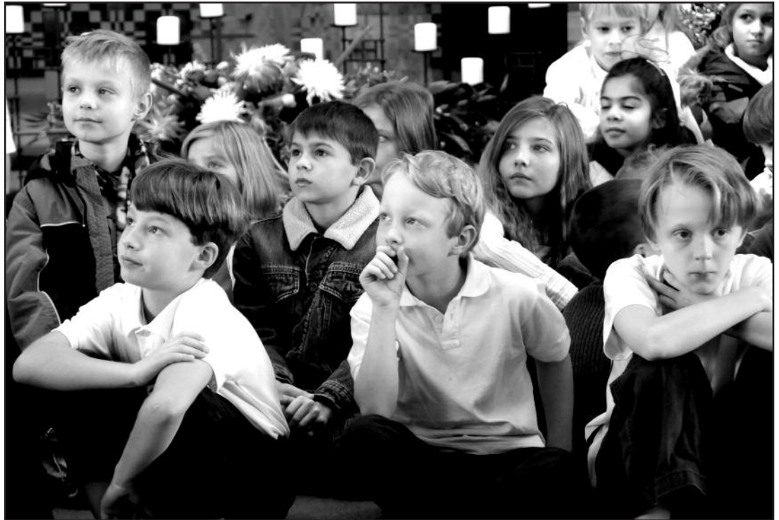
Čikagos jaunučiai ateitininkai.