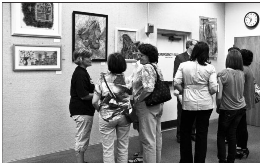
Į balandžio 14 dieną įvykusį parodos atidarymą susirinko svečiai iš Orlando. Kiti atvyko net iš pajūrio miestų Tampa bei Ormond Beach.