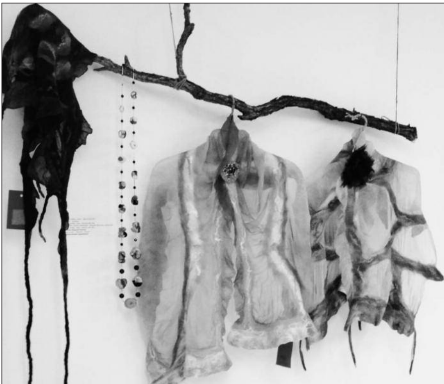
„ArtCity24.com“ moterims siūlys vienetines rankų darbo skraistes.