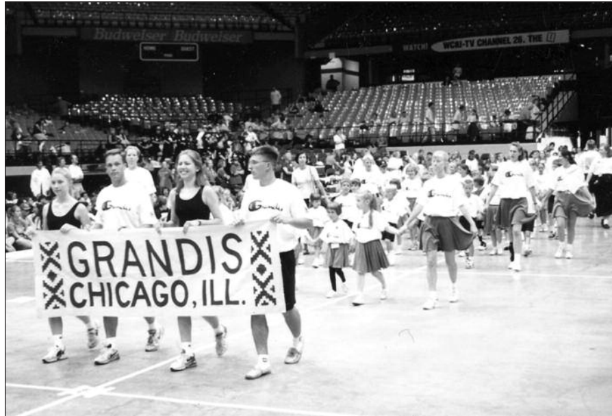
„Grandis” vienoje iš šokių švenčių.