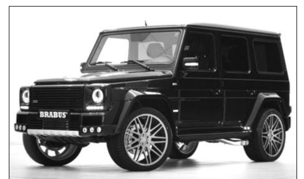
„Brabus 800 Widestar“.