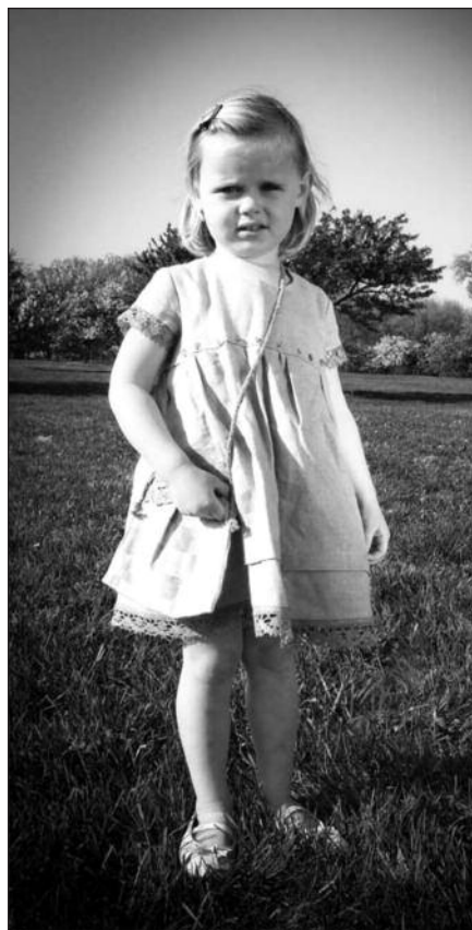
„Sraige.com“ pristatys lininius drabužėlius vaikams.