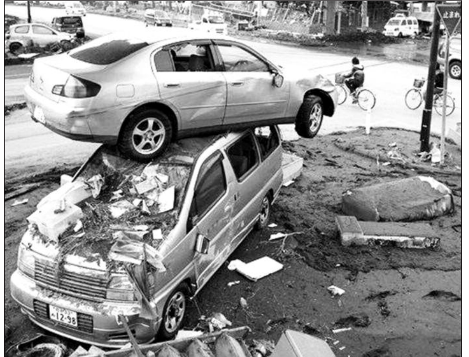
Automobiliai Miyako mieste.

Tačiau „Brabus 800 Widestar“ Vokietijos greitkeluose atsiliks nuo „eilinių“ BMW M3 ir kitų automobilių, kurių didžiausias greitis apribotas iki 250 km/val. – šis visureigis gavo ribotuvių, neleidžiantį jam lėkti daugiau nei 240 km/val. greičiu. Jį pašalinus, „Brabus“ galėtų išibėgėti iki 270 km/val.