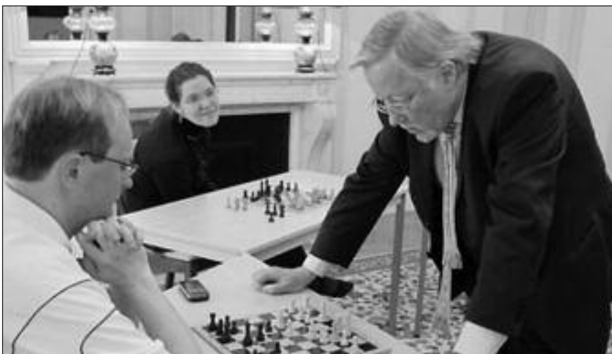
V. Landsbergis žaidžia šachmatų simultaną ambasadoje.

Paryžius (DELFI.lt) – Lietuvos ambasadoje Prancūzijoje kovo 26 d. įvyko šachmatų simaltanas, kuriame žaidė Europos Parlamento narys Vytautas Landsbergis ir Prancūzijos lietuvių jaunimo sąjungos atstovai. V. Landsbergis laimėjo visas tris valandą trukusias partijas.