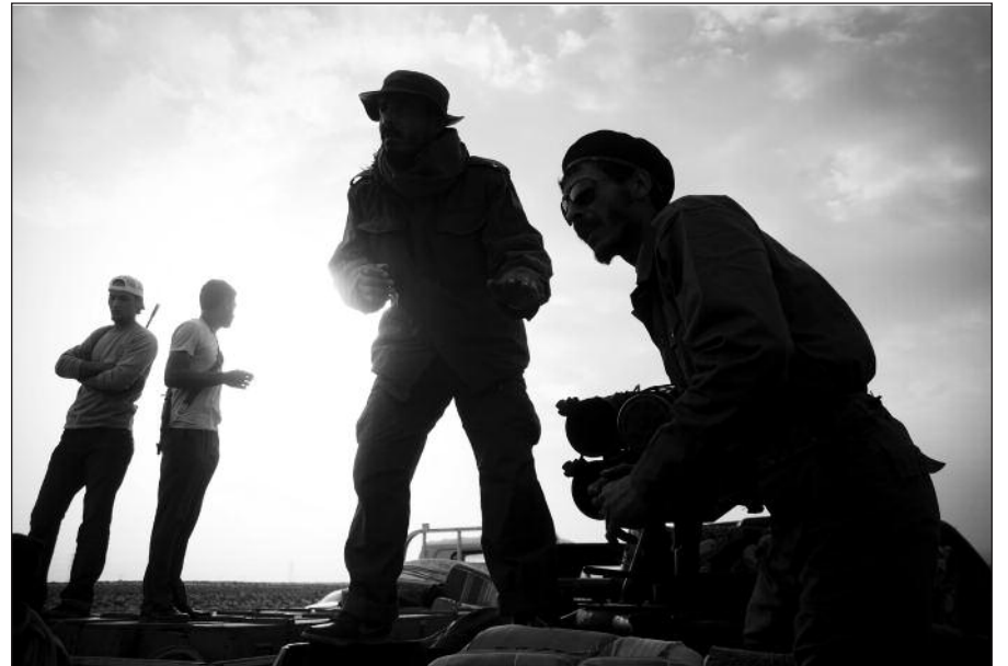
Libija: M. Gaddafi pajėgų puolami sukilėliai traukiasi.

Vilnius (BNS) – Kai kurios arabų šalys atsiribojo nuo Londone vykusios tarptautinės konferencijos, kuri buvo organizuota siekiant aptarti Libijos politinės ateities gaires, o tokia jų nuostata sužlugdė Prancūzijos ir Didžiosios Britanijos viltis rasti bendrą sprendimą.