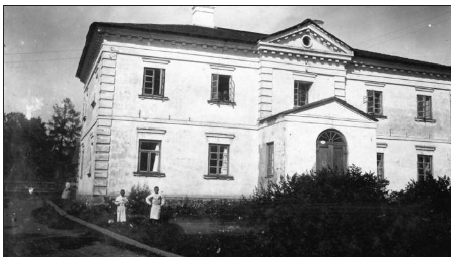
Biržų ligoninė XX a. III–IV dešimtmetyje.