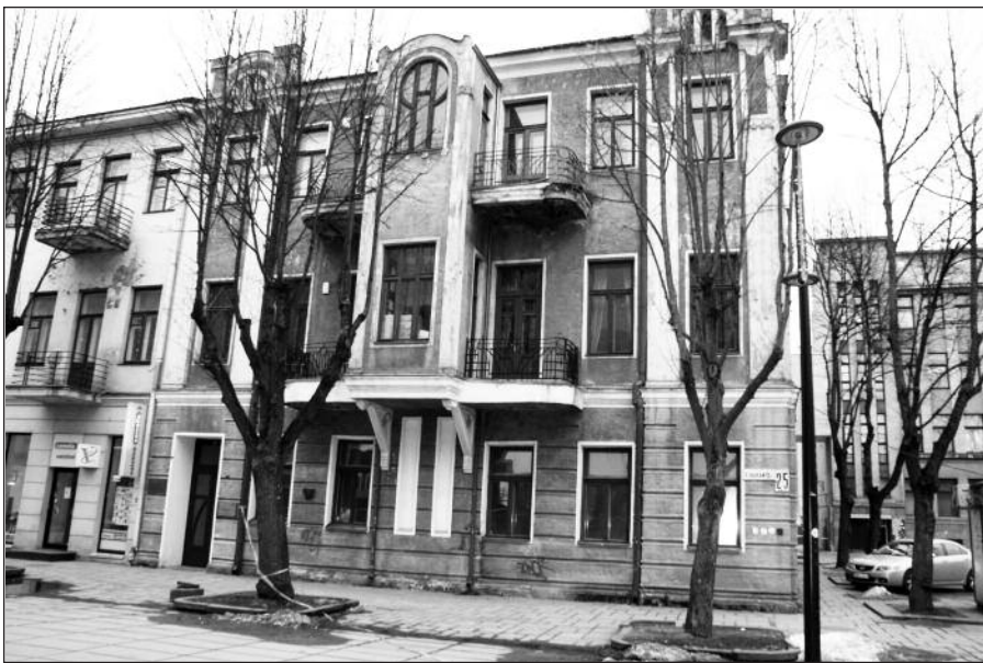
Šiame name Kaune kuriamas prezidento V. Adamkaus muziejus-biblioteka.