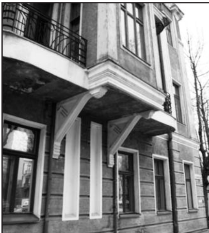
Lietuvoje kuriamas prezidento V. Adamkaus muziejus-biblioteka – 10 psl.