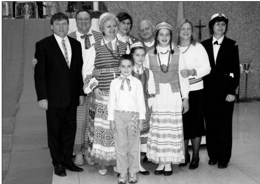
Dalis Nepriklausomybės švenčių Brighton Park minėjimo dalyvių.