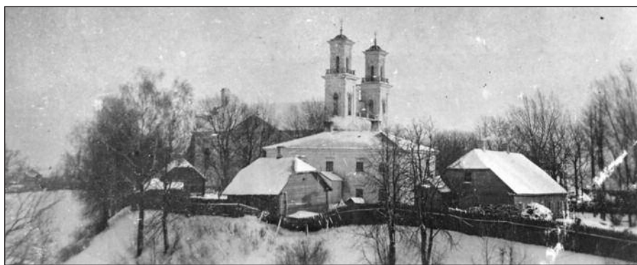
Biržų ligoninė XX a. pradžioje.

Ant rašto matosi įpareigojimas vicegubernatoriui imtis priemonių. Jau 1888 m. vasario 19 d. Kauno gubernijos valdyba priėmė rezoliuciją ir Biržų valsčiaus ligoninei papildomai paskyrė dar dvi stacionarines lovas. Buvo savaip išspręstas ir antro medinio ligoninės pastato klausimas. Rusijos caras Aleksandr III stebulingai išsigelbėjo nuo mirties per geležinkelio nelaimę prie Borki stoties. Biržų valsčiaus valdyba, atsidėkodama Aukščiausiam už caro išsigelbėjimą, už 700 rublių pastatė medinį pastatą, net bandė prie ligoninės virtuvės išgręžti arteininį šulinį.