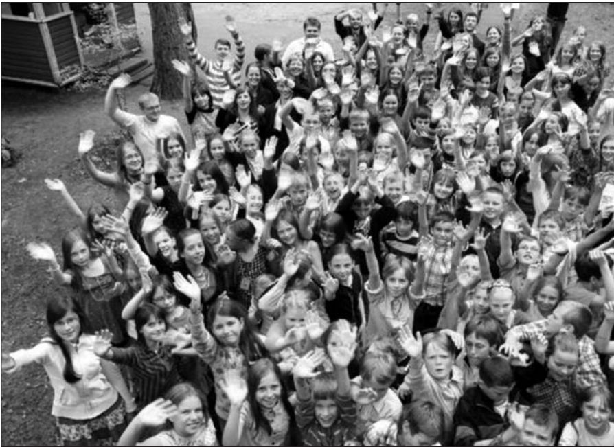
Lietuvos jaunieji ateitininkai.