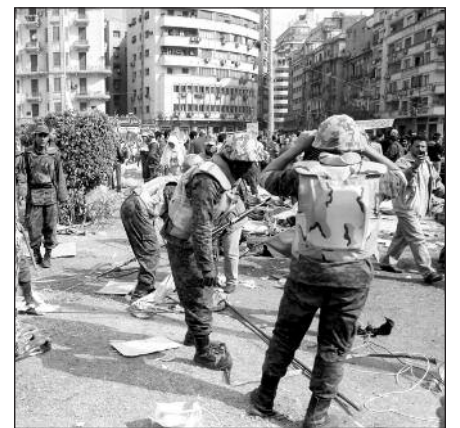
Egipto kariai Tahrero aikštėje ardo palapines.

Šimtai Egipto gidų susirinko prie Gizos piramidžių, garsiojo Sfinkso papėdėje, ragindami protestų prieš nuverstą prezidentą H. Mubarak išvaikytus turistus sugrįžti į miestą. Užsieniečius išgąsdino pastarųjų savaitių įvykiai ir televizijų rodyti susirėmimų gatvėse vaizdai, todėl dideles pajamas iš turizmo pramonės gaunanti šalis neteko daug lėšų, o tūkstančiams turistus aptarnaujančių egiptiečių iškilo pavojus netekti ir darbo. Streikus pradeda atlyginimų pakėlimo reikalaujantys kelių valstybės ir privačių sektorių darbuotojai, sekantys režimą nuverstusių protestuotojų pavyzdžiu.