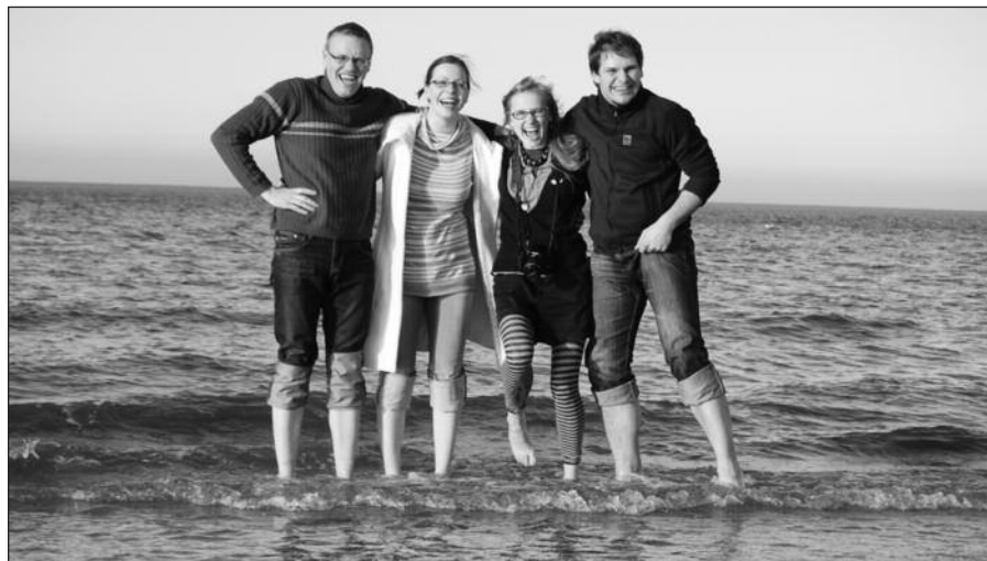
Negalėjome atvykę į Ameriką neįkišti kojų į Atlanto vandenyną.