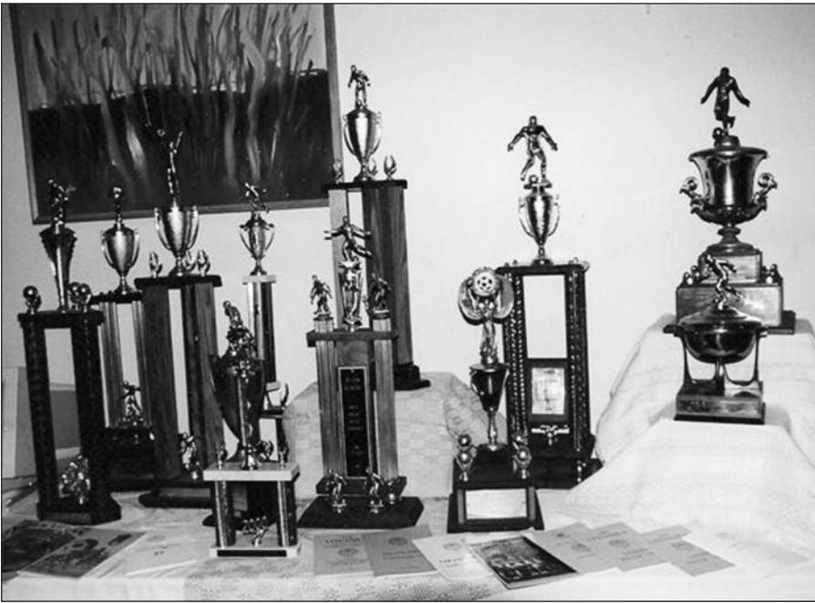
Dalis trofėjų, kuriuos per 60 veiklos metų yra laimėję LFK „Lituanicos“ futbolininkai.