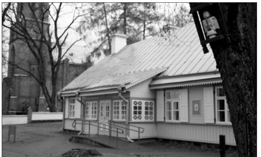
Kuklus Birštono sakralinis muziejus kasmet sulaukia daug lankytojų.