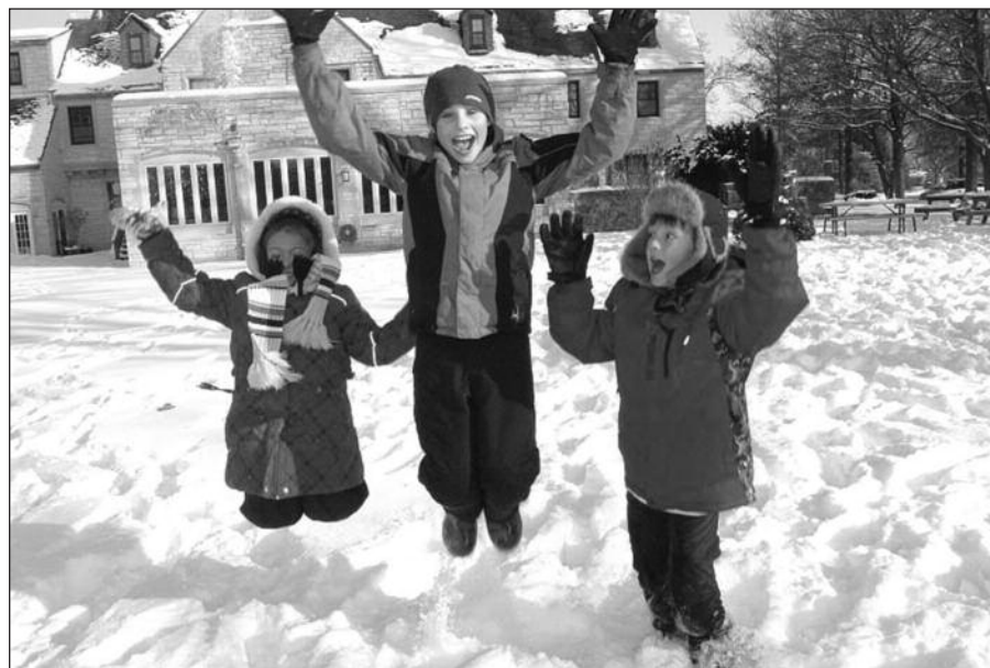
Žiemos džiaugsmas 2010 m. gruodžio 28–29 dienomis Ateitininkų namuose (Lemont) vykusioje Biblijinėje stovykloje.

Nuoširdžiai dėkojame už Jūsų dosnumą ir sveikiname tapus garbės prenumeratore.