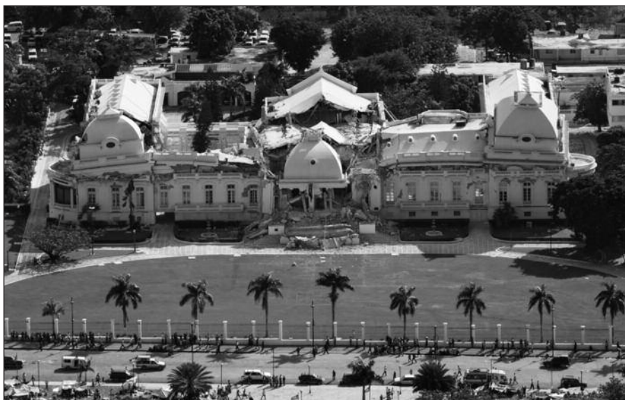
Šalies laisvės simboliu kažkada laikyti baltutėliai prezidento rūmai šiandien tėra griuvenų krūva. http://en.wikipedia.org

Haitis vis dar griuvėsiuose, tiek tiesiogine, tiek perkeltine prasme, nes tebuvo išvalyti vos 5 procentai sugriuvusių namų bei visuomeninių pastatų. Net jei viskas eisis pagal vietos valdžios numatytą planą, iki kitų metų nebus sutvarkyta nė pusė šalį slegiančių griuvenų.