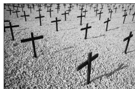
Haitis mini daugiau kaip 220 tūkst. gyvybių nusinešusio žemės drebėjimo metines.

Pagal „Foreign Policy“ ir „Newsweek“ informaciją parengė Jūratė Važgauskaitė Bernardinai.lt