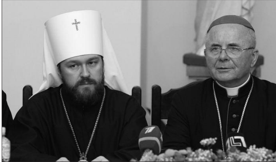
Lietuvoje viešintis metropolitas Hilarion ir Kauno arkivyskupas metropolitas Sigitas Tamkevičius.

Vilnius , sausio 11 d. (ELTA) – Pas Seimo pirmininkę Ireną Degutienę apsilankę bažnytinių konfesijų vadovai siūlė susitelkti, kad būtų apsaugotos šeimos vertybės. „Dėl demografinių pokyčių Lietuva atsidūrė