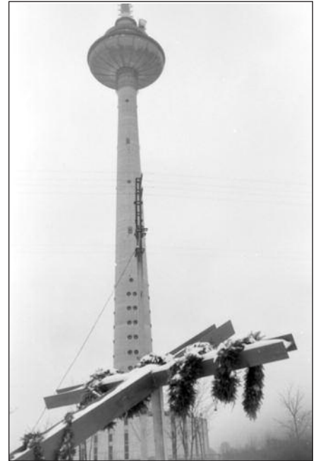
Vilniaus televizijos bokštas.

◆ Sausio 13-osios laisvės aukoms pagerbti Toronto Lietuvių namuose, 2011 m. sausio 16 d., sekmadienį, 2