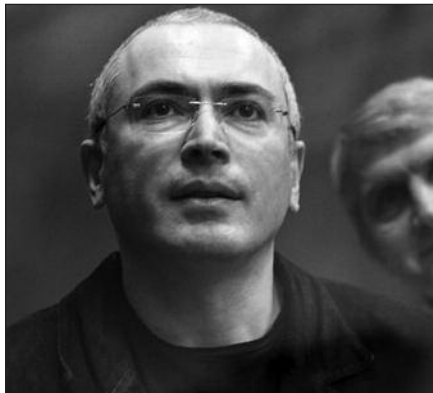
Buvęs „Jukos“ vadovas M. Chodorkovskij.

Briuselis , sausio 11 d. (BNS) – Europos Parlamento (EP) nariai siūlo pritaikyti ekonominius ir vizų apribojimus Rusijos pareigūnams, susijusiems su buvusio „Jukos“ vadovo Michail Chodorkovskij teismu ir nuosprendžiu.