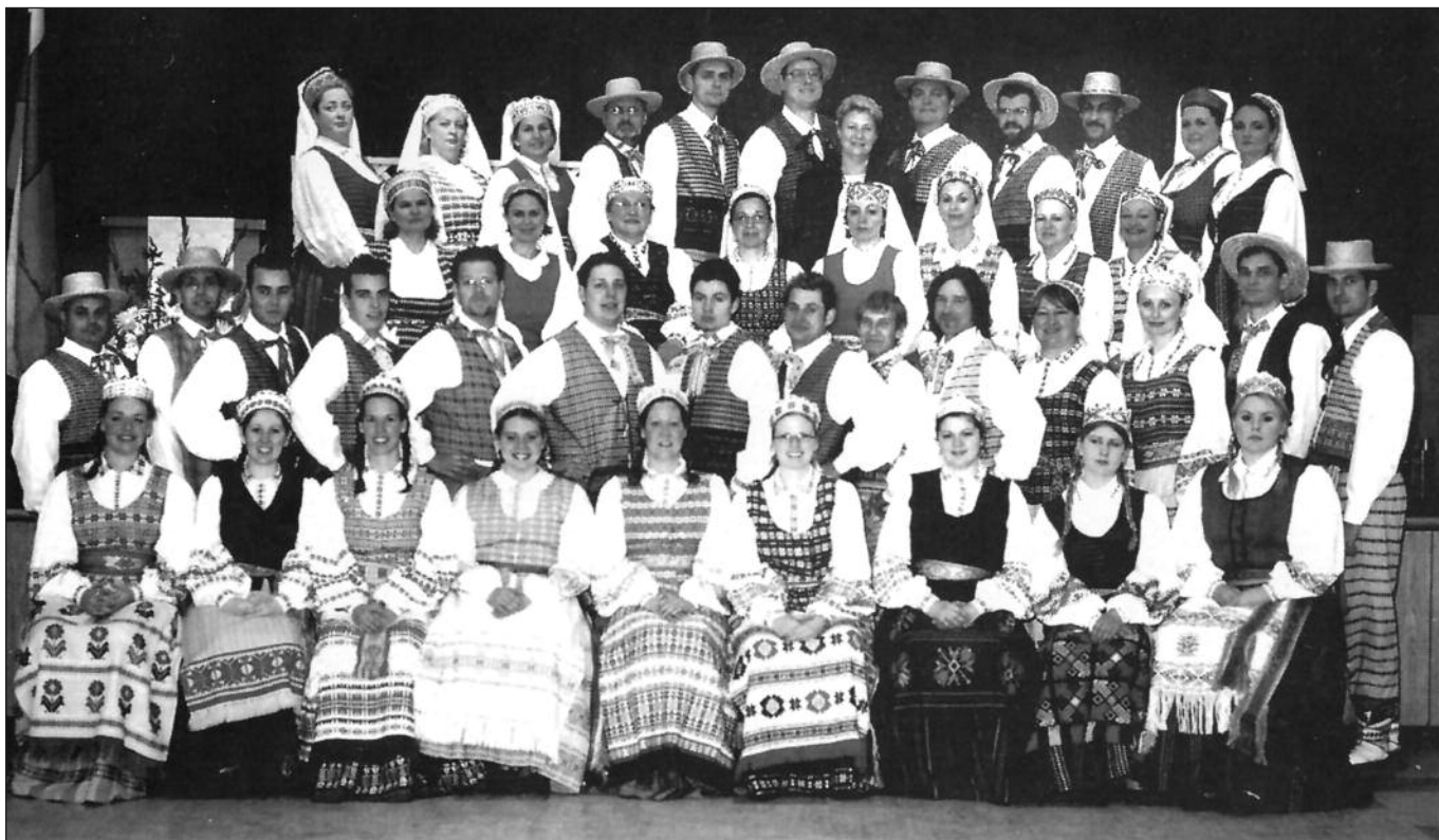
Toronto tautinių šokių grupė „Atžalynas”, XII Lietuvių tautinių šokių šventė, 2004 m.

Linkiu visiems „atžalyniečiams” geros kloties, įdomių repeticijų ir išpūdingo jubiliejinio koncerto.