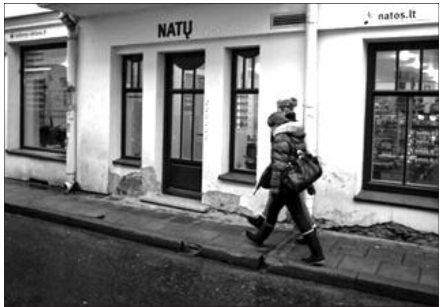
„Natų knygytas“ įsikūręs Totorių gatvėje, Vilniuje.

– Taip yra ne dėl vietos. Pvz., būna žmonių, kurie teiraujasi knygų apie kompozitorius – L. van Beethoven, F. Chopin. O tokių knygų lietuvių kalba tiesiog nėra išleista, arba buvo išleista seniai.