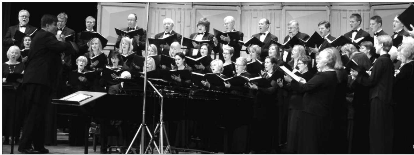
Sausio 23 d. Švč. Mergelės Marijos Gimimo bažnyčioje (Marquette Park) vyks lietuvių meno ansamblio „Dainava” susikaupimo popietė-koncertas „Aukos dvasia”, skirtas paminėti Sausio 13-osios įvykių 20-mečiui.