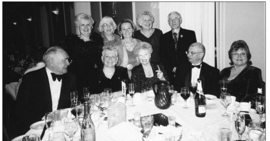
Naujųjų metų sutiktuvės Pasaulio lietuvių centre, Lemont, IL.