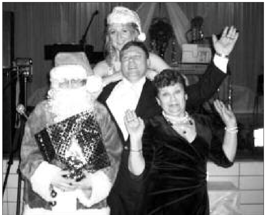
Taip 2010-uosius sutiko Brighton Park apylinkės nariai.

O kaip Naujuosius 2011-uosius sutikote Jūs? Lauksime Jūsų nuotraukų ir išpūdžių!