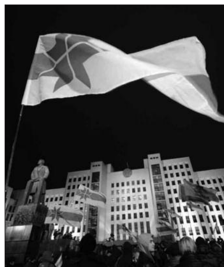
Baltarusiai Oktyabrskaja aikštėje, Minskas, 2010 metai.

Vilnius , gruodžio 29 d. (ELTA) – Už dalyvavimą proteste prieš nedemokratiškus Baltarusijos prezidento rinkimus Minske yra sulaikyta 11 Lietuvoje veikiančio Europos humanitarinio universiteto (EHU) studentų. Tokius duomenis Lietuvos studentų sąjungai pateikė pagalbos be-