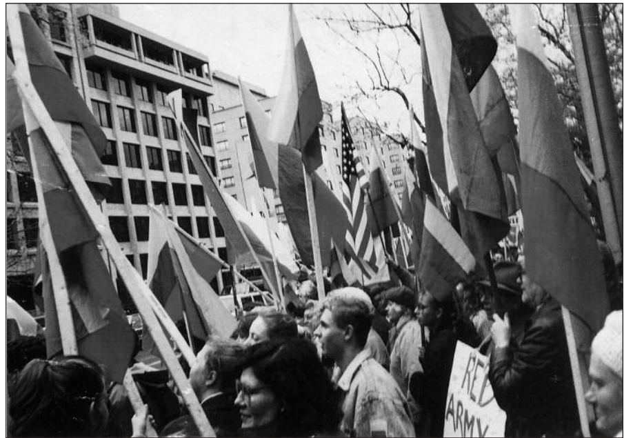
Amerikos lietuviai demonstruoja JAV sostinėje Washington, DC, 1990 m. balandžio 4 d.