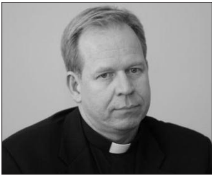
Vyskupas Gintaras Grušas.

Lapkričio mėn. 28 d. šv. Mišių metu Švč. Mergelės Marijos Gimimo parapijos bažnyčioje Marquette Park pagrindinis celebrantas buvo vyskupas Gintaras Grušas iš Vilniaus. Šv.