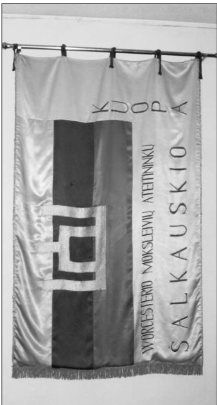
Worcester ateitininkų vėliava.

Padėkos dienos savaitgalį Čikagoje lankėsi nemažai svečių, tarp jų svečiai ir viešnios iš Lietuvos. Savo viešnagės metu jie dalyvavo Šiaurės Amerikos ateitininkų šimtmečio šventėje lapkričio 25–28 d., lankė Čikagos muziejus ir dangoraižius, susi-