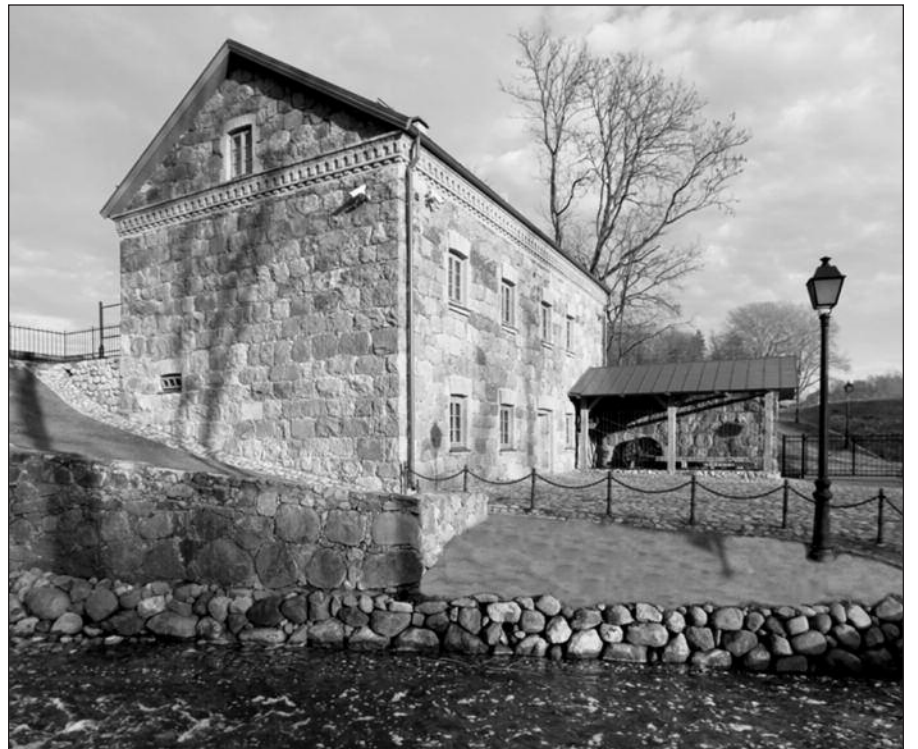
Restauruotas Liubavo dvaro vandens malūnas.

XIX-XX a. sandūroje Lietuvoje žinoma buvus apie 2000 vandens malūnų, daugiausiai Žemaitijoje ir Rytų Lietuvoje. Kultūros paveldo departamento duomenimis, dabar belikę vos šeštadalis. Kai kuriuose iš jų įkurti restoranai, viešbučiai, kavinės, moteliai, o geriausiai žinomas kultūros paminklu paskelbtas Ginučių vandens malūnas Ignalinos rajone, kuriame rekonstruota įranga, veikia muziejus. Lankytojų gausiai lankomi ir Vilniuje esantys Belmonto bei Verkių vandens malūnai.