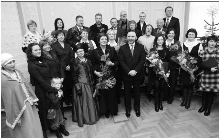
Kultūrininkams ir menininkams įteiktos įvairių dydžių premijos.