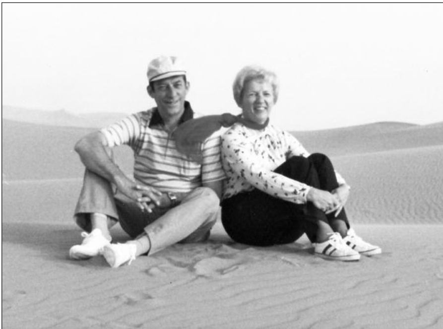
Vaitaičiai Saudo Arabijos smėlynuose, 1980 metais.