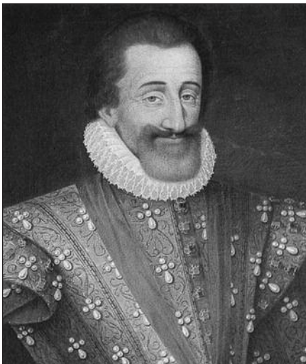
Prancūzijos karalius Henriko IV.