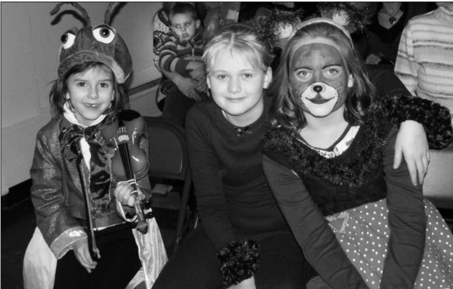
Smuiką čirpino žiogas ir daina jam pritarė meškiukai.