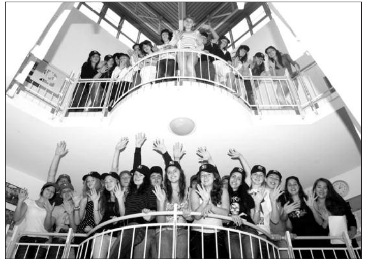
Gimnazistai draugiški, motyvuoti ir linksmi.