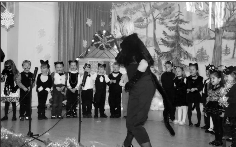
Kačiukai ir mama Katė scenoje šoko Kačių šokį.

Kalėdos, Kalėdos... Kas jų nelaukia? Be jokios abejonės – tai didžiausia šventė vaikams. Laiškų rašymas Kalėdų seneliui, noras prieš Kalėdas būti geriems (Kalėdų senelis dovanas tik jiems duoda), pasiruošimas mokykliniam kalėdiniam koncertui, eglutės puošimas, karnavalinių kaukių darymas – tokiomis nuotaikomis vaikai gyvena prieš šią gražiausią metų šventę.