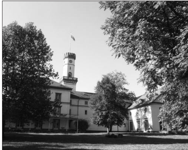
Lietuviškoji Rennhofo pilis.