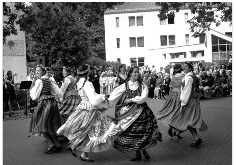
Mokiniai iš Pietų Amerikos pasirodo gimnazijos Joninių programoje.

„Vasario 16-osios gimnazija ypatinga tuo, jog ji yra ne tik vienintelė Vakarų pasaulyje valstybės pripažinta lietuviška švietimo įstaiga, bet ir