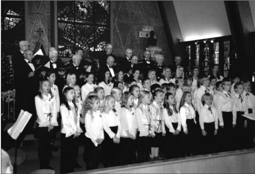
Misijos choro vyrai drauge su „vyturiukais“ įspūdingai atliko tradicinį Kalėdų kūrinį „Mažasis būgnininkas“.