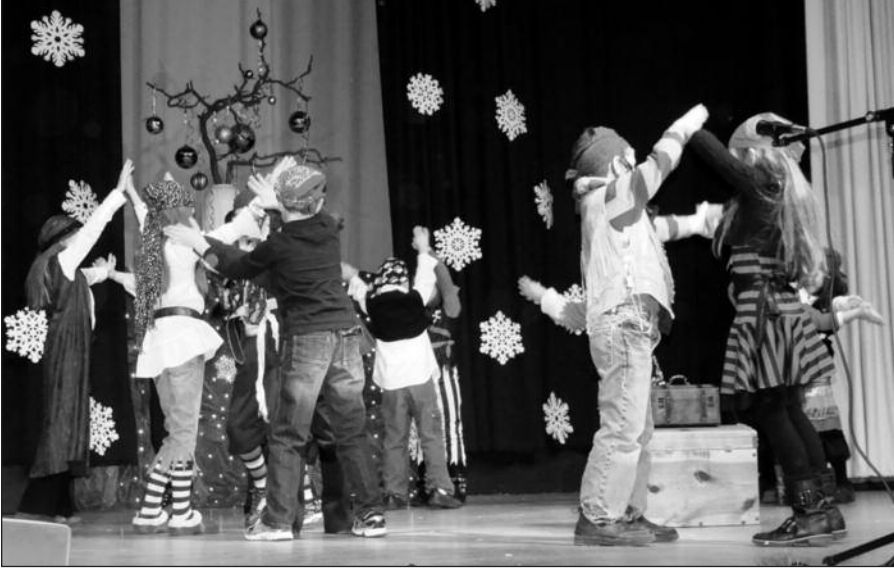
2 A klasės mokinių-piratų šokis patiko žiūrovams.