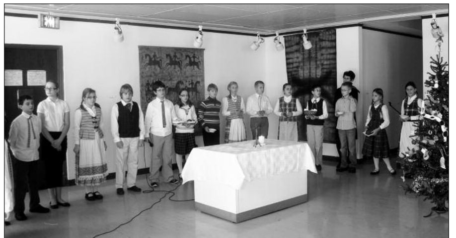
Penktokai susikaupę šventė Kūčias.