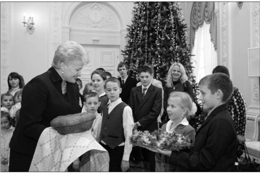
LR prezidentė Dalia Grybauskaitė susitikime su Baltarusijoje veikiančių lietuviškų mokyklų mokiniais ir jų mokytojais.