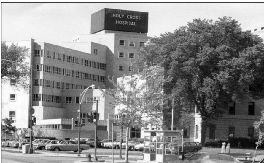
Holy Cross ligoninė Čikagoje.

Jau kuris laikas Holy Cross ligoninė buvo ant uždarymo slenksčio. Prieš dvejus metus ligoninė turėjo