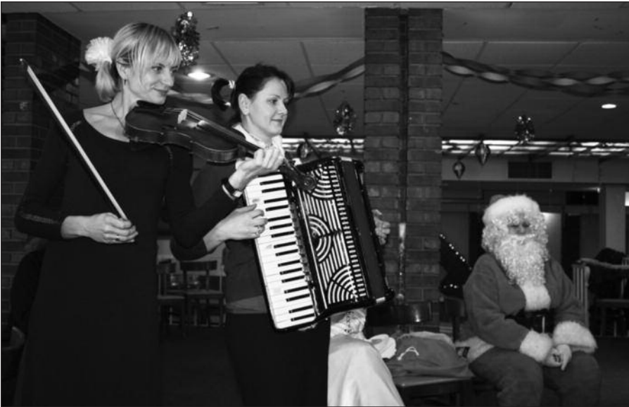
Kalėdų senelis atidžiai stebi mokytojų-mokinių kalėdinį pasirodymą.