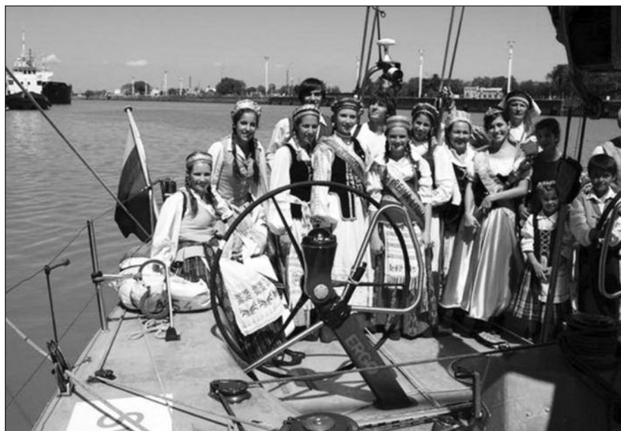
„Tūkstantmečio odisėjos” buriuotojai lanko Argentinos lietuvių bendruomenes.

„Tūkstantmečio odisėja” visas lietuvių bendruomenes po mažą karoliuką iš lėto, bet užtikrintai veria į nuostabų vėrinį. Bus daugiau.