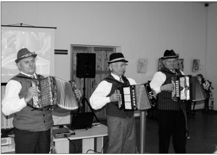
Marijampolėje knygos pristatyme dalyvavo ir Lenkijos lietuvių etninės kultūros draugijos grupė „Kaimo muzikantai“.