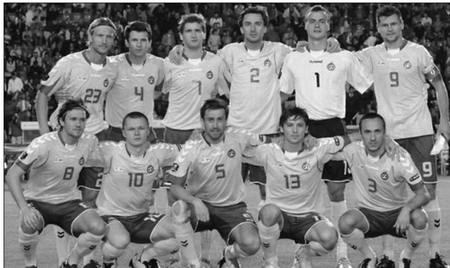
Dabartinė Lietuvos valstybinė futbolo rinktinė.

Kita Lietuvos varžovė atrankinėse varžybose – Lichtenšteino rinktinė – pakilo dešimčia vietų, tačiau jos vieta gana kukli – 148-oji.