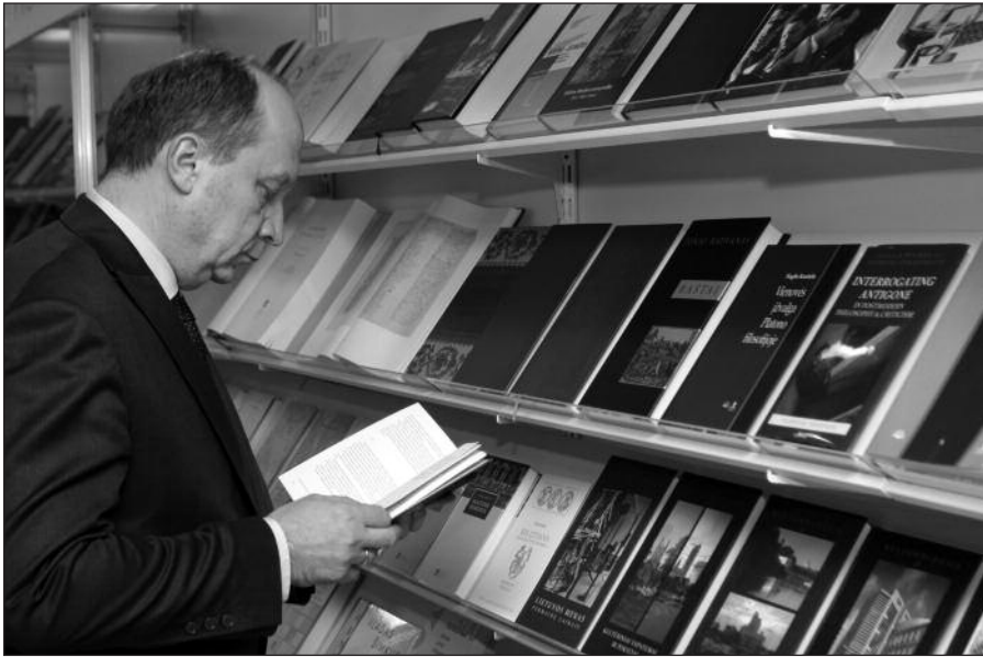
Parodą apžiūri premjeras Andrius Kubilius.