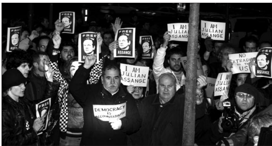
Ispanijoje vyksta protestai dėl J. Assange suėmimo.