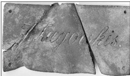
Lentelė. II pusė. J. Zagorskis.

Į Biržų krašto muziejaus „Sėla“ darbuotojus kreipėsi jaunas Naciūnų kaimo gyventojas, pranešęs, kad rado nedidelę, 4,5 x 9 cm metalinę plokštelę savo tėvų darže. Ir jį patį, ir mus sudomino išgraviruoti užrašai ant plokštelės – vienoje pusėje „Jonas Zagorskis vyr. leitenantas“, kitoje „J. Zagorskis“.