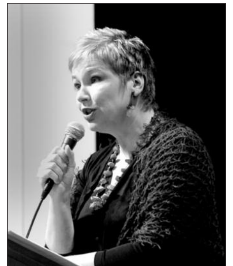
Vakarą vedė aktorė Audrė Budrytė.