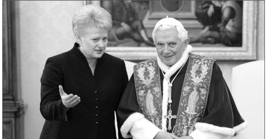
Lietuvos prezidentę Vatikane priėmė popiežius Benediktas XVI.

„Lietuva remia Švento Sosto pastangas skatinti civilizacijų dialogą, stiprinti pakantumą tarp skirtingas religines konfesijas išpažįstančių tikinčiųjų. Vilnius, kuriame nuo seno taikiai sugyveno įvairios religinės bendruomenės, yra ideali vieta ekumeniniam dialogui tarp Romos katalikų ir Rusijos ortodoksų bažnyčių vadovų“, – kalbėjo prezidentė D. Grybauskaitė.