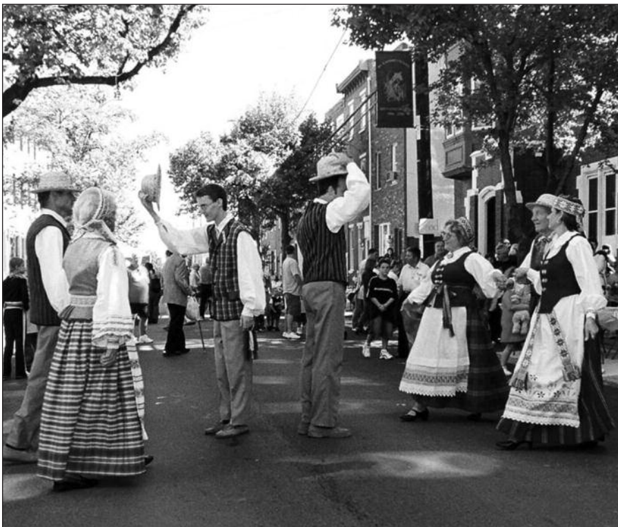
„Žilvinas“ šoka Šv. Kazimiero seniausios Philadelphia lietuvių parapijos gegužinėje.

Philadelphia lietuviai linki „Žilvino“ šokėjams geriausios sėkmės tolimoje Australijoje. Lauksime sugrįžtant!