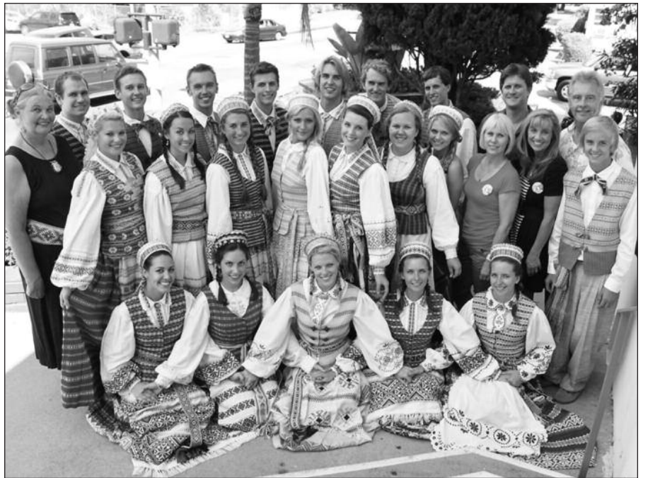
„LB Spindulys“ po Los Angeles LT dienų.