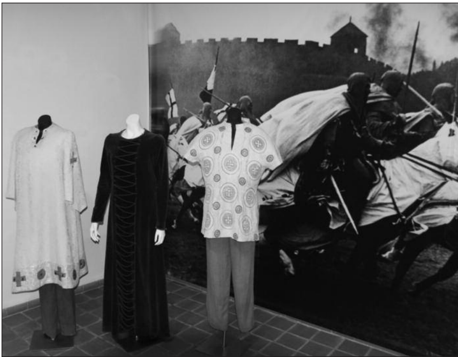
„Herkaus Manto“ filmavimo aikštelė.