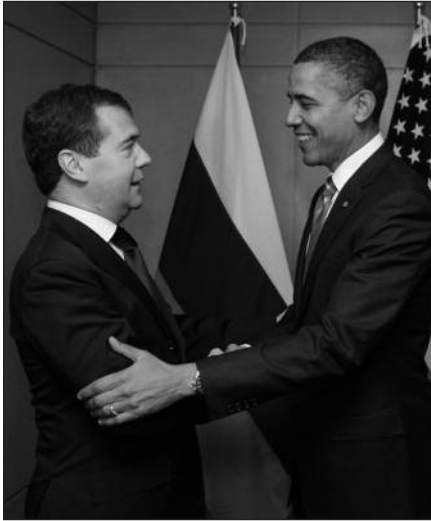
Rusijos ir JAV prezidentai D. Medvedev (k.) ir B. Obama per APEC viršūnių susitikimą Jokohamoje.

Washington, DC, lapkričio 15 d. (BNS) – JAV prezidentas Barack Obama optimistiškai vertina branduolinės ginkluotės mažinimo sutarties su Rusija patvirtinimą, teigdamas, kad Senate sutartis sulauks pritarimo.