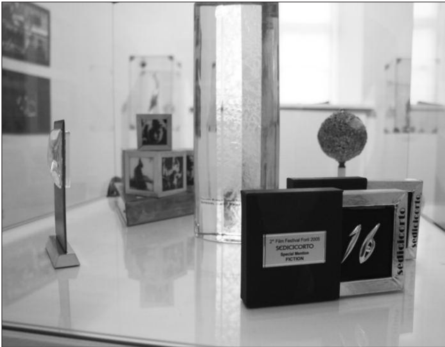
Apdovanojimai lietuviškam kinui.