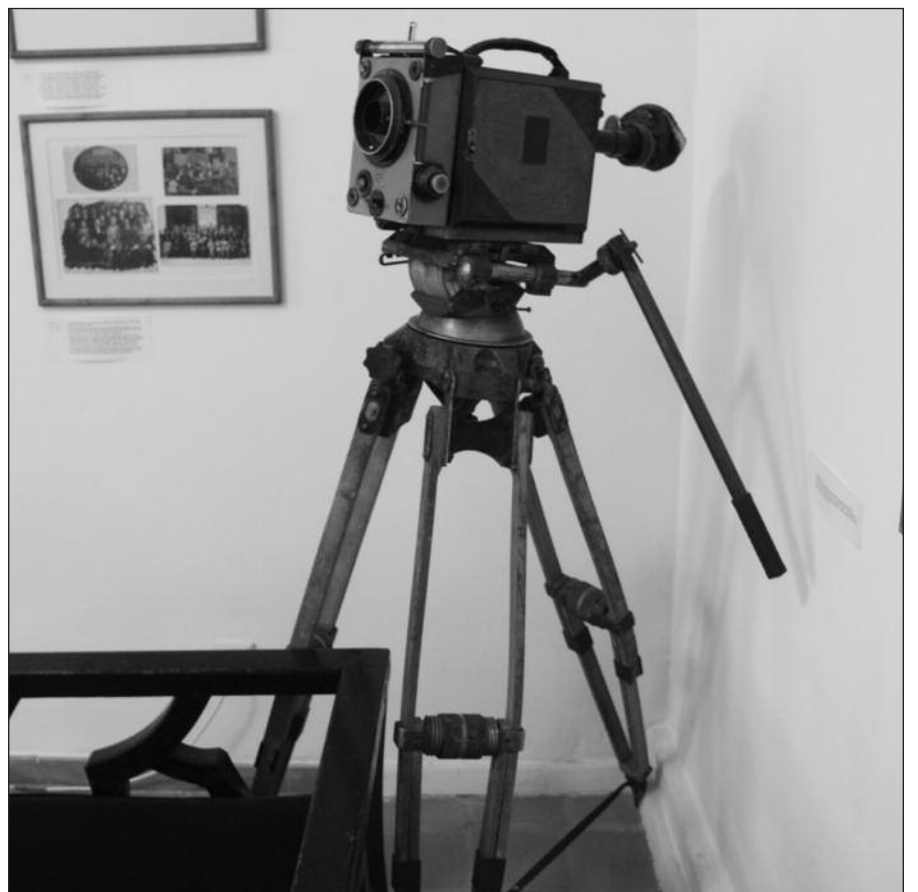
Parodoje – ir senoji kino technika.

Visa tai apžiūrėjus, susidaro įspūdis, kad per tą šimtą metų lietuviškas kinas tikrai nuėjo kelią, kuriuo verta didžiulis, nors sovietmečiu apie penkis dešimtmečius filmai buvo cenzūruojami ir ideologizuojami. Šiuo metu Lietuvoje kasmet sukuriama po kelis vaidybinius filmus, o mūsų dokumentinio kino kūrėjai beveik kasmet įvairiuose kino festivaliuose pelno pagrindinius prizus ir apdovanojimus.