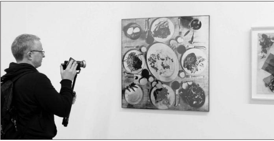
Vilnius, lapkričio 16 d. (ELTA) – Jono Meko vizualiųjų menų centre atidaryta paroda „Raktas į meną“. Paroda skirta „Fluxus“ meno pradininko Jurgio Mačiūno 79-osioms gimimo metinėms. Lankytojai gali apžiūrėti kelias temines piešinių, koliažų, fotografijų, objektų serijas.