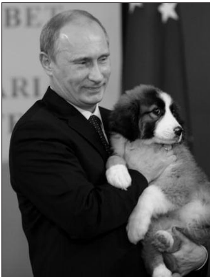
V. Putin Bulgarijoje dovanų gavo šuniuką.

Vilnius, lapkričio 15 d. (BNS) – Rusijos premjeras Vladimir Putin šeštadienį išvyko iš Bulgarijos sostinės Sofijos su dviem diplomatinėmis dovanomis: sutartimi dėl vamzdyno, kuriuo „Gazprom“ dujos bus tiekiamos Europos Sąjungai (ES), bei šuniuku, kurį jam padovanojo premjeras Boiko Borisov.