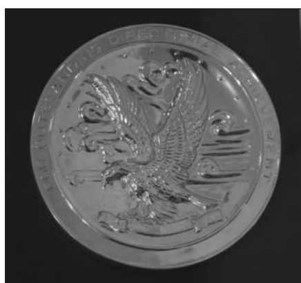
Amerikos kino režisierių gildijos apdovanojimas filmui „Prieš parsikrendant į žemę“.