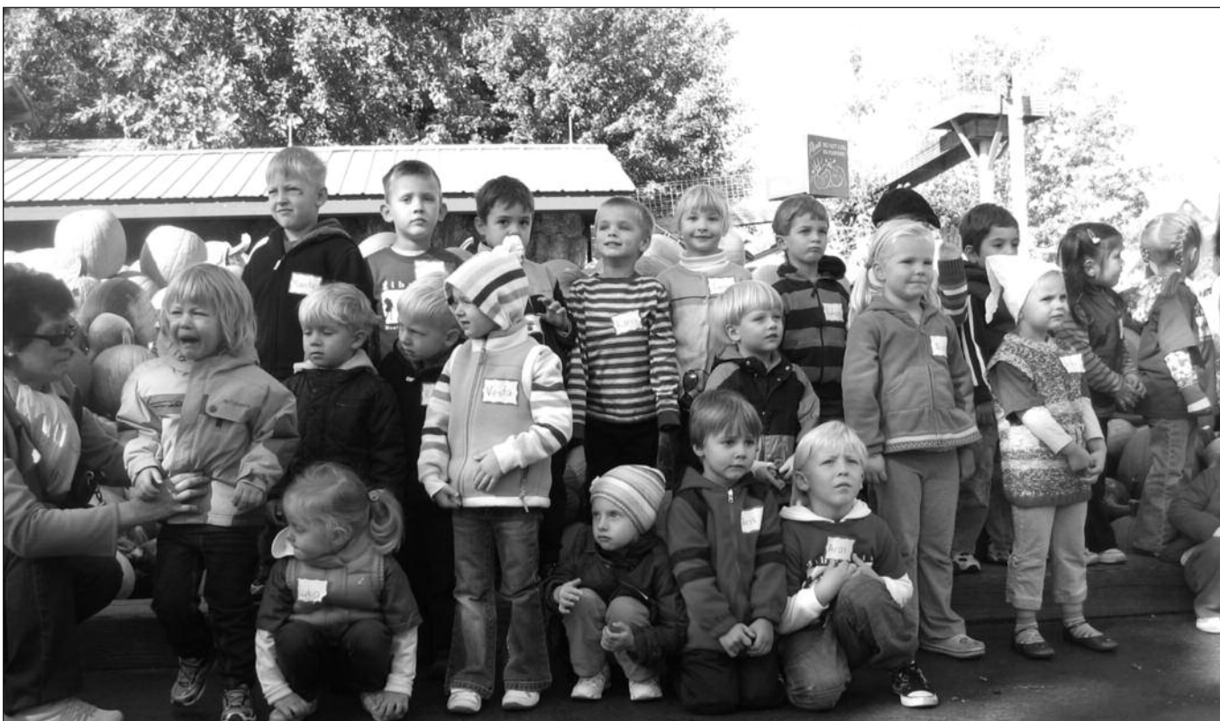
Kiekvienais metais „Žiburėlio“ mokyklėlė vyksta į moliūgų ūkį pasidžiaugti rudens gėrybėmis.