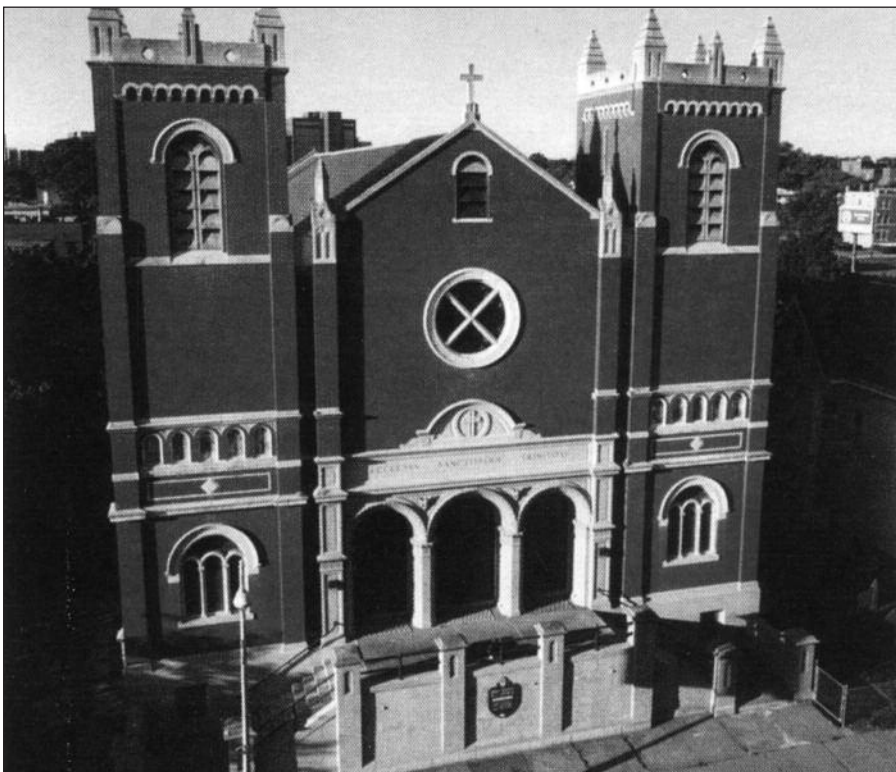
Šv. Trejybės lietuvių bažnyčia Hartford, CT, 2000 metai.

Iš knygos „Lietuvių pėdsakai Amerikoje“.