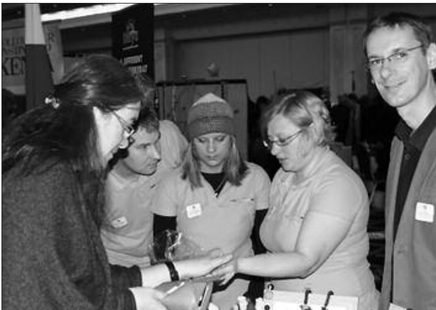
Dublinas , lapkričio 10 d. (URM info) – Dubline vyko tarptautinė labdaros mugė, kurią surengė Lietuvos ambasada ir kitų užsienio šalių diplomatinės atstovybės Airijoje. Iš viso joje dalyvavo daugiau kaip 40 valstybių. Lietuvos stende mugės lankytojai galėjo paragauti tradicinių lietuviškų maisto gaminių ir gėrimų, įsigyti lietuvių menininkų kūrinių, gauti informacijos apie Lietuvą. Šių metų mugėje surinktomis lėšomis bus finansuojami penki labdaros projektai: parama bus skiriama specialiu poreikius turintiems Gruzijos vaikams, nuo potvynio nukentėjusiems Pakistano žmonėms, nuo žemės drebėjimo nukentėjusiems Haičio vaikams, imigrantų vaikų laisvalaikio centrui Airijoje ir Dublino motinystės ligoninės sunkiai sergančių ligonių priežiūrai.

Šiuo metu vyksta parengiamieji darbai MIATLNA programos įgyvendinimui 2011 metais. Programos įgyvendinimui Lietuvoje skirtų maisto produktų, administracinių ir transporto išlaidų vertė sieks 26,87 mln. litų. Visa 2011 metų programos įgyvendinimo vertė 20-ye valstybėse narėse, kurios pareiškė norą dalyvauti programoje, sudarys beveik 1,66 mlrd. litų.