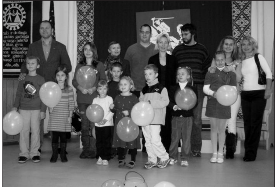
Naujoji lituanistinė mokyklėlė nedidelė – kol kas 12 mokinių, bet tikimasi, jog ateityje jų skaičius išaugs.