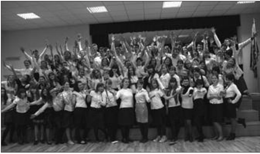
Šiomet šimtmetį švenčianti Ateitininkų federacija yra seniausia Lietuvos jauni- mo organizacija.

Vilnius , spalio 22 d. (DELFI.lt) – Penktadienį prasidėjo penkias dienas truksianti Moksleivių ateitininkų rudens akademija „Atrask tiesą, griauk mitus!“ Tradiciniame renginyje Kaune daugiau kaip šimtas jaunų žmonių – moksleivių ir jiems vadovaujančių studentų – diskutuos religinio sąmoningumo klausimais, ugdyt gebėjimus skleisti savo tikėjimą kasdienėje aplinkoje.