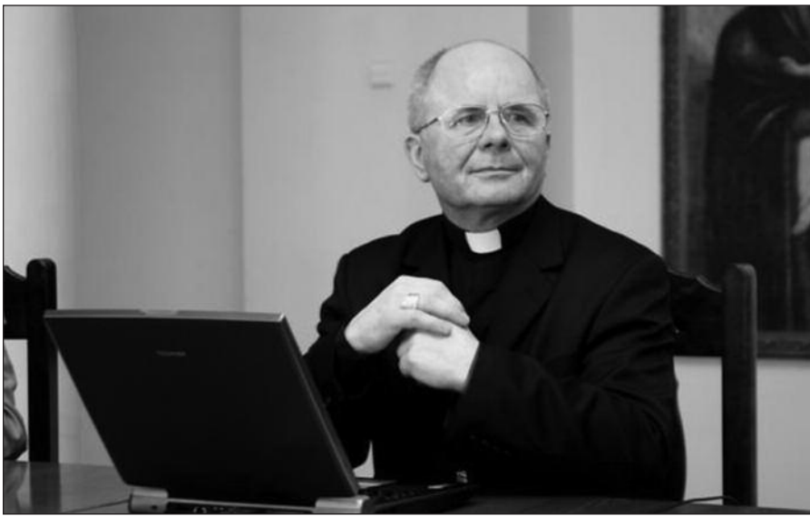
Arkivyskupas Sigitas Tamkevičius, SJ.

1976 m. Lietuvoje pradėjo eiti pagrindinio leidinio „Aušra“, kėlęs sau uždavinį budinti ne tik religinę, bet ir tautinę bei pilietinę žmonių sąmonę. Kadangi KGB organams nepavyko likviduoti pirmųjų pagrindinio leidinių, vienas po kito praėjo atsirasti vis naujų ir naujų leidinių, atsiliepusių į skirtingus įsitikinimus žmonių, kuriuos vienijo viena idėja – siekti minties, sąžinės, tikėjimo, o galbūt ir visiškos laisvės.