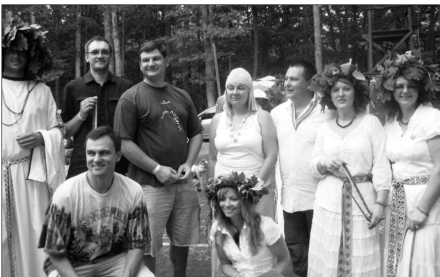
New Jersey apylinkės narių entuziazmas ir kūrybiškumas tikrai išskirtinis.

– Esu kilusi iš Dzūkijos, gimiau ir augau Alytuje. Po vidurinės baigiau medicinos mokyklą, vėliau studijavau Vilniaus Gedimino technikos universitete, kuriame įgijau verslo vadybos bakalaurą. Amerikoje gyvenau septynerius metus. Daug metų grojau kanclėmis garsiaame Alytaus „Dainavos“ ansamblyje. Man patinka kelionės, klasikinė muzika, poezija ir, aišku, bendrauti su bendraminčiais. Džiaugiuosi, kad subūrėme lietuvių į būrį. Ir, manau, sėkmingai toliau dirbusimės lietuvių labai.