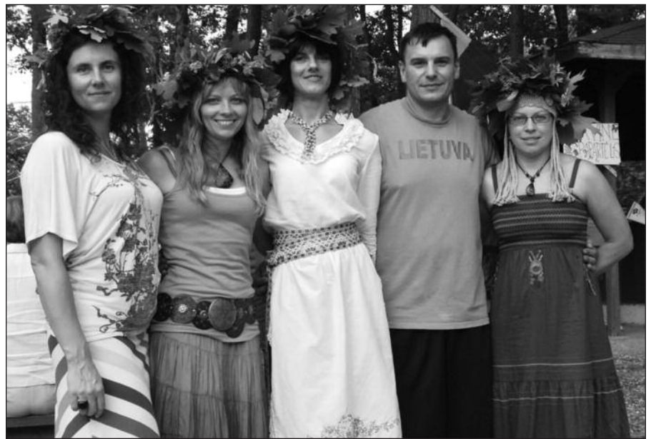
Centrinio NJ apylinkės valdybos nariai.

– Gegužės 16 dieną jau buvo nuspręsta, kad bus reikalinga mokykla, nes Lietuvių Bendruomenės ateitis –