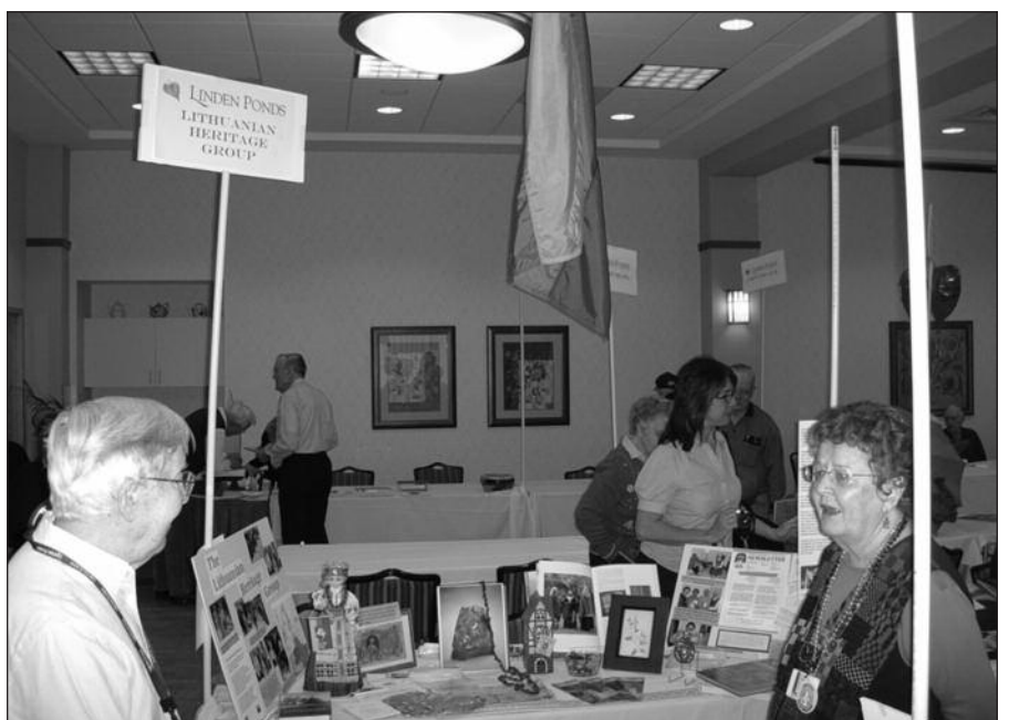
Lietuviškas parodos stalas.