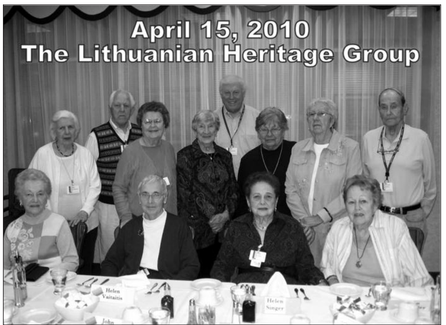
Klubo „The Lithuanian Heritage Group“ nariai.