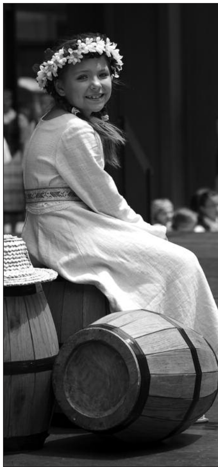
Kol šventė prasidės, galima ir ant statinės pasėdėti.

„Kai aš buvau maža, aš šokau rusišką baletą, tada aš sugalvoju