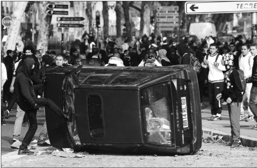
Lione vyksta studentų ir moksleivių demonstracija prieš pensijų pertvarką.