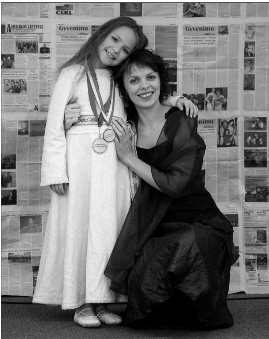
Po konkurso su mama. Įtampa jau atslūgusi, likęs tik nugalėtojos džiaugsmas.

Taškas. Nuginklavo. Pasiduodu. Neabejoju – Agnei nereikia sakyti antrą kartą.