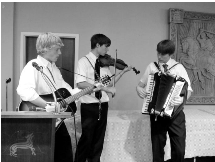
„Derliaus pietų“ trio.

Organizacijos tinklalapis www.childgate.org