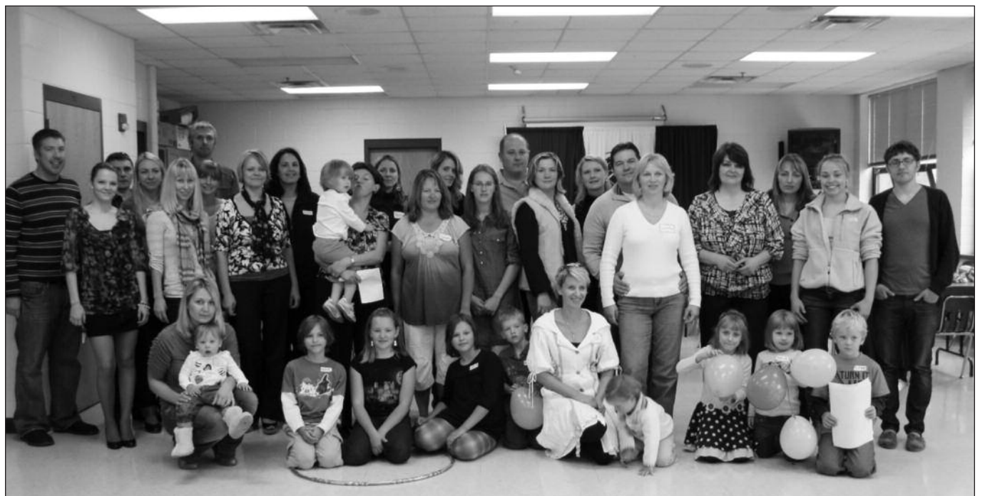
Į pirmosios lituanistinės mokyklos atidarymą susirinko didelis lietuvių kalba, kultūra ir istorija besidominčių lietuvių ir jų vaikučių.