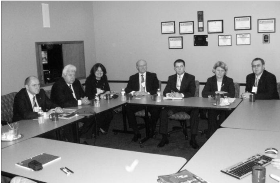
Šiauliečių delegacija Omaha prekybos rūmuose.

Viena tokių sutarčių 1996 m. buvo pasirašyta tarp Omaha ir Šiaulių miestų. Nuo tada Šiaulių universitetas ir Omaha bei Creighton University (Omaha). Bendradarbiavimas vyksta mokslo, meno ir kultūros srityse, keičiamasi studentais ir dėstytojais.