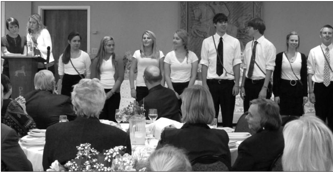
„Derliaus pietų“ savanoriai.