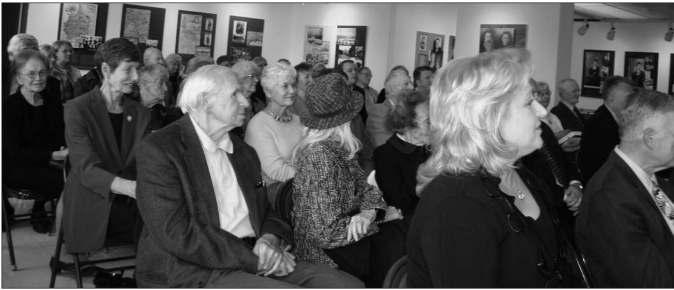
! „Mažosios Lietuvos enciklopedijos“ IV tomo sutiktuves susirinko nemažai tų, kuriems rūpi Mažoji Lietuva.