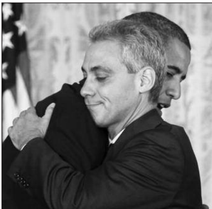
R. Emanuel (d.) – įžvalgus politikas, kurio rinkimų kampaniją remia JAV prezidentas B. Obama.

Washington, DC, spalio 4 d. (BNS) – Buvęs Baltųjų rūmų administracijos vadovas Rahm Emanuel oficialiai įsitraukė į rinkimų kampaniją dėl Čikagos mero pareigų, nurodoma jo tinklalapyje paskelbtame vaizdo pranešime. Atsistatydinęs Baltųjų rūmų administracijos vadovas R. Emanuel sieks tapti Čikagos meru.