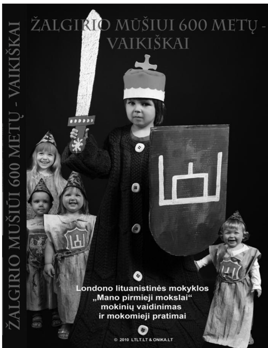
Filmo vaikams „Žalgirio mūšiui 600 metų – vaikiškai“ viršelis – iš Knygnesys.co.uk