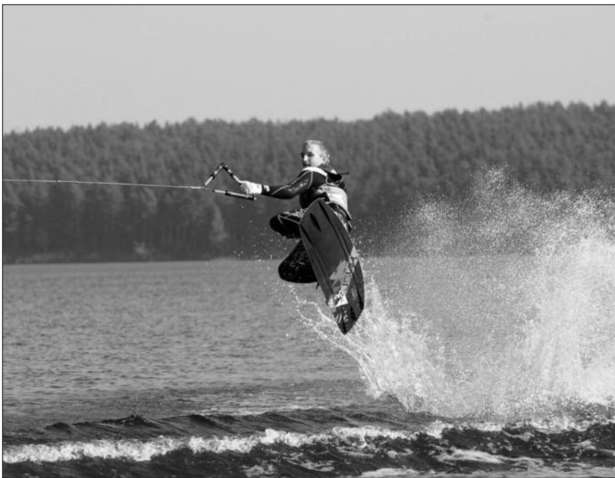
Savaitgalį Kauno mariose vyko tradicinė regata „Paskutinis griaustinis 2010“, skirta skatinti domėtis įvairiomis vandens sporto šakomis.