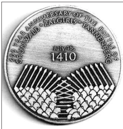
Medalis Žalgirio 600 m. pergalei atminti. Medalį projektavo dail. A. Každailis, atliko dail. A. Jonušauskas. Pagamino Metallo meninio apdirbimo centras Kaune.

Spalio 15–17 d. Balzeko Lietuvių kultūros muziejuje vyks renginys, skirtas Žalgirio mūšio 600 m. sukakčiai paminėti. Pagrindiniai šio renginio sumanytojai – čikagiškiai lietuvių ir lenkų filatelista: lietuvių filatelistų draugija „Lietuva“ bei lenkų – „Polonus“. Tokio renginio mintis gimė prieš trejus metus, lenkų filatelistas pakvietus pagalvoti apie bendrą renginį, kuris apjungtų abiejų draugijų pastangas įamžinant istorinę Žalgirio mūšio 600 m. pergalės sukaktį. Pasiūlymas pasirodė įdomus ir lietuviai filatelista pasvarstė jį priėmė. Netrukus buvo sudaryta iniciatyvinė grupė, kuri ir ėmėsi įgyvendinti istorinio įvykio paminėjimą.