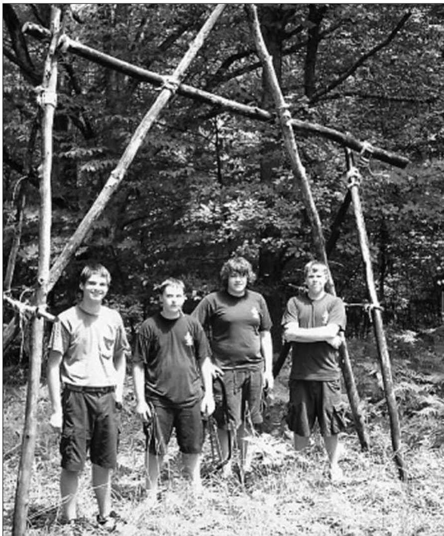
Prityrusių skautų pastovyklės dalyviai.