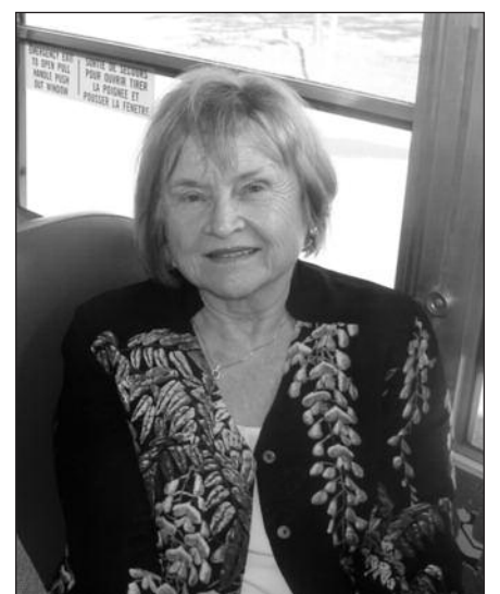
Danguolė Šeputaitės-Jurgutienė