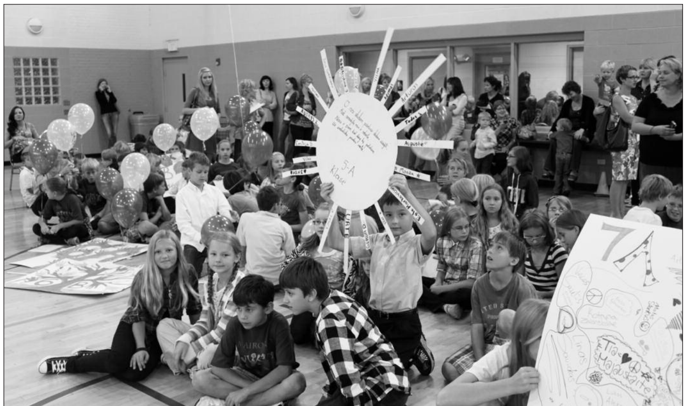
Nauji mokslo metai prasidėjo!