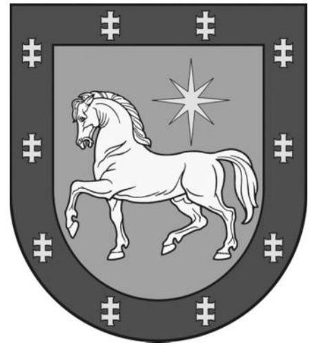
Utenos apskrities herbas

vieno Vilniaus padalinio 2000-ųjų pavasarį, „Moki – veži“ išaugo iki 500 darbuotojų komandą turinčios ir sparčiai besiplečiančios įmonės.