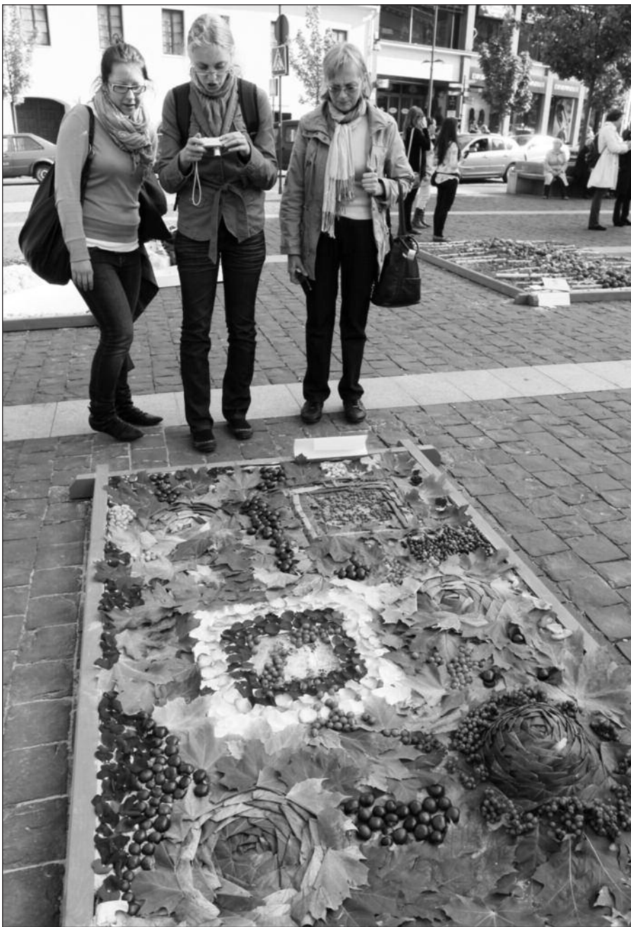
Vilniaus Rotušės aikštėje atidaryta gėlių kiliminių kompozicijų paroda „Rudeninis Vilnius 2010“. Tris rudens dienas sostinės gyventojai ir svečiai Rotušės aikštėje grožėjosi įvairių dydžių kilimais, sukurtais iš gyvų gėlių bei vaisių.