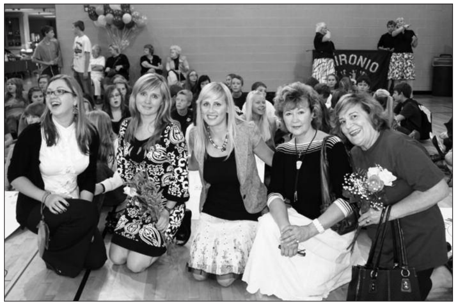
Mokytojos gerai nusiteikusios prieš naujus mokslo metus.