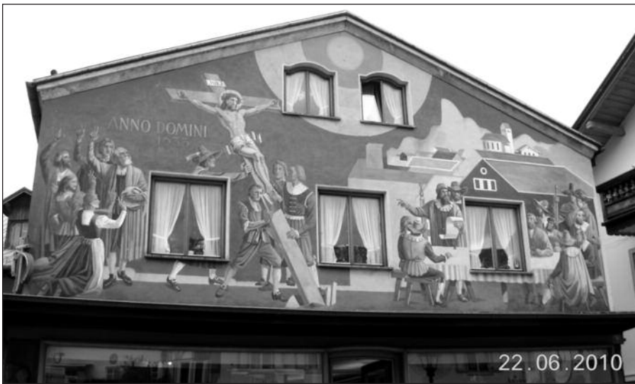
Vienas iš Oberammergau pastatų su religiniais vaizdais.