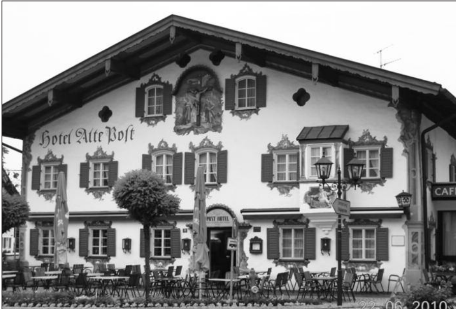
Vienas iš Oberammergau viešbučių, kuriame nakvojo straipsnio autorė.

Apie 500,000 piligrimų 2010 metais aplankys šį Bavarijos Alpėmis apsuptą miestelį