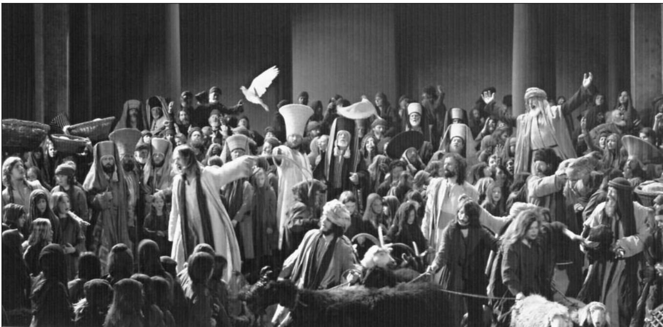
Jėzaus nukryžiuojimas scenoje.