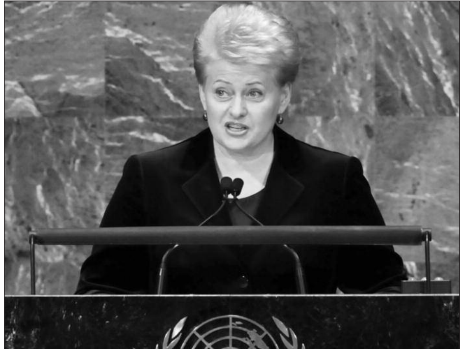
Lietuvos Respublikos prezidentė Dalia Grybauskaitė kalba JT Generalinės Asamblėjos 65-osios sesijoje.

„Nors Lietuva ir nėra turtinga valstybė, ji teikė humanitarinę pagalbą Haičiui, Pakistanui, Moldovai, Ukrainai, Rusijai ir kitoms šalims. Mes ėmėmės tokių sunkių iniciatyvų kaip nacionalinių saugumo pajėgų mokymas Afganistane. Bendras darbas leido pasiekti, kad Lietuvos lėšomis Afganistano Goro provincijoje buvo vykdomos bendruomenės švietimo programos, pastatyta 19 mokyklų, kurios atvėrė duris ir mergaitėms, įkurta pirmoji viešoji biblioteka provincijos sostinėje Nukelta į 6 psl.