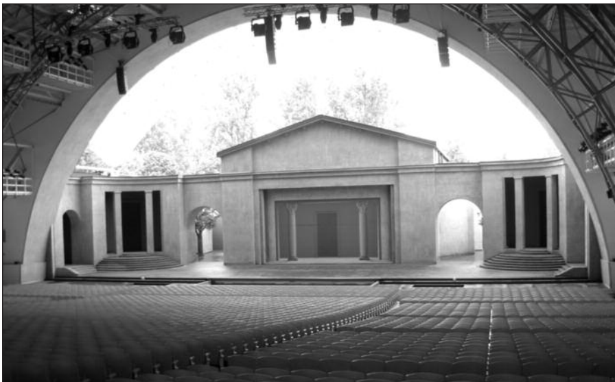
„Kandios“ teatro vidus su 4,800 vietų žiūrovams.