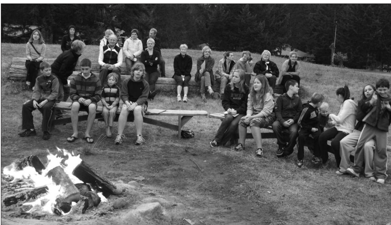
Šių metų „Lanko” stovyklos stovyklautojai stovykla tikrai nenusivylė.