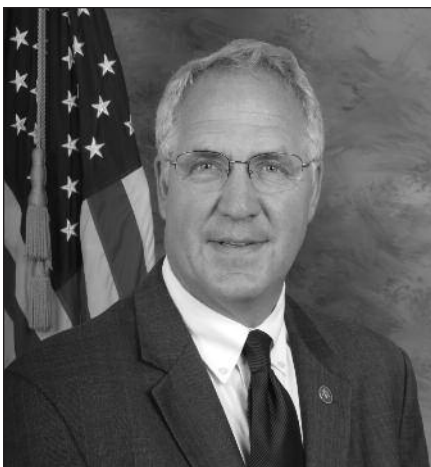
JAV Atstovų rūmų narys, Atstovų rūmų Baltijos komiteto narys John Shimkus.

Washington, DC , rugsėjo 23 d. (ALT'o ir „Draugo“ info) – Amerikos lietuvių taryba (ALT) kviečia visuomenę kreiptis į JAV Kongreso narius, kad būtų priimta Baltijos šalių rezoliucija, siekiant pažymėti Lietuvos, Latvijos ir Estijos 20 metų nepriklausomybės sukaktį. Nukelta į 6 psl.