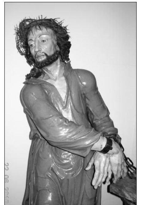
Miestelio menininkų medžio drožiniai religinėmis temomis.

Visi dalyvaujantys gyvuliai yra arba vietiniai, arba iš aplinkinių miestelių. Pirmasis, kuris pasirodo, yra asiliukas, kuriuo į sceną atjoja vaidintojas, vaidinantis Jėzų. Minioje matėme ir avių, ir ožkų, vištų, ir net praskrendančių balandžių. Vėliau nukryžiuojimo scenoje ant arklio atjoja romėnų karys, o vaidinimo antroje