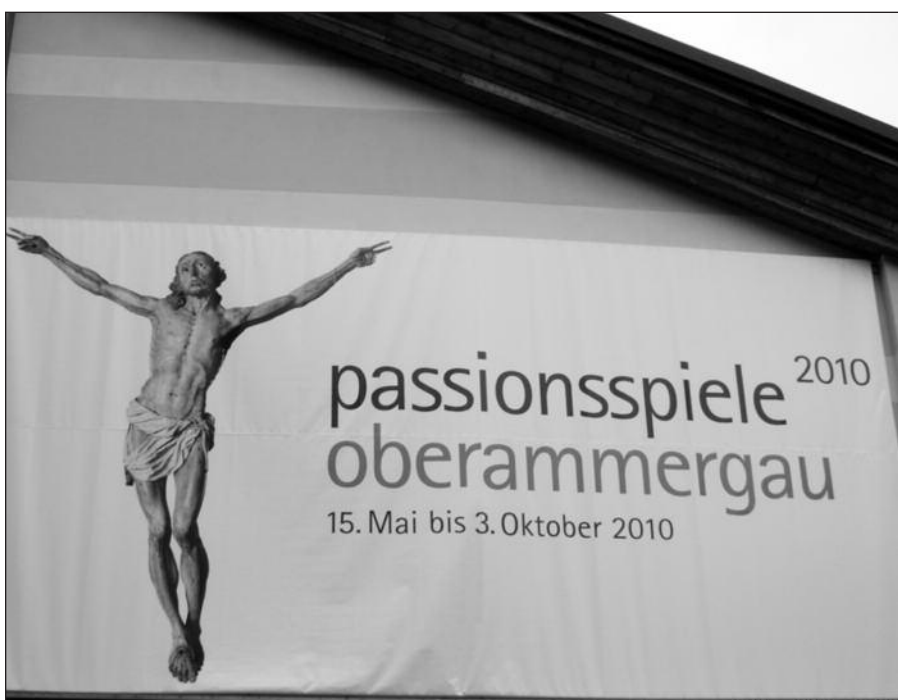
Vaidinimo reklama ant teatro priekinės sienos.

Kai kitą rytą po spektaklio sulipome vėl į autobusą, mūsų kelionių vadovė paklausė, ar spektaklis atitiko mūsų lūkesčius. Visi sušukome, kad jis mūsų lūkesčius net viršijo. Ir supratome, kodėl yra žmonių, kurie po dešimties metų grįžta antrą kartą pasisemti dvasiško peno tokiomis ypatingomis sąlygomis, kuriose atspindi šio miestelio gyventojų pašventimas religiniam projektui, artėjančiam prie 400 metų jubiliejaus.