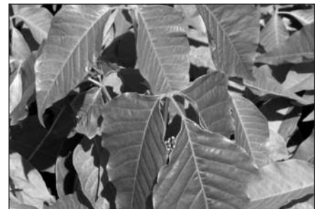
Vakarinė nuodingoji gebenė.

Parengta pagal CDC informaciją