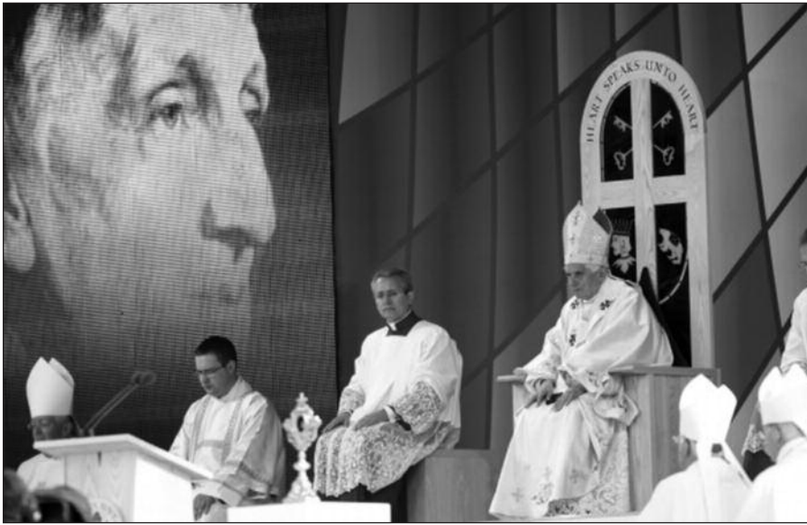
Britų salose viešintis popiežius beatifikavo anglikonų dvasininką, atsivertusį į katalikybę.