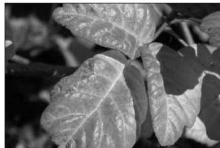
Ramiojo vandenyno nuodingojo ažuolo lapai.

linkoje kaip parkuose ar namų kiemuose. Nuodinga gebenė auga visose JAV valstijose, išskyrus California, Alaska ir Hawaii. Nuodingas ažuolas auga pietryčių ir vakarų pakrantėse, o nuodingas žagrenis yra paplitęs prie Mississippi upės ir pelkėtose pietrytinių valstijų vietose.