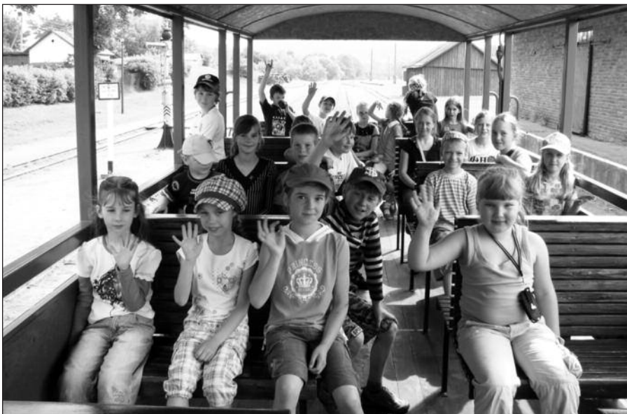
Pasivažinėjimas vasaros rogučiais.

stovyklą, kurioje mokiniai galėjo atskleisti savo kūrybinius talentus, išreikšti save. Rengėme pačių sukurtų drabužių „madų šou“, renginį „Mes talentai“, vyko sportinės varžybos, aplankėme „Anykščių siauruką“, važinėjomės vasaros rogučių keliu, ėjome į turistinį žygį ir t. t. Buvo vaikams labai daug įspūdžių tik jūsų, mūsų rėmėjų, dėka, nes be jūsų paramos nebūtų ir šių gražių renginių.“