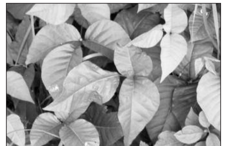
Rytinė nuodingoji gebenė.