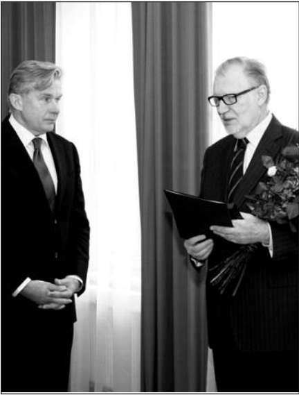
Užsienio reikalų ministras A. Ažubalis (k.) apdovanojo Lietuvos kultūros atašė Rusijoje J. Budraitį.

Vilnius , rugsėjo 20 d. (ELTA) – Užsienio reikalų ministras Audronius Ažubalis medaliu „Už nuopelnus Lietuvos diplomatinėje tarnyboje“ apdovanojo Lietuvos kultūros atašė Rusijoje Juozą Budraitį.