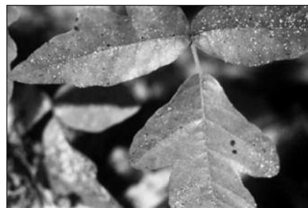
Rytinio JAV pakraščio nuodingo ažuolo lapai.

Nuodingi augalai (nuodingoji gebenė, ažuolas ir žagrenis) yra vieni iš labiau paplitusių augalų rūšių, randamų daugelyje JAV valstijų, išskyrus Alaska ir Hawaii. Šie augalai gali augti miškuose, laukuose, raistuose prie upių, pakelėse ir net miesto ap-