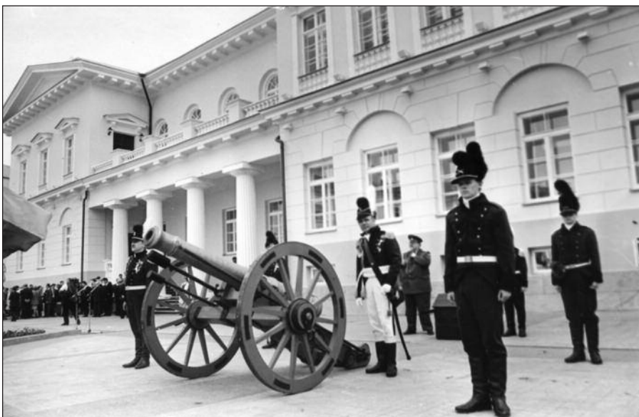
Lietuvos Respublikos Prezidentūra.