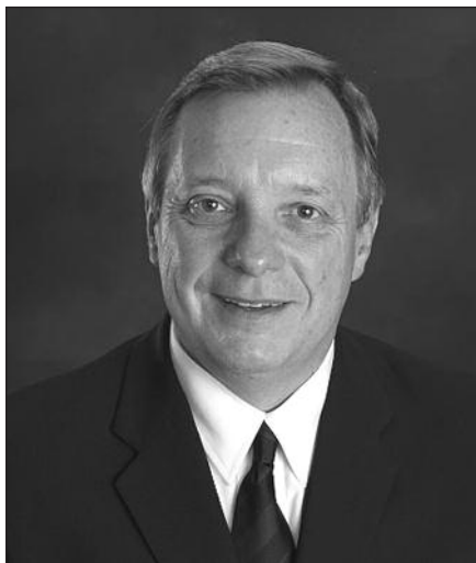
JAV senatorius R. Durbin pagyrė Lietuvą už svarų indėlį į NATO.