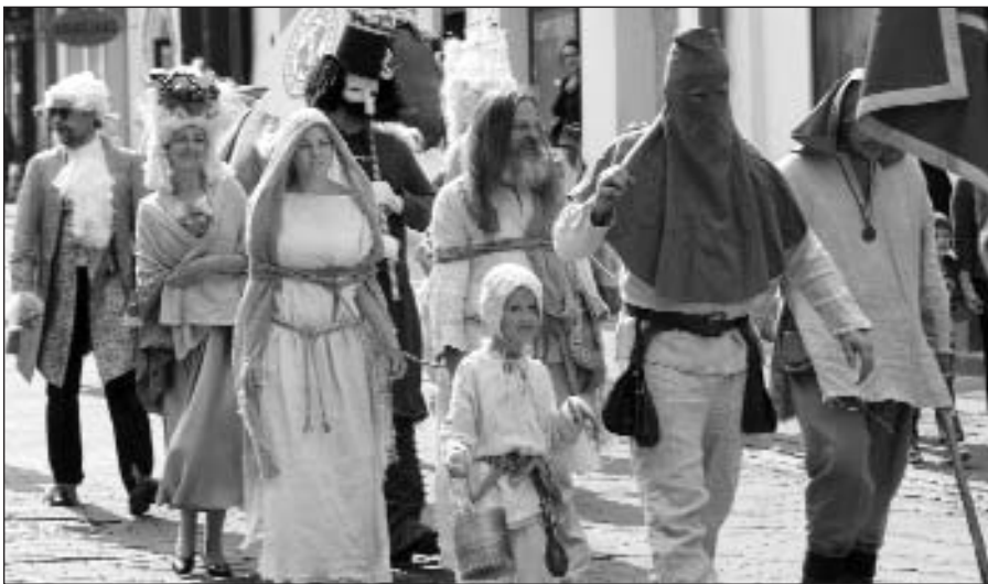
Mugė prasidėjo iškilminga amatininkų eiseną.