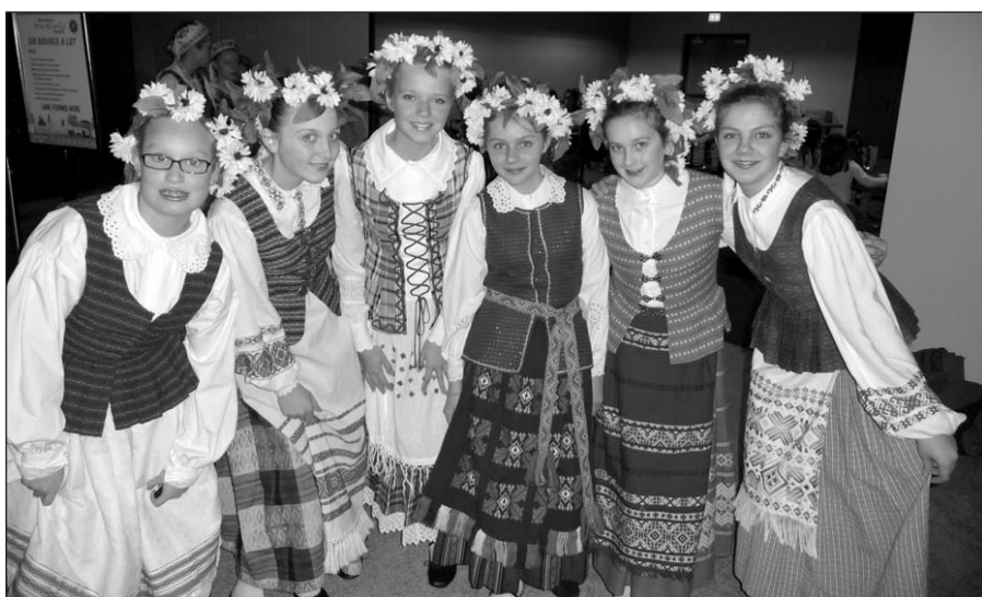
Jaunosios „Grandies“ šokėjos.

Aukštos indėlių palūkanos. 2.25 proc. dvejiems ir 2.50 proc. trejiems metams terminuotas indėlis California Lithuanian Credit Union Santa Monica, California Tel. 310-828-7095 Valdžios apdrauda iki $250,000