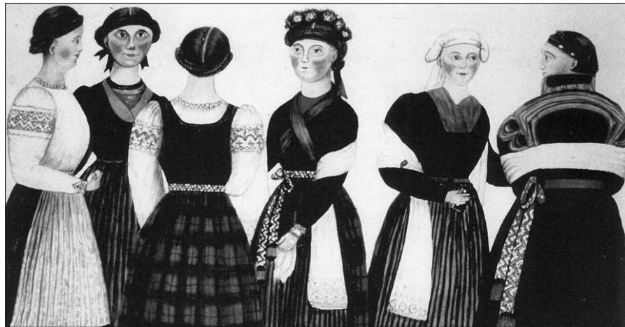
Čiurlionio galerijoje vyks Mažosios Lietuvos istorinio muziejaus Klaipėdoje paruošta fotografijų paroda „Pirmieji lietuviai Teksase“.

Rugsėjo 25 d., šeštadienį: PLC vyks Psichologinės ir dvasinės pagalbos draugijos seminaras. Pradžia 11