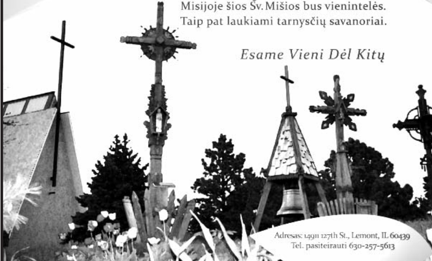
Adresas: 14911 127th St., Lemont, IL 60439 Tel. pasiteirauti 630-257-5613

Rugsėjo 19 d., sekmadienį, 10:30 val. r. Palaimintojo Jurgio Matulaičio misija