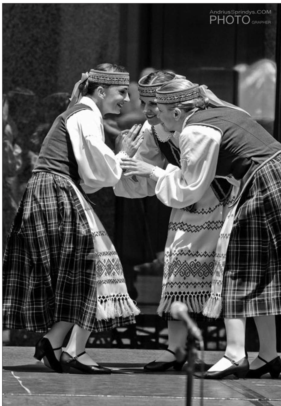
„Lietuvos diena“ Daley aikštėje Čikagoje.