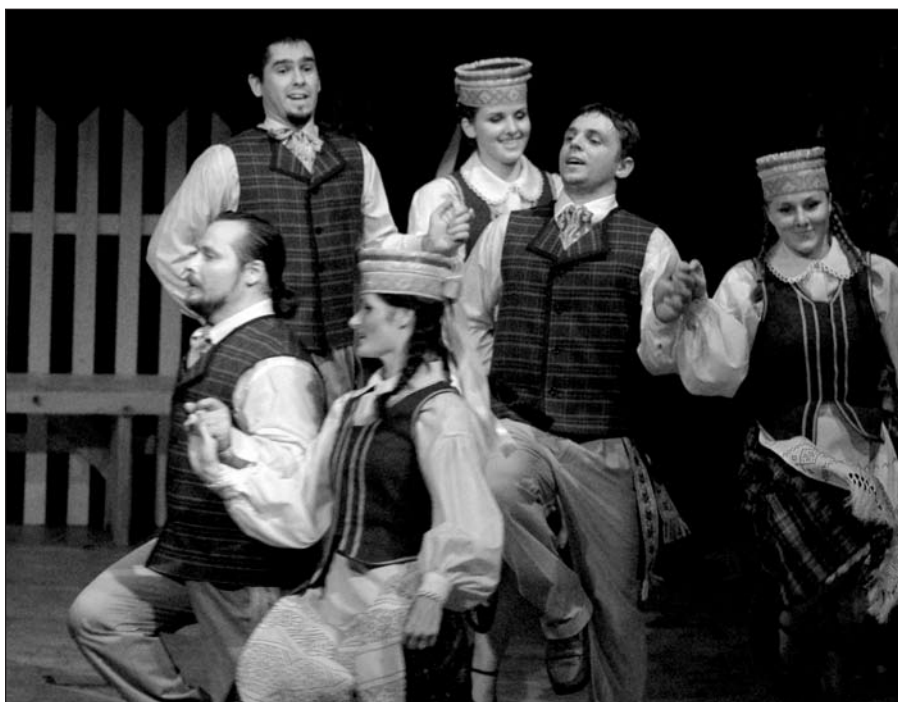
„Suktinio“ koncerto akimirka.

– Visiškai naujai susikūrus ansamblis „Suktinis“ staiga ėmė šokti pačiose matomiausiose miesto vietose – Daley Plaza, Mokslo ir pramonės muziejuje, Navy Pier, tokiose didžiulėse šventėse kaip Pasaulio lietuvių dainų šventėje, Lietuvių tautinių šokių šventėje Los Angeles, koncertavote su „Sodžiumi“, dalyvavote Čikagos lietuvių operos spektakliuose kaip kardebaletas? Kaip tai atsitiko?