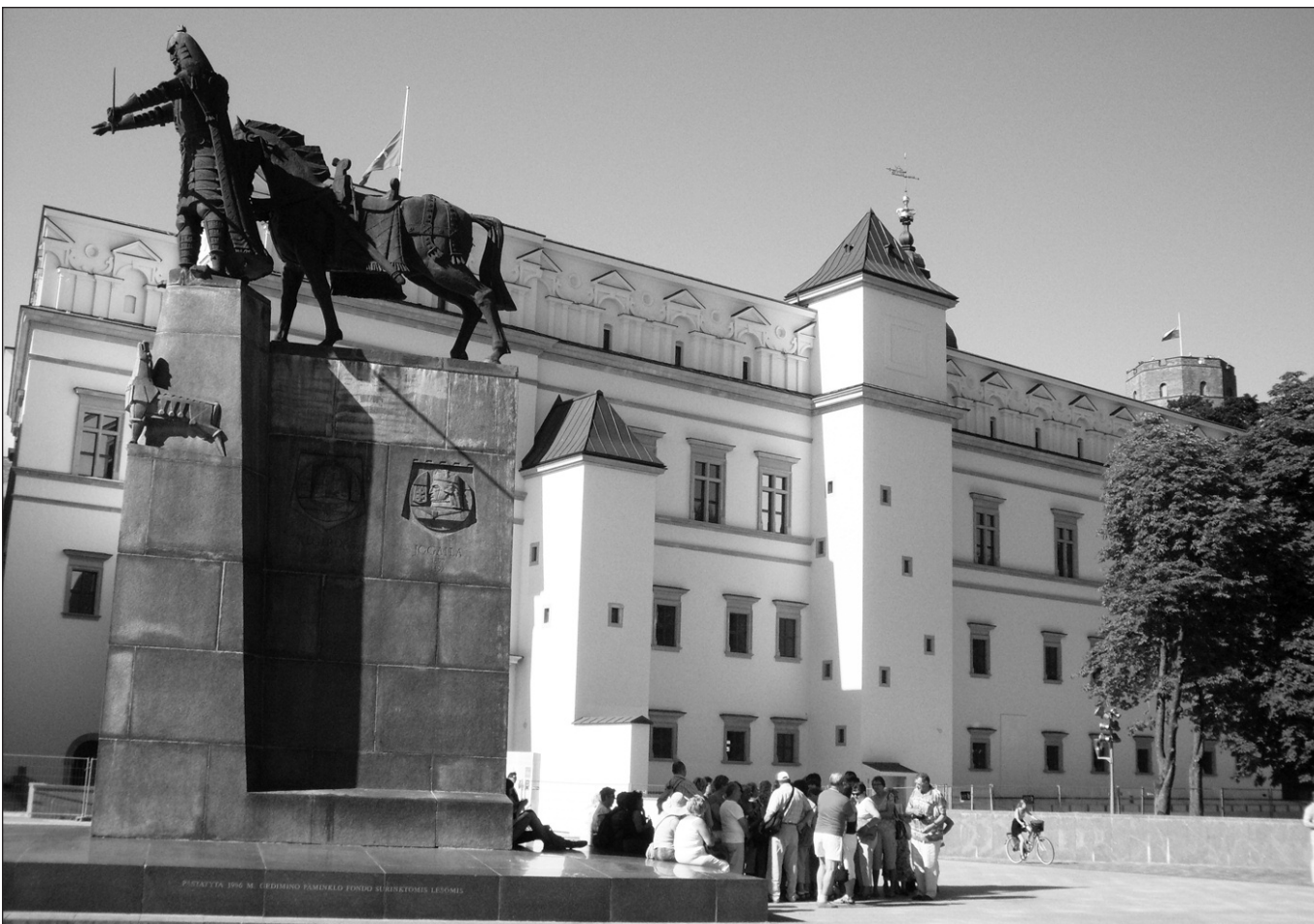
Dar viena sostinės turistų grupė sustojo pasigrožėti Valdovų rūmais.

– Maždaug prieš metus įvyko simbolinis rūmų atidarymas, ir mes buvome pasirengę įvesti būrelius žmonių pasižiūrėti, kaip tie rūmai atkurti, kaip čia viskas atrodo, kur čia tie mūsų pinigėliai įdėti. Kiti projektai ne taip jaudina, bet šitie milijonai yra labai matomi. Čia nieko blogo – žmonės mokosi skaičiuoti. Bet buvo skaudu girdėti – man čia per daug niekas nerūpi, tik parodykite, kur tas mano litas. Stengėmės kuo daugiau papasakoti ir kuo daugiau parodyti to, kas turi rūpėti. Pasakojome apie Neries ir Vilnios santaką, kur pradėjo kurtis mūsų tėvynainiai, norėdami apsiginti nuo priešų... Rodėme pamatus, ant kurių išaugo Vilnius, mūsų sostinė, ir štai ant tų pamatų nors pažinimo tikslais atkuriame savo rūmus. Juk kurį laiką Pilies gatvė vedė į niekur... arba į žalumą. Tiesa, kai kurie žmonės sakė – buvo gražu, dabar kraštovaizdis užsigrūs pastatais! Matyt, pavyko iš daugelio mūsų sąmonės ištrinti tai,