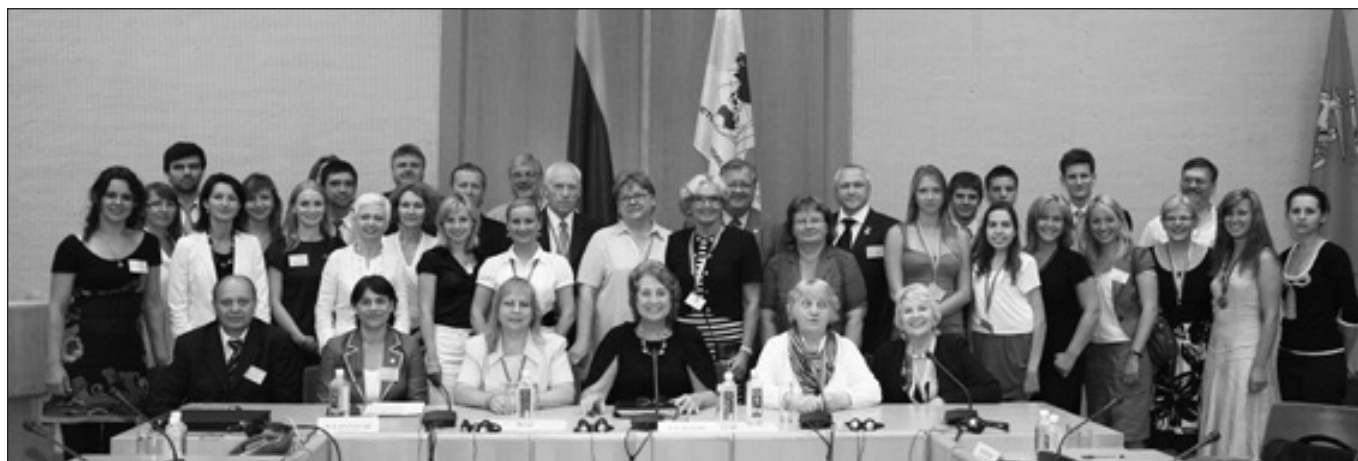
Seimo rūmuose šių savaitę vyko PLB ir PLJS kraštų valdybų pirmininkų suvažiavimas.