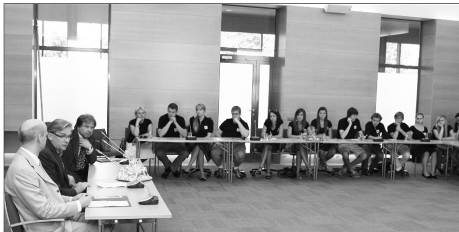
Susitikime Užsienio reikalų ministerijoje.

Kitą dieną buvome pažadinti karštų saulės spindulių – didieji