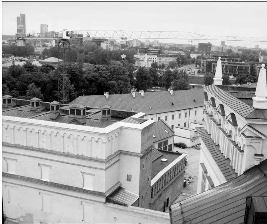
Po Valdovų rūmų stogu bus atkurta kelių epochų kultūra.

– Parodų projektus šiuo metu ruošia kolegos. Bus istorinė-archeologinė paroda, atkurti reprezentaciniai interjerai, butis. Daiktai įgyti dabar, vienas kitas – tokie kaip Lietuvos didžiojo kunigaikščio Žygimanto Augusto gobelenas – sugrižę į savo tikruosius namus. Daiktai – judrioji paveldo dalis, keliauja po pasaulį. Ir mūsų kunigaikščiai vežiojosi buties apyvokos daiktus iš rūmų į rūmus, tas paveldas yra pasklidęs, tapęs kitų muziejų, privačių asmenų nuosavybe ir jo priklausomybė sunkiai atpažįstama. Siekiame interjerus kurti iš tokių vertybių, kurios galėjo ir turėjo būti dvare. Apie 4,000 Lietuvos didžiojo kunigaikščio ir Lenkijos karaliaus Žygimanto Augusto bibliotekos knygų buvo paskirtos Vilniaus universitetui, tada dar kolegijai, bet testamentas neįvykdytas, knygos išsklaidytos po visą pasaulį, Lietuvoje yra tik keliolika egzempliorių. To paveldo susigrąžinimu irgi turime rūpintis. Neatsitiktinai susikūrė Valdovų rūmų paramos fondas, kuris surinko daug lėšų daiktams restauruoti ir įgyti. Tai bus ilgas procesas ir amžinas piliečių rūpestis – kad kuo daugiau vertybių sugrižtų į Lietuvą. Taigi, jeigu kokiame aukcione pasirodytų jo didenybės Žygimanto August-