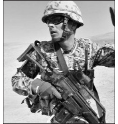
Dokumentai apie kovines operacijas Afganistane buvo paskelbti interneto svetainėje „Wikileaks“.

J. Assange mano, jog kadangi dokumentai yra iš karo praėjusio laikotarpio, jie negali atskleisti dabartinės kariuomenės buvimo vietos ar būsimų karinių operacijų planų.