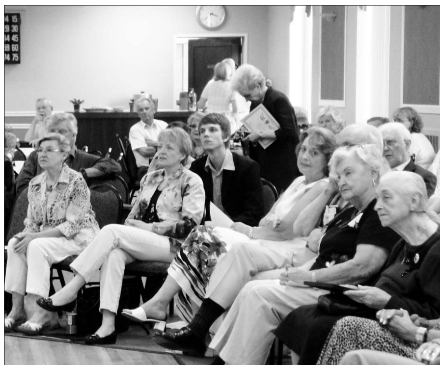
Susirinkusieji išlausė pranešimų apie vykstančią LB veiklą apygardoje.