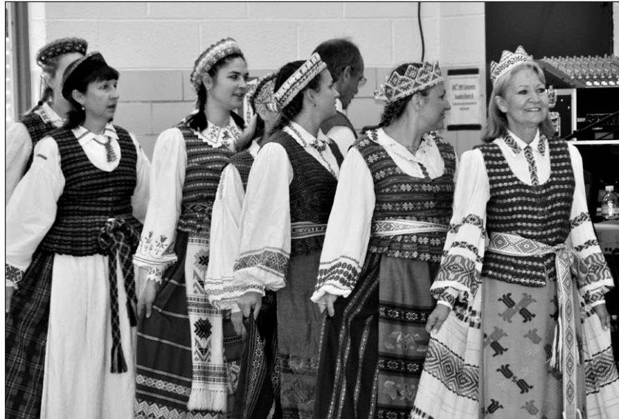
Baltimore lietuvių festivalyje dalis „Malūno“ šokėjų, atstovaujančių visoms trimis išėivijos bangoms.