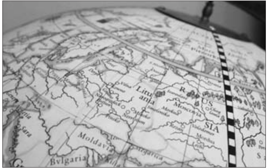
Seimas po svarstymo pritarė patobulintam Pilietybės įstatymo projektui.

Respublikos prezidento sudarytos darbo grupės parengtame įstatymo projekte siūloma išplėsti šį ratą nustatant, kad dvigubą pilietybę gali turėti visi asmenys, ištremti iš okupuotos Lietuvos Respublikos ar iš jos pasitraukę iki 1990 m. kovo 11 d. ir įgiję kitos valstybės pilietybę, t. y. įstatymo projekte numatoma, kad dvigubą pilietybę gali turėti ir LR piliečiai, ir jų palikuonys, pasitraukę iš