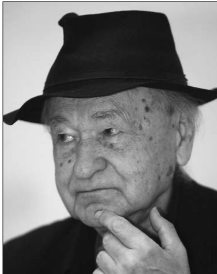
Režisierius Jonas Mekas.

Krokuva , birželio 1 d. (ELTA) – Lietuvių kilmės amerikiečių režisieriui Jonui Mekui už nuopelnus pasauliniam kinui įteikiamas garbingas 50-ojo Krokuvos kino festivalio apdovanojimas – „Slibinų slibinas“. Krokuvoje viešintis laureatas festivalio rengėjų įvardijamas kaip „amerikiečių kino avangardo krikštaitėvis“. Festivalyje pristatomi J. Meko filmai, jo dailės kūrinių paroda, rengiami režisieriaus susitikimai su žiūrovais. Krokuvos kino festivalis – vienas seniausių Europos renginių, skiriamų dokumentiniam, animaciniam ir trumpo metražo kinui. Gegužės 31 d. prasidėjęs festivalis per savaitę aprėps apie 250 filmų iš Lenkijos ir viso pasaulio.