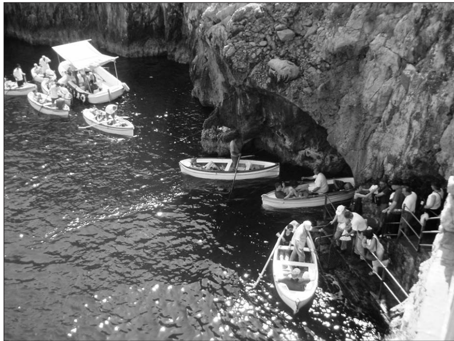
Įplaukiant į Mėlynąjį groto.

Aha, jau priartėjome prie Neapolio, kurio grožį mums Lietuvoje mokytojos lūpos apibūdino – „Pamatyk