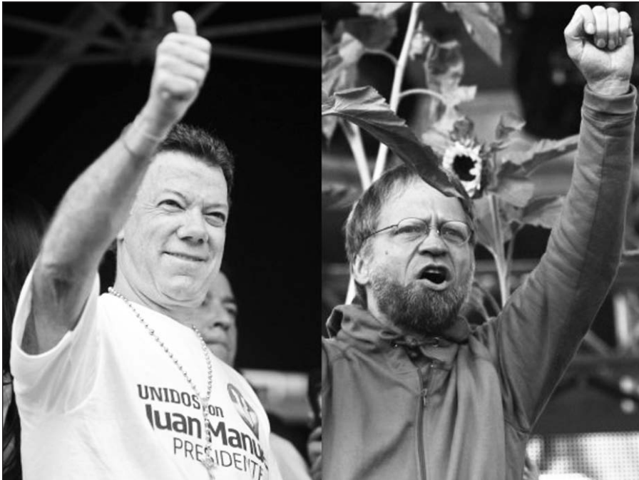
Juan Manuel Santos ir Antanas Mockus.