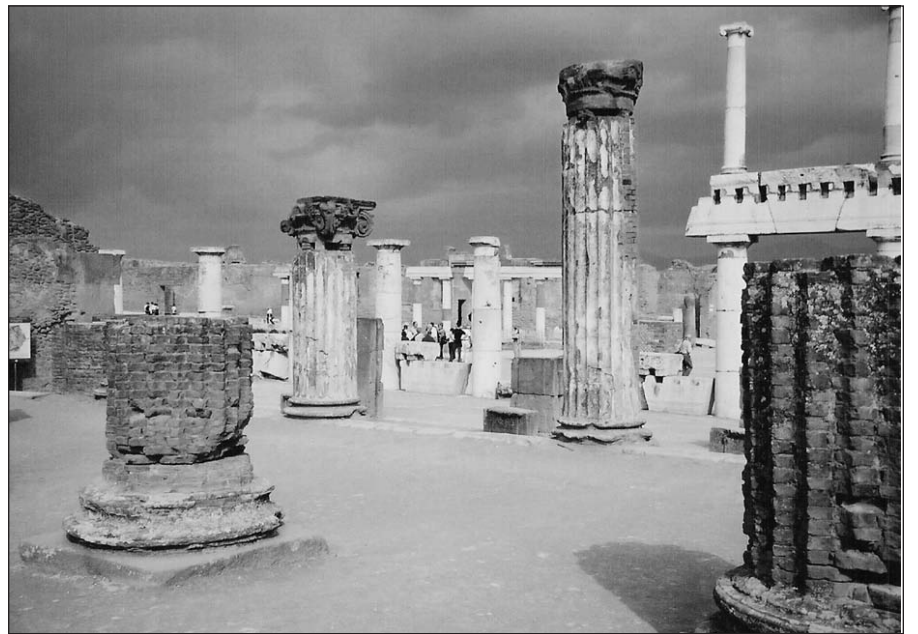
Pompeii pastatų liekanos.

Neapolį ir mirk!“ Nemirėme, o priešingai, pamatėme jį purviną, kišenvagių apsėstą... Netgi sena italė, sėdinti ant savo namų slenksčio, plaštaka tapšnodama šlaunį visa gerkle šaukė mums: „Saugokite savo kišenes!“ O Neapolio grožis, pasirodo,