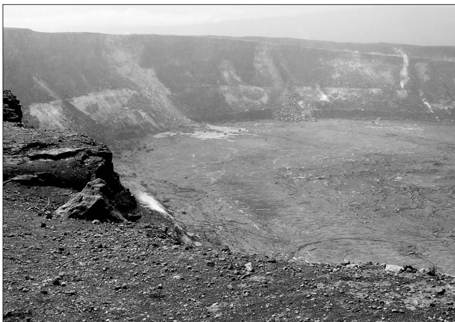
Big Island ugnikalnis.

Išpūdžiui sustiprinti ir visą ugnikalnio grožį turistams parodyti šmaikšti havajietė vadovė surengė išvyką – „pasiplaukiojimą kateriu“. Turistai nesiliovė stebėtis, balsu nesulaikydami savo žavesio „oh, oh, wonderful!“, matydami, kaip įplaukianti į Ramųjį vandenyną ugninė lava verda – kunkuliuodama ir garuodama ji siuntė į padanges didžiulius baltų dūmų kamuolius!