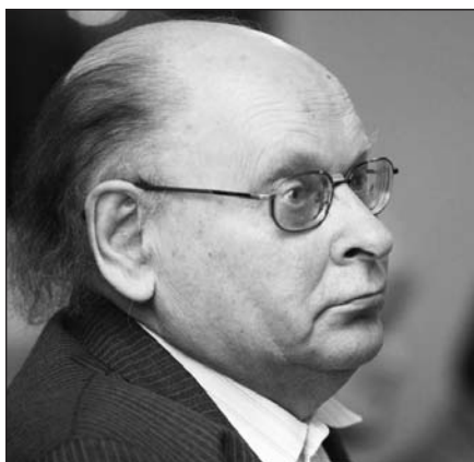
Vilniaus mero premija šiemet paskirta prieš pat šį festivalį mirusiam poetui Jonui Strielkūnui.

Tarp gausybės renginių ir susitikimų Vilniuje vyks tarptautinė poetų ir literatūros kritikų konferencija „Istorijos projekcijos poezijoje“, Vlado Braziūno fotografijų paroda „Poezijos pavasarių akimirkos“, ciklas susitikimų su poetais, Nacionalinių premijų laureatais, Pauliaus