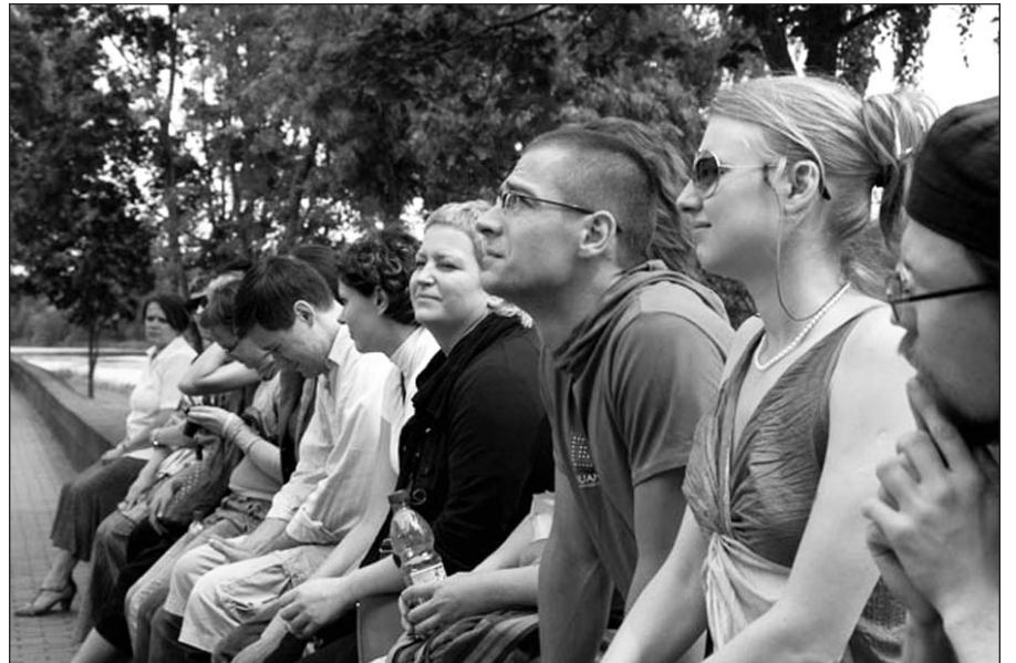
„Migruojantys paukščiai“ 2008 m.