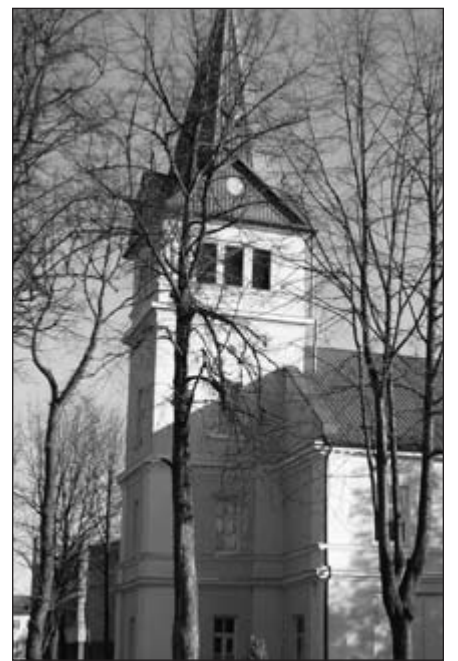
Evangelikų bažnyčia Mažeikiuose.

„Neskubėjau, reikėjo rimtai rinktis ir žiūrėti, kaip susitvarko naujasis prokuroras“, – atidariusi Baltijos jūros regiono jaunimo renginį „B-Young“ sakė prezidentė. D.