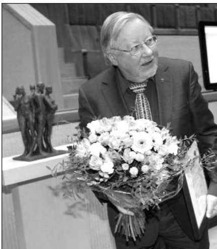
Prof. Vytautas Landsbergis.