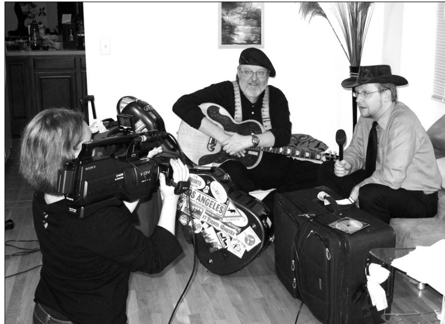
Tik atskridęs, pokalbuosi su „America LTV“, New York.

Atramos tašku tapo ŠALFASS metinis suvažiavimas Klyvlende (Cleveland). Apie šią šerđį ir buvo auginamas visas koncertinės kelionės kūnas. Klyvlendiškių pasiuntiniai pasirodė Lietuvoje 2009-tų liepą. Pakviečiau juos stebėti IX bardų festivalį „Akacijų alėja“, kur jie dar kartą patvirtino savo ketinimą mane kviesiti rimtumą (Deja, savo biografijoje turiu ir liūdny pavyzdžių, kai dėl organizatorių nors ir gerų norų, bet