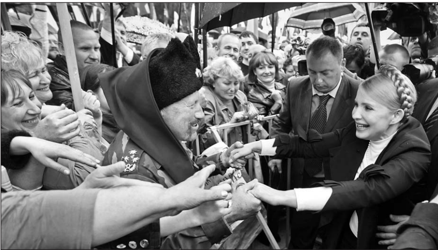
Opozicijos šalininkus į demonstraciją sukvietė buvusi ministrė pirmininkė J. Tymošenko, metų pradžioje pralaimėjusi prezidento rinkimus.