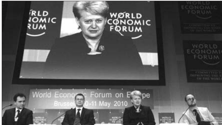
Prezidentė D. Grybauskaitė – Pasaulio ekonomikos forume Briuselyje.