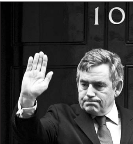
Britanijos premjeras G. Brown paskelbė vėliausiai rudenį pasitraukiantis iš Leiboristų partijos vadovo pareigų.

premjeras Gordon Brown pergudravo savo oponentus, paskelbdamas apie sprendimą atsistatydinti, tačiau nemaža dalis jo vadovaujamos Leiboristų partijos narių šį žingsnį laiko pavėluotu. Šis jo pareiškimas atvėrė kelią leiboristų deryboms dėl valdžios pasidalijimo su Liberalų demokratų partija.