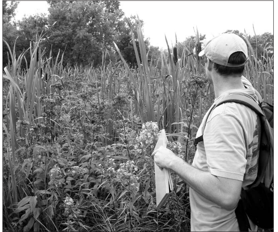
Michigan valstijos biologai Dainavos šiaurinėje dalyje esančioje pelkėje apžiūri augančius eupatorium fistulosum (hollow-stemmed Joe-pye weed).

Dainavos apylinkėje, kur žemė lygi, laukai buvo ariami ir apsodinama. Per trumpą laiką išnyko visos ankstesnio amžiaus natūralios gamtos sėklos. Dainavos žemė nebuvo ariama, nes ji labai kalvota, nelygi. Čia daugiausia gamtai žalos padarė galvijų ganymas. Tiesa, ganymo žala yra švelnesnė negu laukų arimas.