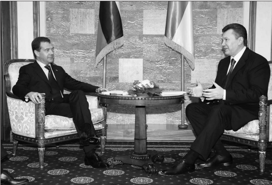
Po Rusijos ir Ukrainos prezidentų susitikimo pasirašytas rusiškų dujų tiekimo Ukrainai sutarties papildymas.

Maskva , balandžio 21 d. (BNS) – Rusija ir Ukraina turėtų stiprinti dvišalius santykius, pareiškė Rusijos prezidentas Dmitrij Medvedev per susitikimą su Ukrainos prezidentu Viktor Janukovič Charkov mieste.