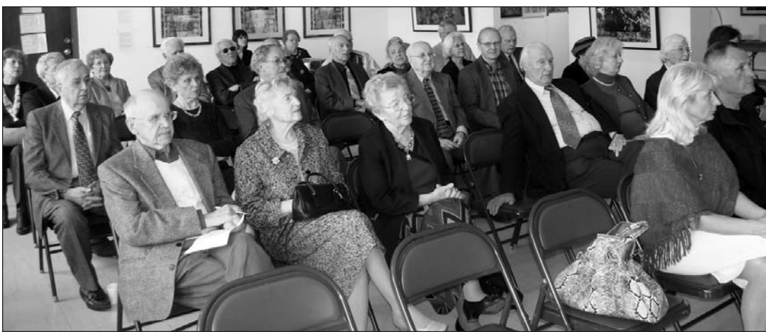
JC narių ir rėmėjų metinio susirinkimo dalyviai.