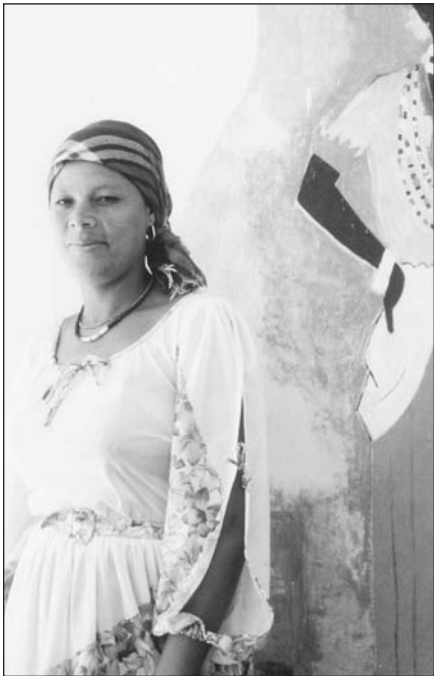
Viena iš viešbučio tarnaičių-kambarinė.

Tarp daugelio atsimenu dar kelis tipus. Vienas iš Atlanta vyrukas,