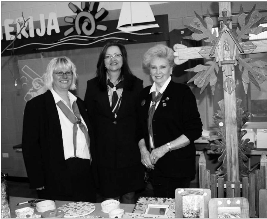
Skautės džiaugėsi, kad šiemet Kaziuko mugę pasisekė.

Džiaukimės, kad tas siūlas, jungiantis mus su sena skautiška šeima, nenutrūksta.