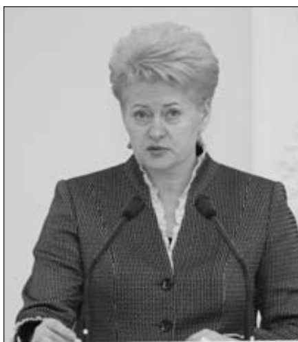
Pasak valstybės vadovės, Lietuvai taip pat svarbi skurdo problema.

Briuselis, kovo 25 d. (ELTA) – Labai svarbu pašalinti kliūtis ekonomikos augimui, kurių viena svarbiausių – energetikos rinkos susiskaldymas Europos Sąjungoje (ES), pabrėžė prezidentės Dalia Grybauskaitė, Briuselyje susitikusi su Baltijos ir Šiaurės (NB6) valstybių ir vyriausybės vadovais.