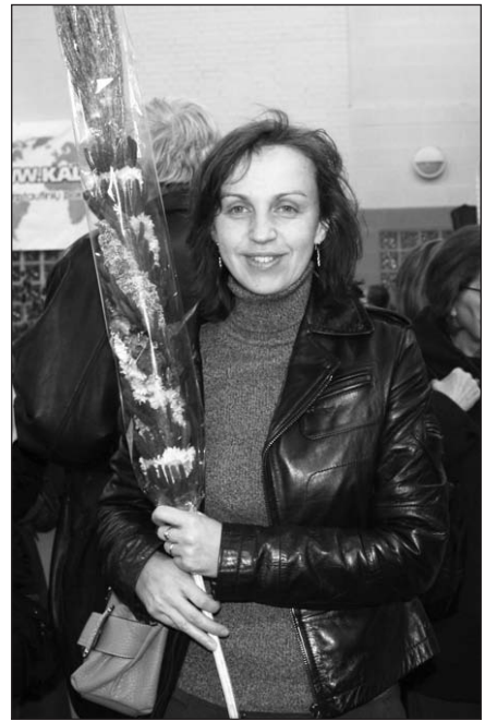
Kokia Kaziuko mugė be verbų?

Skautišką šurmulį galėjai jausti kiekviename PLC kampelyje. Pilna energijos skautininkė kaip kelrodis mosikavo ryškiomis rodyklėmis ir skelbė visiems, kur, kokioje pusėje vyksta koks renginys. Šiltai jai norėjau palinkėti skautiškai „Gero vėjo“. Koridoriuje skautai prekiaavo dešrelėmis, įvairiais namų gamybos cukrainiais. Nustebau, kad salė buvo užpildyta prekiautojų ir lankytojų gausa. Ir tikrai, ko tik čia nebuvo! Kažkada buvo manyje išsiskverbusi gailėsčio gaidelė, atrodė, jog su mano sūnumis užsibaigia ir skautiškas jaunimas, matėsi jų sumažėjęs skaičius, jautėsi skautų vadovų trūkumas. Šiandien to nepastebėjau, atvirksčiai, net pajutau didelį šuolį į priekį. Verta dėl to džiaugtis ir dėkoti Dievui, kad skautai vis dar veiks – jie gyvavo ir dar