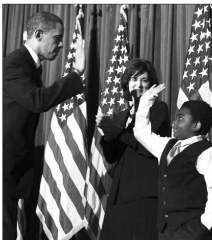
Pernai 19,1 proc. juodaodžių neturėjo sveikatos draudimo.

Washington, DC , kovo 25 d. (Irytas) – Juodaodžių padėtis Jungtinėse Valstijose pirmaisiais prezidento Barack Obama valdymo metais nepagerėjo. Recesija šiai gyventojų grupei pernai smogė labiau nei baltiesiems, teigiama Washington paskelbtoje piliečių teisių organizacijos „Na-