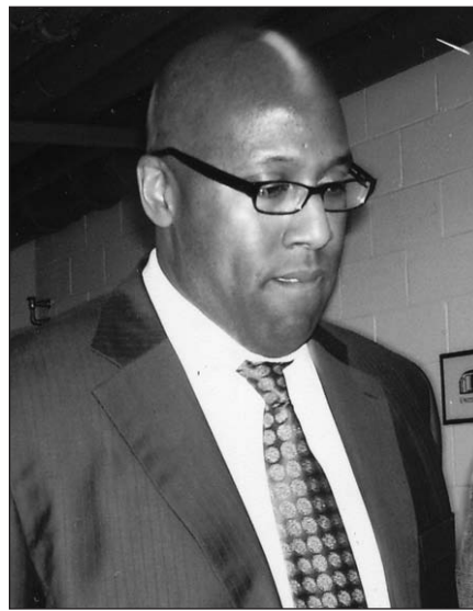
„Cleveland Cavaliers” treneris Mike Brown.

„Chicago Bulls” varžybų metu būdavo įdomu pasikalbėti su buvusiu komandos treneriu, radijo komentatoriumi Johnny Red Kerr bei žymiu