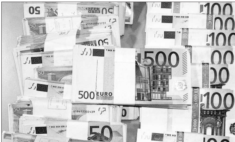
Raginama tęsti euro zonos plėtrą.