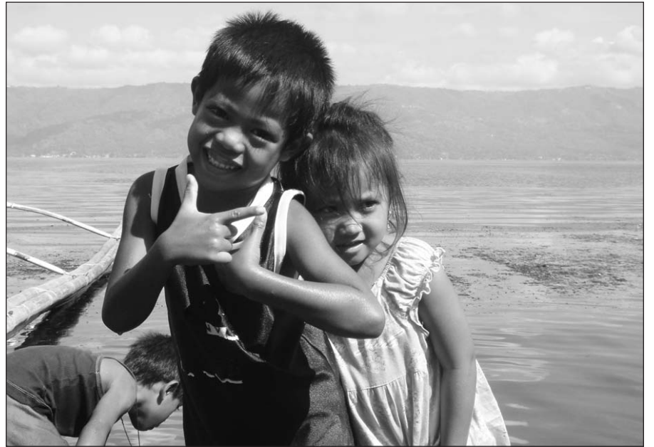
Vaikai ir suaugusieji mums šypsojosi, mojo rankomis.

Ir nors esu šioje šalyje svetimšalė, sutikę ir priėmę į savo gyvenimus žmonės mokino mane, kaip savą, kaip vieną iš jų. Neįkainojamas pamokas man dovanojo neturtingi Fi-