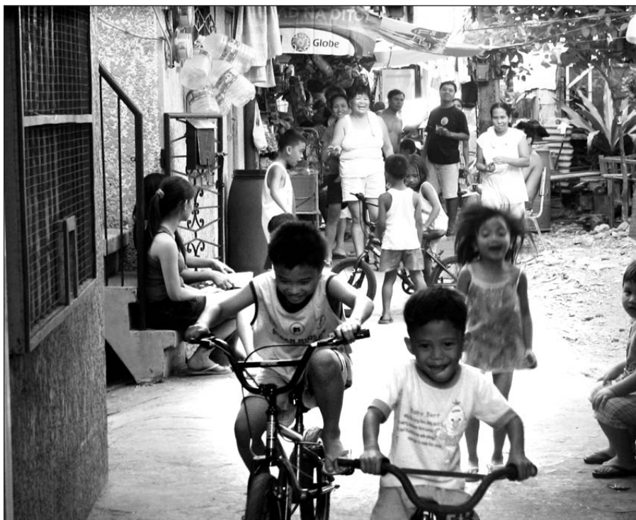
Turbūt niekada nemokėčiau taip nuoširdžiai, iš pat širdies gelmių šypsotis, kai nežinočiau, ar pietums galėsiu suvalgyti vieną ar dvi saujas ryžių.