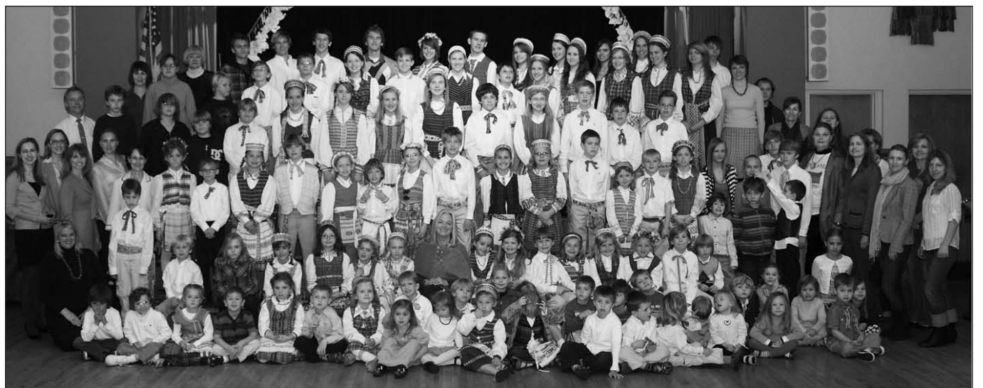
Los Angeles lituanistinės mokyklos mokiniai ir mokytojai.