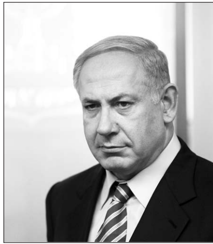
Izraelio ministro pirmininko B. Netanyahu susitikimas su JAV prezidentu vyko už uždarytų durų ir jokių jo detalių nepateikiama.

Jungtinės Valstijos išpėjo, kad naujų namų žydų naujakuriams statybos aneksuotoje Rytų Jeruzalėje tiesiogiai pakerta Amerikos, kaip tai-