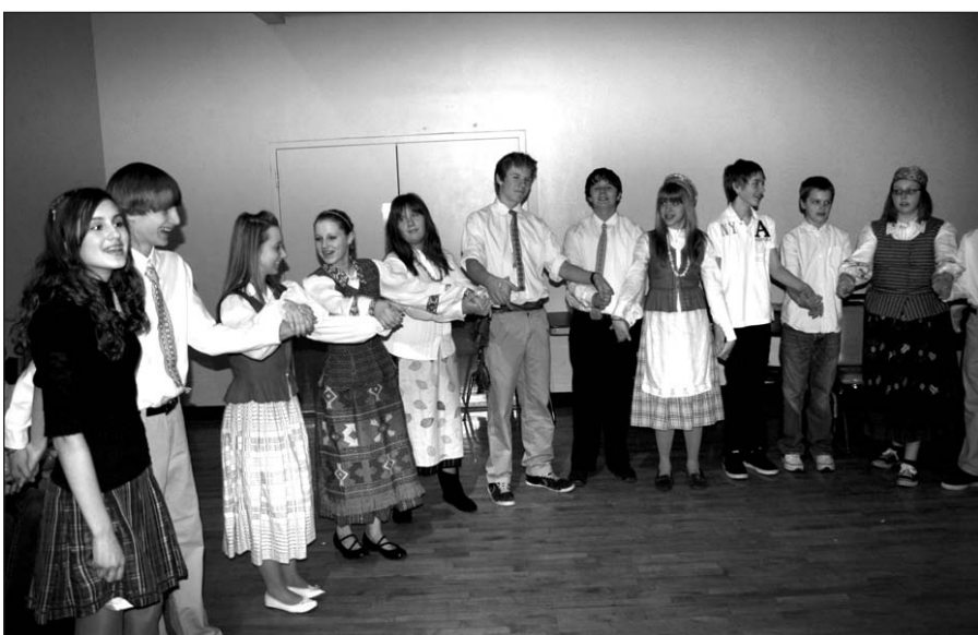
Aštuntokai visus nustebino smagiu šokiu.