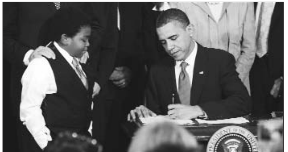
JAV prezidentui pasirašius sveikatos pertvarkos įstatymą, jis įsigaliojo.

Savo kalboje prezidentas užsiminė apie ilgą kovą, kurios prirėkė, kad