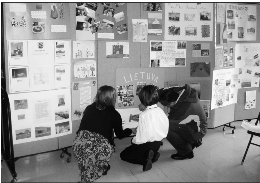
Ruošiama parodėlė „Ką man reiškia Lietuva?“.