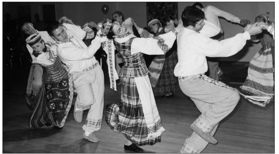
„Spindulys“ Lemont, IL.