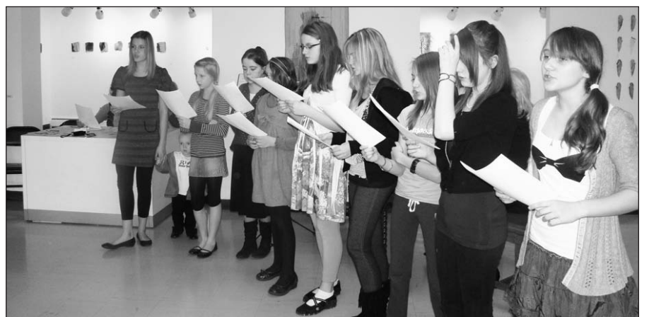
Popietė baigėsi bendra daina.

Na, balandžio 10 d. kviečiame visus atvykti į Lietuviško žodžio šventę, kurioje minėsime Martyno Mažvydo gimimo 500-ąsias metines ir apdovanosime mokyklos skaitymo ir rašymo konkursų nugalėtojus. Tad lauksime jūsų Čikagos lituanistinėje mokykloje.