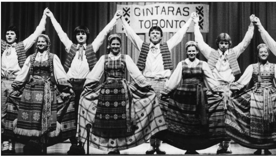
„Gintaras“ Toronto, Kanada.