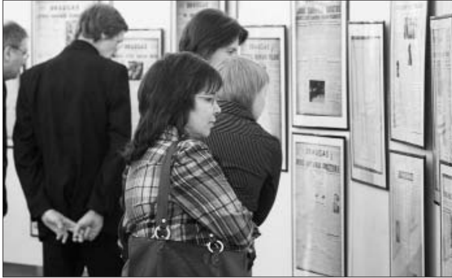
Seimo parodų galerijoje atidaryta „Draugo“ paroda.

Vilnius, kovo 18 d. (Lietuviams.com) – Kovo 18 dieną Seimo parodų galerijoje atidaryta pasaulio lietuvių dienraščio „Draugas“ 100-osioms išleidimo metinėms paminėti skirta paroda. Parodoje sveikinimo žodį tarė Seimo pirmininkė Irena Degutienė. 2009 m. liepos 12 d. šimtmetį pa-