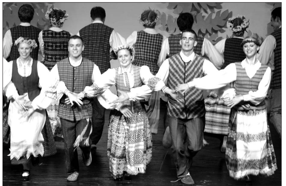
„Grandis“, Lemont, IL.