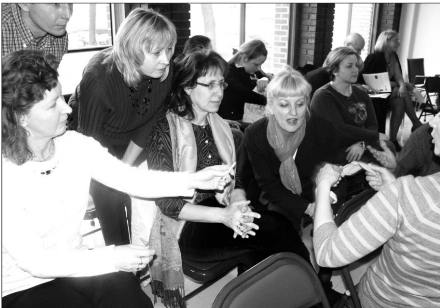
Tėvelių komanda ruošiasi atsakyti į viktorinos klausimą.