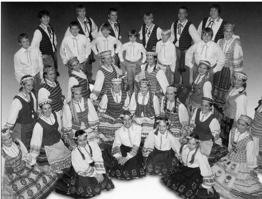
„Švyturys“ Cleveland, OH.