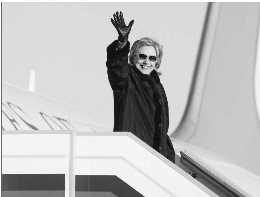
Hillary Clinton atvyko į Rusiją.