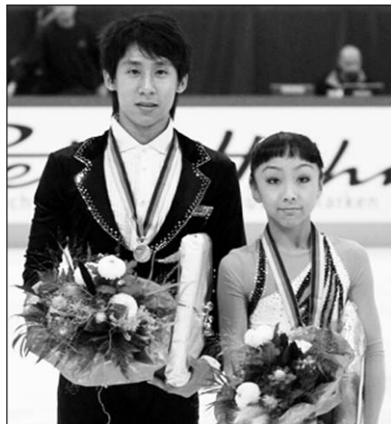
Wenjing Sui ir Cong Han.

Šokių ant ledo aukso medalius laimėjo rusai Elena Ilinykh ir Nikita Katsalapov. Sidabro medalius laimėjo kanadiečiai Alexandra Paul ir Mitchell Islam, o bronzos – kita Rusijos pora Ksenia Monko ir Kirill Khaliavin.