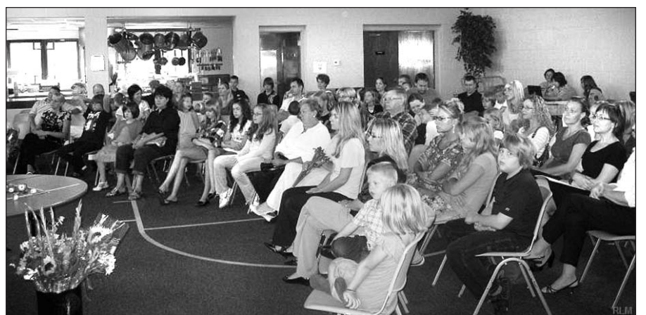
Mokslo metų atidarymas „Rasos“ lituanistinėje mokykloje.