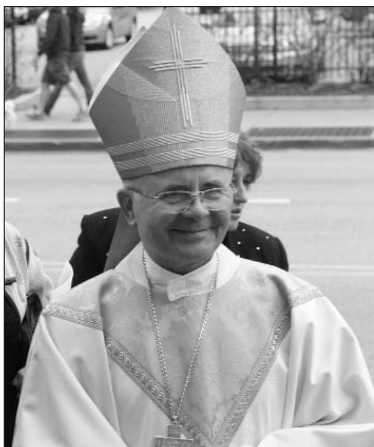
Arkivyskupas Sigitas Tamkevičius.