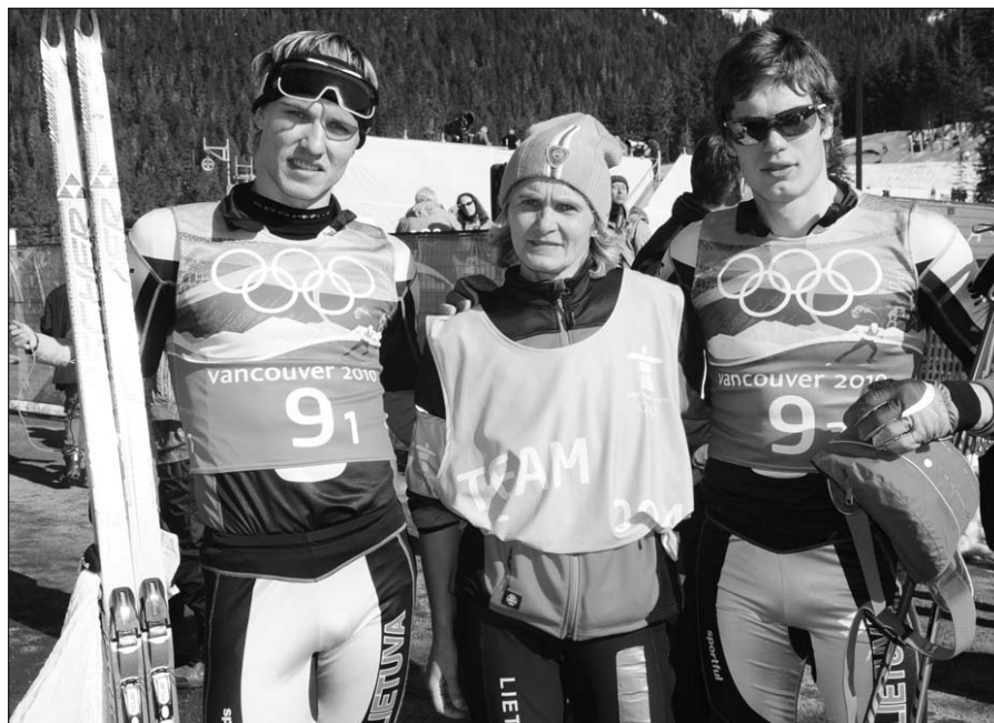
Lietuvos slidininkai Vancouver olimpiadų žaidinių komandų sprinto varžybose buvo aštuoniolikti.

Nuostabu, kad toks mažas kraštas kaip Latvija sugeba dalyvauti olimpiadoje tarp garsių ledo ritulio komandų, sudarytų iš Šiaurės Amerikoje veikiančių Nukelta į 8 psl.