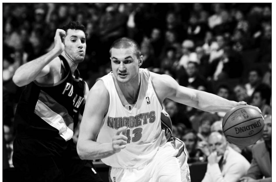
Priekyje su kamuoliu – Linas Kleiza.

Lino Kleizos atstovaujama Pirėjo „Olympiakos“ komanda Graikijoje šalies taurės baigiamosiose rungtynėse rezultatu 68:64 nugalėjo Atėnų „Panathinaikos“, kuriame žaidžia Šarūnas Jasikevičius.