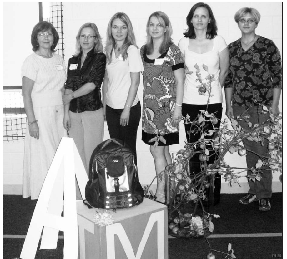
„Rasos“ lituanistinės mokyklos mokytojos.

Dar kartą prisimindami ir minėdami mūsų Valstybės šventę, visam