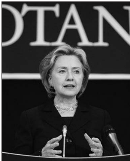
JAV valstybės sekretorė Hillary Clinton.

Washington, DC, vasario 23 d. (AFP/BNS) – JAV valstybės sekretorė Hillary Clinton pakvietė Rusiją nepaisant nuomonių skirtumų glaudžiau bendradarbiauti su NATO, pabrėžusi, kad Šiaurės Atlanto organizacija nekelia jokios grėsmės Maskvai.