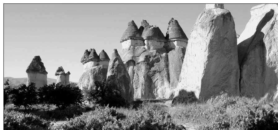
Labiausiai užklydėlius čia stebina neįprasti uolienų masyvai, dar vadinami „pasakiškais kaminais“.

Madeirą vagoja net 1,600 kilometrų besitęsiantys drėkinamieji kanalai, portugaliskai vadinami „levadomis“, kurių kraštuose yra įtaisyti siauri vaikščiojimo takeliai. Šie akvedukai buvo iškirsti stačiose uolose. Kai kurie iš jų – iš tiesų atrodo it pakibę ant bedugnės krašto.