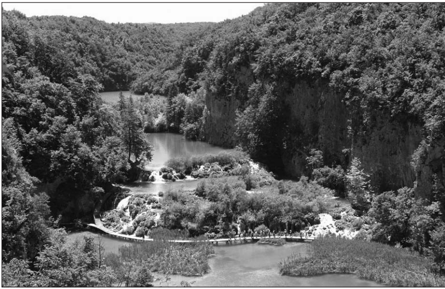
Turistus Plitvicų parke labiausiai traukia vaizdingas lentomis nuklotų takų tinklas.