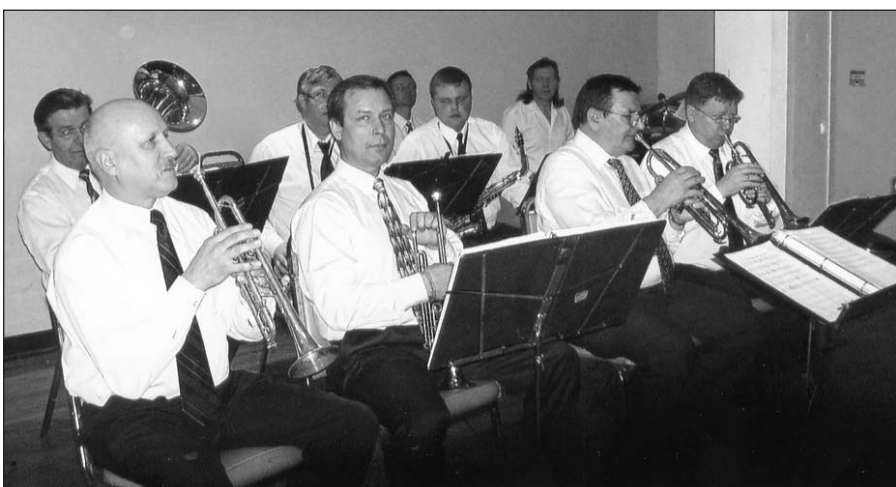
Susirinkusius pasitiko dūdų orkestras „Gintaras“.