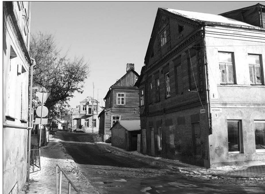
Kai kurios Ukmergės gatvės nepasikeitė iki šiol.