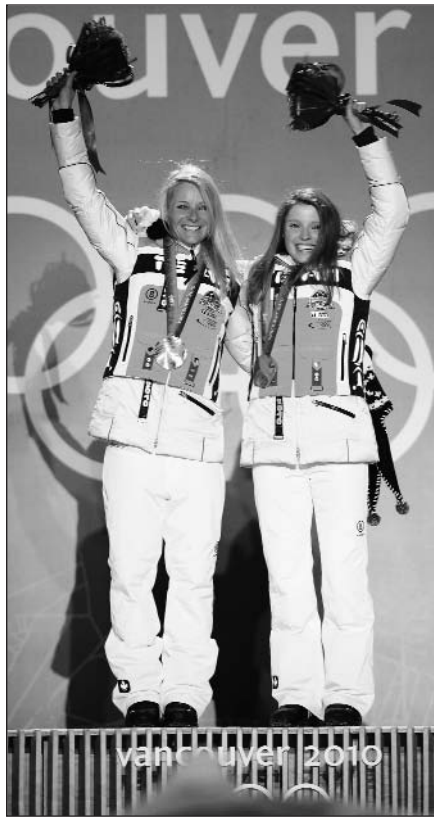
Olimpinių žaidynių auksą iškovojo Vokietijos slidininkės.

* Po dešimtosios Vancouver žiemos olimpinių žaidynių varžybų dienos medalių lentelėje į pirmą vietą pakilo Vokietijos rinktinė. Jos sportininkai iškovojo 7 auksą, 9 sidabrą ir 5 bronzos medalius. Į antrą vietą nukrito JAV sportininkai, turintys 7 auksą, 8 sidabrą ir 10 bronzos apdovanojimų. Trečią vietą užima 6 auksą, 3 sidabrą ir 5 bronzos medalius iškovoję Norvegijos atstovai. Per 10 varžybų dienų išdalyti 54 medalių rinkiniai iš 86. Medalius iškovojo 26 šalių sportininkai.