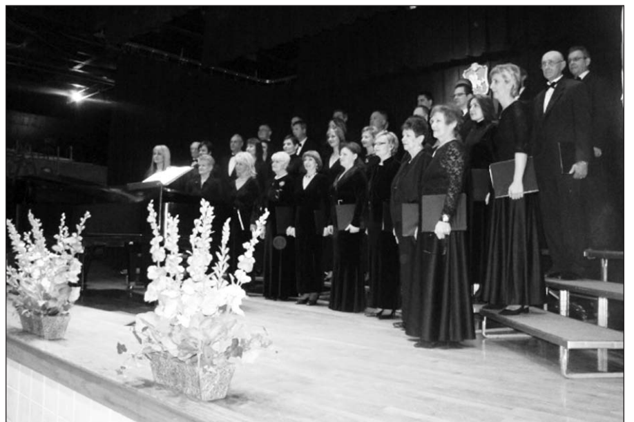
Meninę programą atliko Lietuvių operos choras.