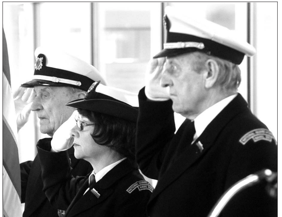
Jūrų šauliai atiduoda pagarbą vėliavai.