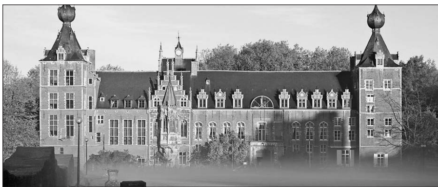
Leuven universitetas, Belgija.