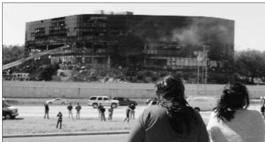
Pastate, į kurį įsirėžė lėktuvas, dirbo beveik 200 žmonių.