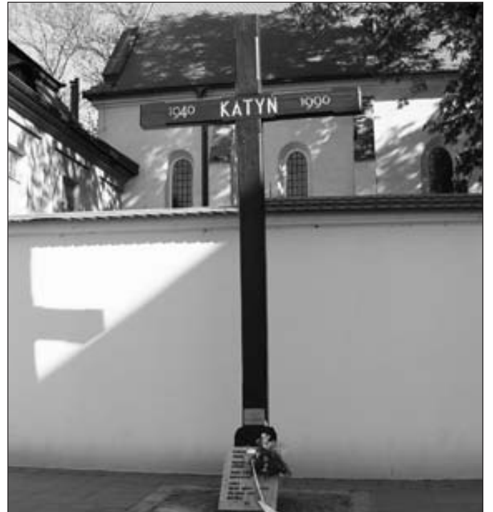
Paminklas aukoms Krokuvoje.

Per 1940 metais vykusias Katynės žudynes NGVD nužudė per 20,000 Lenkijos karininkų. Varšuva reikalauja, kad šios žudynės būtų prilygintos genocidui.