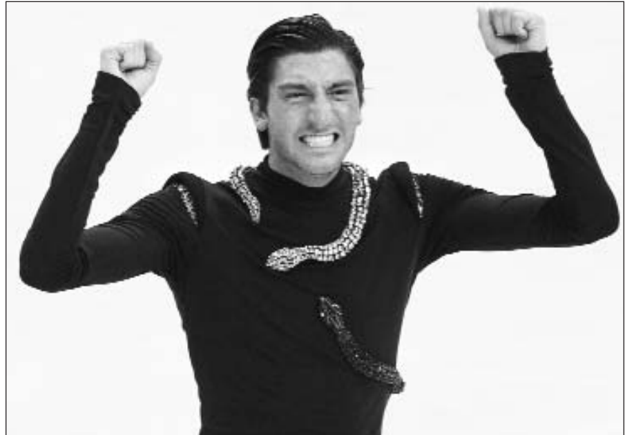
JAV čiuožėjas Evan Lysacek iškovojo olimpinį aukso medalį.