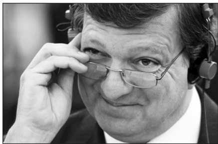
EK pirmininkas Jose Manuel Barroso pritarė prezidento Dmitrij Medvedev straipsniui „Rusija, pirmyn“.

Vilnius, vasario 11 d. (Delfi.lt) – Europos Sąjungos specialistai perdavė Rusijos valdžios atstovams programos „Partnerystė modernizacijai“ projektą, praneša lenta.ru. Europos Komisijos (EK) atstovų nuomone, Rusija pirmiausiai turi užtikrinti savo teritorijoje teisės viršenybę, o paskui palapsniui pritaikyti ekonomiką Europos reikalavimams.