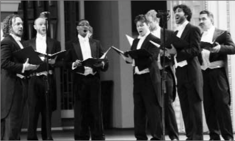
Filharmonijoje koncertavo garsus vyrų vokalinis ansamblis iš San Francisco.