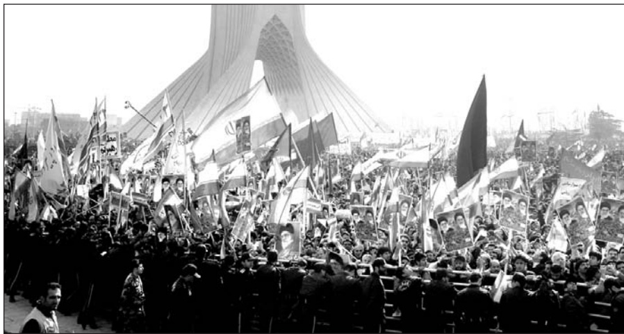
Teherane vykusioje manifestacijoje dalyvavo daugiau kaip 5 milijonai žmonių.