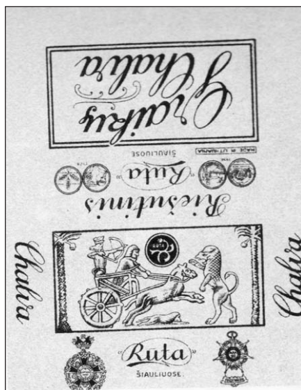
„Rutos“ saldainio popierėlis.

Jei meilės deivės Mildos diena nelemta nurungti Valentino šventę tarp Amerikos lietuvių, gal nors pakęskime savas valentiniškas tradicijas – vietoj amerikietiško šokolado dovanokime lietuviškus saldinius? Juk daugelyje JAV didmiesčių lengvai galima įsigyti iš Lietuvos atvežto šokolado! Pagaliau, jo galima užsisakyti ir internetu. O ar žinote, kad iš Lietuvos atvežti saldainiai turi beveik 85 metų pardavimo tradicijas Dėdės Semo pakrantėje?!