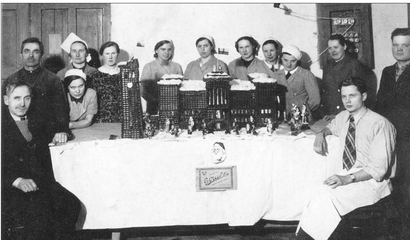
Šiaulių „Birutės” fabriko darbininkai prie Vytauto Didžiojo muziejaus šokoladinio modelio, pagaminto papuošti Vaitkaus parduotuvės vitrinai Kalėdų proga, 1938 m.

Tariu širdinga ačiu už man prišųstą siuntinį su lietuviškais saldainiais, salami ir palengvica. Turėjau progos persitikrinti ant kiek geras lietuviškas proviantas, – tai yra maistas. Turėdamas repeticijas savo koncerto, sueidavo daug amerikonų pasiklausyti dainavimo mano, o aš prie progos pavaišinau tuo ponus „Birutės” saldainiais ir teipgi su lietuviškomis dešromis. O kaip jiems patiko. Kaip jie gyrė Lietuvos produktus. Jus nusistebėtumet tą išgirdę. Žodžiu sakant, jiems taip patiko, kad jie man beveik viską suvalgė, bet aš nesigailėjau, ir vis prašiau valgyti daugiau. Taip ir padarė. Suvalgė viską. Nukelta į 9 psl.