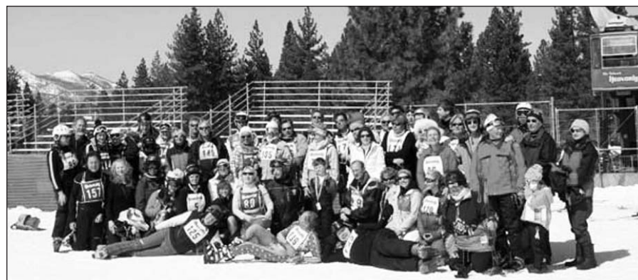
2009 m. lietuvių slidinėjimo varžybų dalyviai Lake Tahoe, NV.