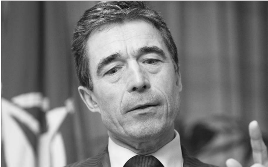
NATO generalinis sekretorius Anders Fogh Rasmussen.