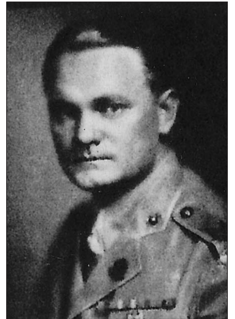
Faustin E. Wirkus.

Apie savo karaliavimą ir kitus nuotykius Haiti su pertraukomis nuo 1915 iki 1929 metų Wirkus yra plačiai aprašęs savo knygoje „The White