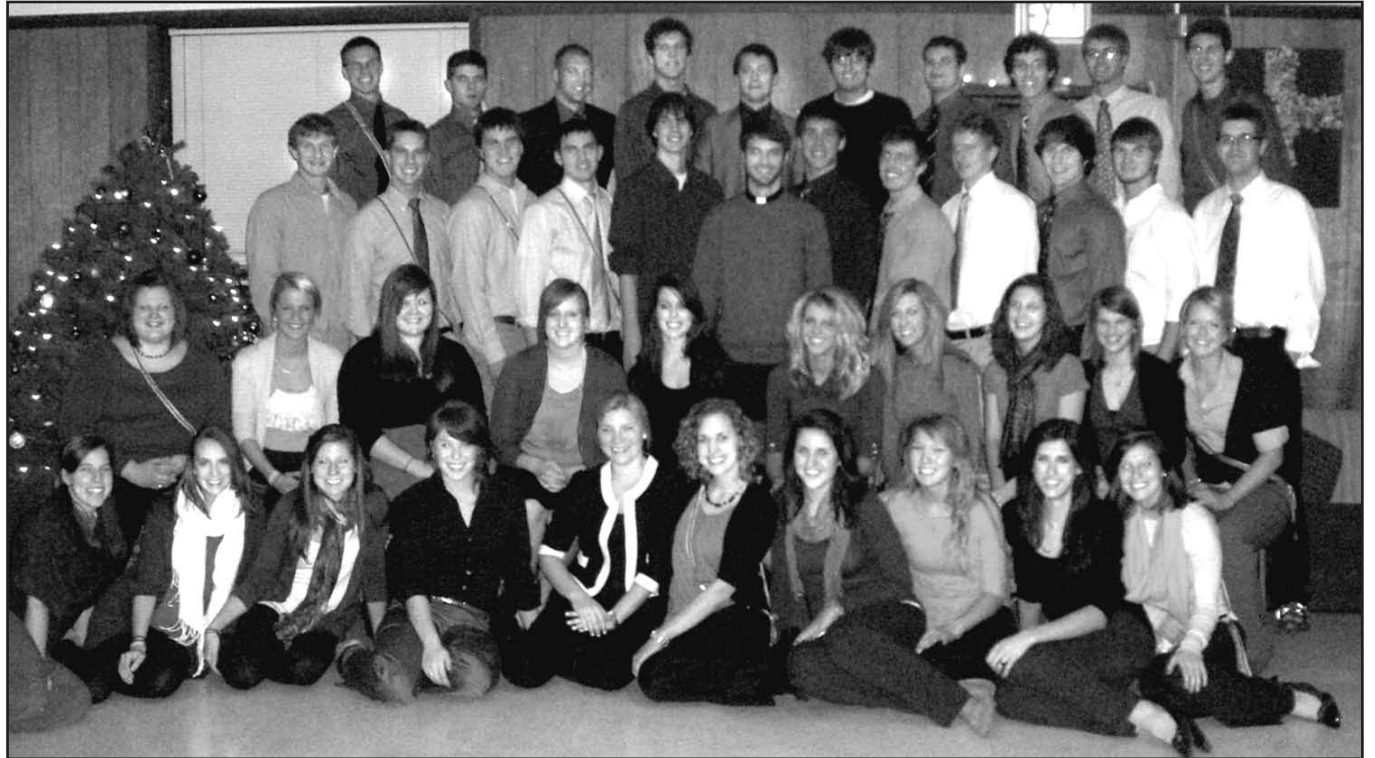
Studentų ateitininkų savaitgalio dalyviai Dainavoje, 2010 m. sausio 1–3 d.

Red. Vida Kuprytė c/o Draugas 4545 W 63 St. Chicago, IL 60629 el. paštas: draugas@ateitis.org