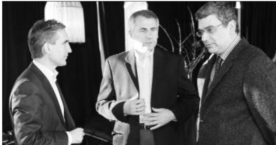
Moldovos, Lietuvos ir Rumunijos užsienio reikalų ministrai (iš kairės): Jurij Leanca, Vygaudas Ušackas ir Teodor Baconschi.

Vilnius , sausio 15 d. (ELTA) – Nepaisant prezidento rinkimų Ukrainoje rezultato, Europos Sąjunga (ES) turėtų pasiūlyti Ukrainai pagalbą, tai yra aktyvesnį dalyvavimą kuriant savo ekonominę, socialinę politiką. Prie tokios nuostatos, pasak Lietuvos užsienio reikalų ministro Vygaudo Ušacko, priėjo Trakuose ne-