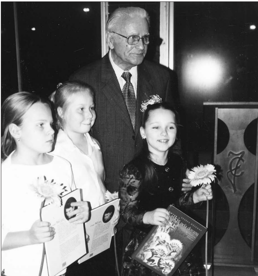
Rašytojas Stasys Dziugas su jo kūrybos deklamuotojomis JAV lietuvių rašytojų draugijos Premijų įteikimo šventėje 2004 m. lapkričio 4 d.