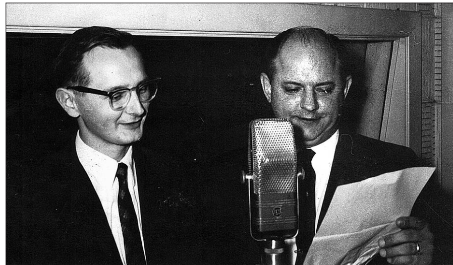
Grand Rapids lietuviškos radijo programos vedėjai.