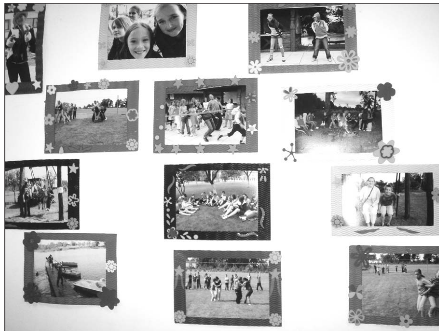
„Žaliakalnio centre“ Kaune veiklos ir išvykų nuotraukos puošia vieną sieną.

Vaikų ugdymo tema labai įdomiai vystoma kituose pasaulio kraštuose. 2009 m. pabaigoje išėjusioje amerikiečio Greg Mortenson knygoje „Stones into Schools“ (Akmenys virsta mokyklomis), tęsiamos 2006 m. pasirodžiusios jo knygos „Three Cups of Tea“ (Trys arbatos puodukai) temos. Knygos – vaikų išmokslinimas, susirūpinimas vaikais. (Gaila, bet neatrodo, kad pirmoji Mortenson knyga būtų išversta į lietuvių kalbą, nors ji