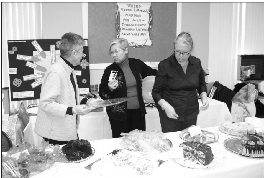
Talkininkų prie „Vaiko vartai į mokslą“ stalo PLC Kalėdų mugėje Lemonte siūlyti tortai ir pyragaičiai.

žemės plotai su labai išpuodinga, bet atskiriančia topografija – visa tai sudaro tų kraštų problematiškos padėties foną.