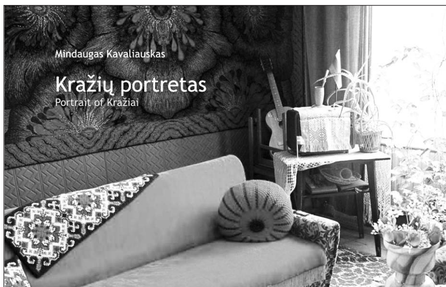
Mindaugo Kavaliausko fotoalbumo „Kražių portretas“ viršelis.