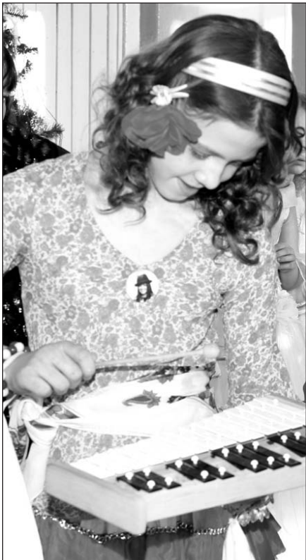
Kalėdų seneliui groja 7 klasės mokinė.

Pasirodė ir lietuviškos dainos festivalio „Skambėk, lietuviška dainele“ dalyviai. Jie gavo Kalėdų senelio atvežtas dovanėles, o mokyklos administracija įteikė padėkos raštus.