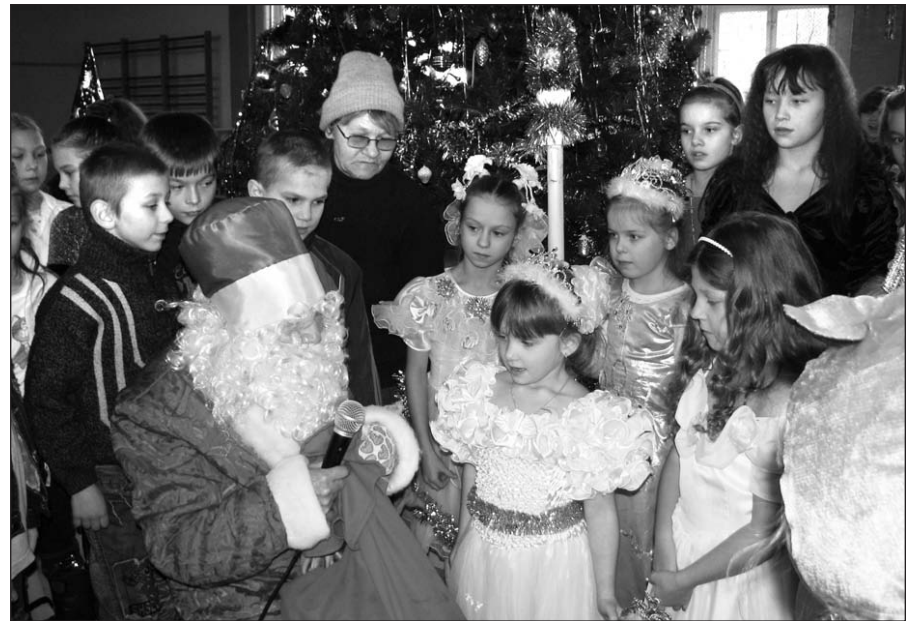
Deklamuoja eilėraščių Kalėdų seneliui.