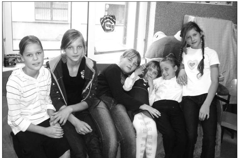
Susidraugavusios Kauno „Žaliakalnio centro“ lankytojos.

yra išversta į kitas kalbas.) G. Mortenson 1996 m. ko-įsteigta JAV pelno nesiekianti, nevyriausybinė organizacija Central Asia Institute ir vėliau mokyklinio amžiaus vaikų projektas