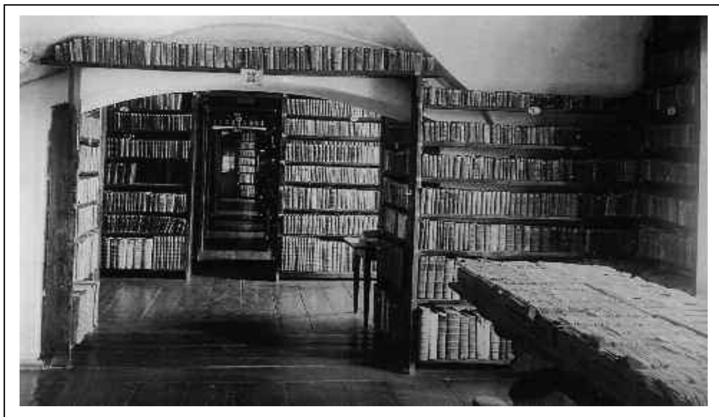
Vilniaus viešosios bibliotekos Užsienio katalogo saugykla XIX a. pab.

Tuomet leiskime valdžiai ir toliau mumis naudotis ir iš mūsų tyčiotis. Kodėl? Nes mes to verti. Ateitis te nerūpi niekam. □