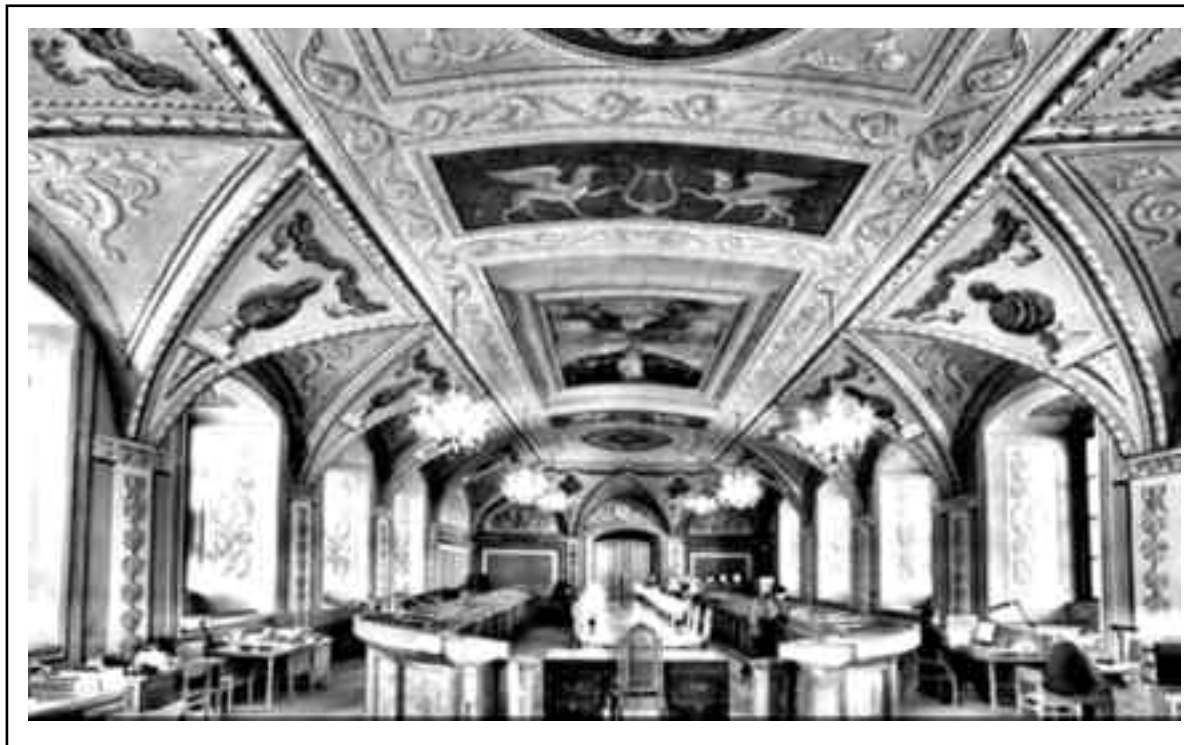
VU bibliotekos P. Smuglevičiaus salė.

Net kokiam nors Antanui Šampanui aišku: kultūrai reikia ne švenčių, jai reikia realios paramos, kaip visame civilizuotame pasaulyje. Deja... Politikai rimtais veidais kiekviename kultūros žlugdymo procese mato gėrį. Jie apskritai nesusiimašo apie realias pasekmes, apie tai, kas iš tiesų vyksta, ir niekas nesugeba įrodyti, kad norint pa-