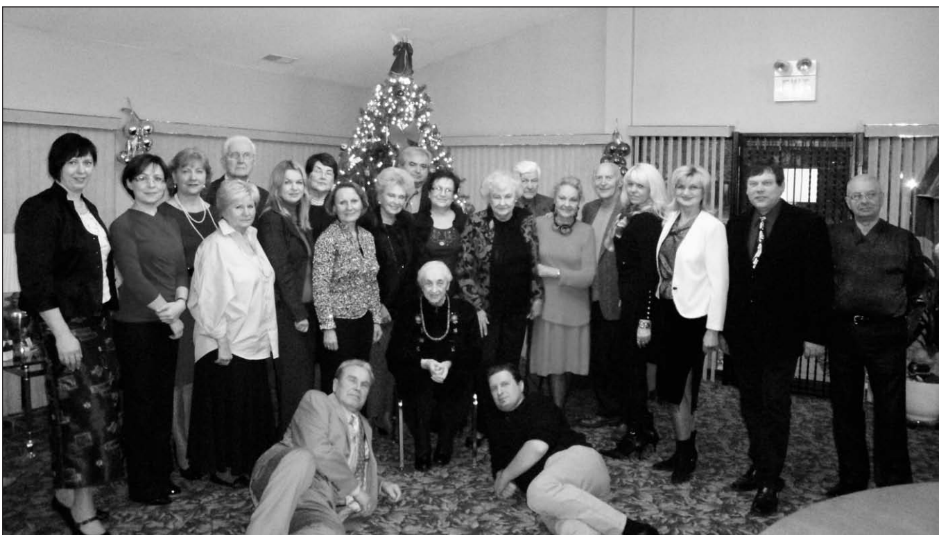
JAV LB Vidurio Vakarų apygardos valdyba, kontrolės komisija ir apygardai priklausanti apylinkių pirmininkai.