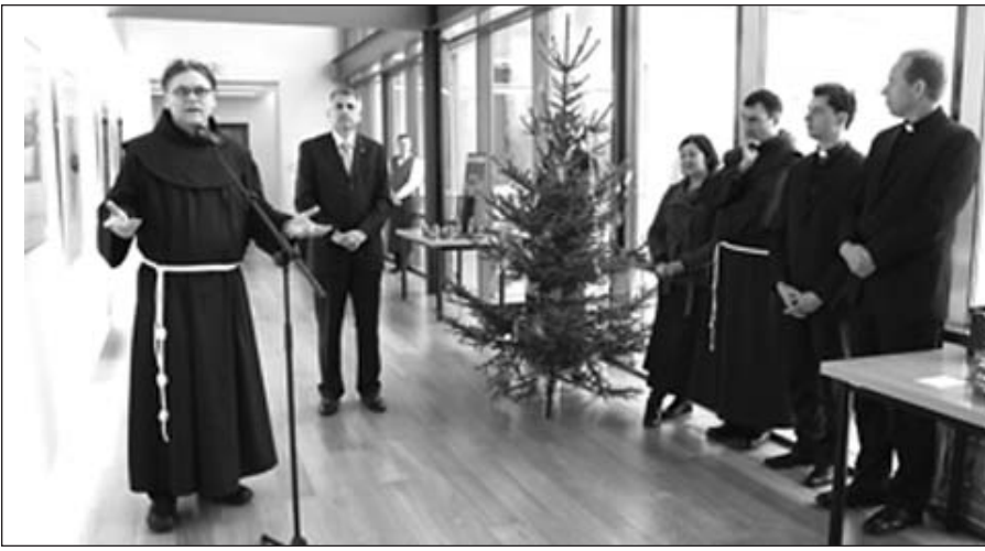
Vilnius, gruodžio 22 d. (URM info) – Užsienio reikalų ministerijoje gruodžio 21 d. surengtas kalėdinis susitikimas su Kretingos pranciškonais. Jie pristatė ypatingą projektą – Šv. Pranciškaus onkologijos centro statybą Klaipejoje.