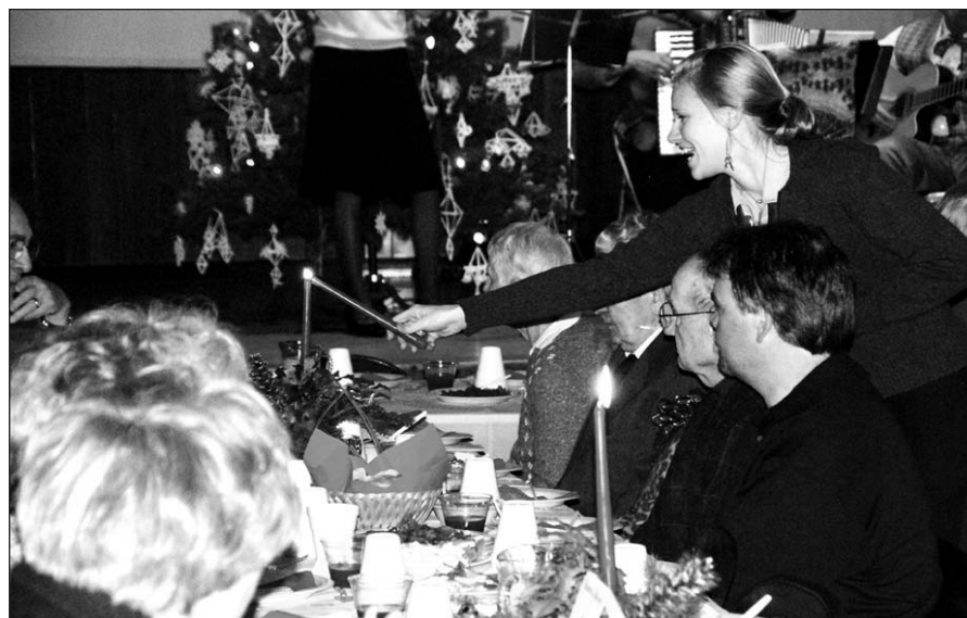
Uždegam Kūčių žvakes.