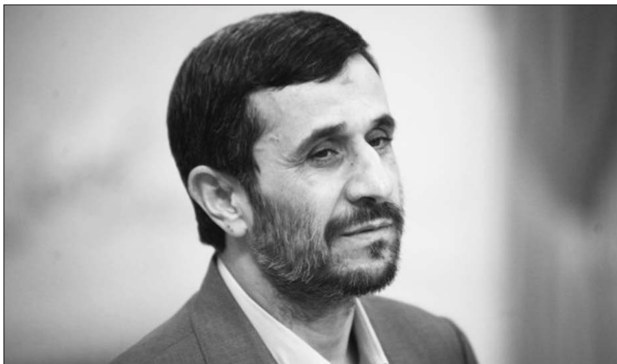
Mahmoud Ahmadinejad nuomone, užsienio šalių kariuomenė padarė Iranui didelę žalą.

Vilnius , gruodžio 22 d. (Delfi.lt) – Irano prezidentas Mahmoud Ahmadinejad pareiškė, kad artimiausiu metu parašys Jungtinių Tautų (JT) generaliniam sekretoriui Ban Ki-Moon laišką, kuriame reikalauja apsvaistinti galimybę skirti Iranui žalos atlyginimą už nuostolius, kuriuos jam sukėlė kitos šalys per Antrąjį pasaulinį karą, praneša NEWSru.com.