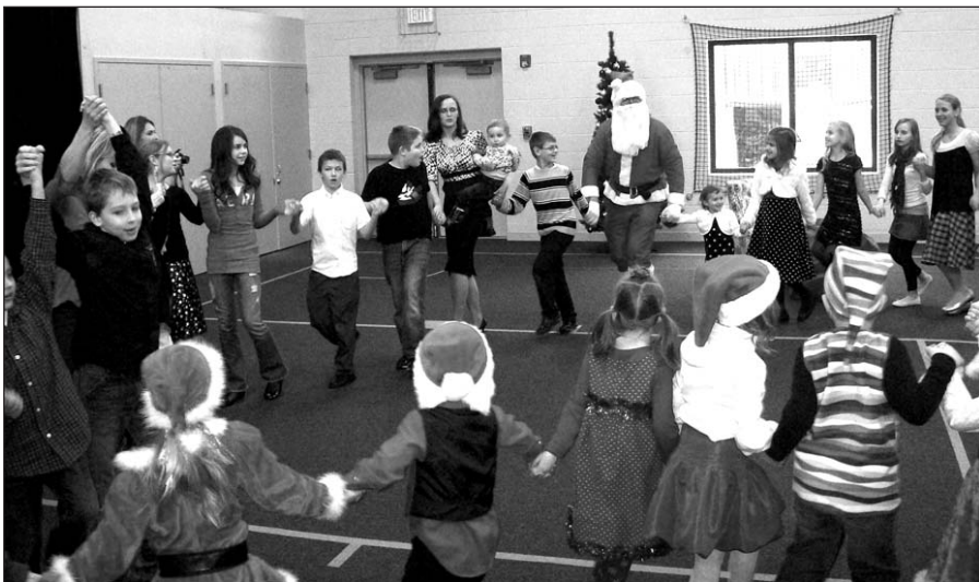
Smagu buvo šokti su Kalėdų seneliu.