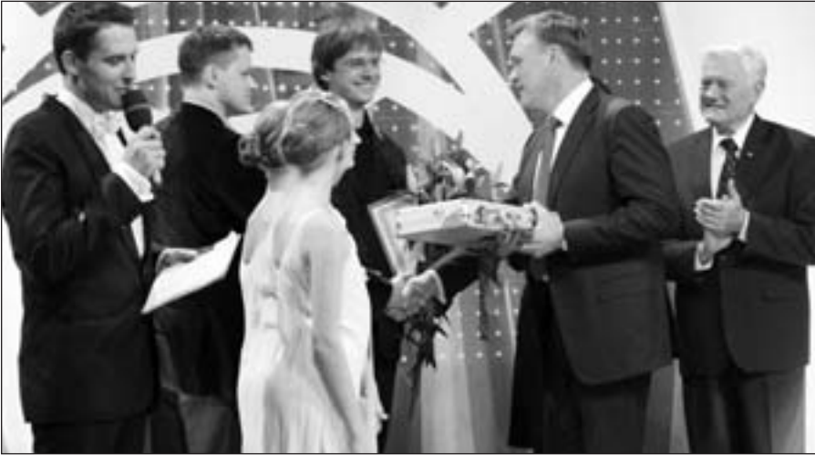
„Padovanok Lietuvai viziją“ nugalėtojai.