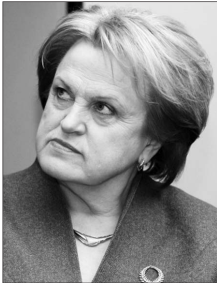
Vilniuje menama kunigaikštienė įkūrė partiją, skirtą pragmatiniam bendradarbiavimui su Rusija.

Kita vertus, vargu ar šis variantas realus. D. Medvedev nebūtinai žino visus susireikšminusius Lietuvos marginalus. O net jei ir žinotų, vargu ar tikėtusi bent simbolinio naujosios partijos indėlio į Lietuvos užsienio politiką. Taigi Rusijos prezidento žodžių su penktosios kolonos įtaka Lietuvoje gal ir nereikėtų sieti.