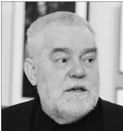
Fotomenininkas Antanas Sutkus.

Vilnius, gruodžio 15 d. (ELTA) – Už Lietuvos vardo garsinimą pasaulyje fotomenininkas Antanas Sutkus apdovanotas Užsienio reikalų ministerijos garbės ženklu „Tūkstantmečio žvaigždė“.