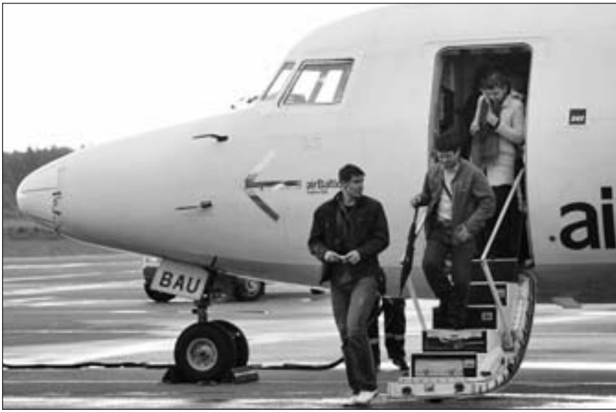
Nuo Nepriklausomybės atgavimo iki šiol iš Lietuvos jau emigravo daugiau nei pusė milijono gyventojų.

Vilnius , gruodžio 1 d. (BNS) – Iš Lietuvos šiemet emigruoja daugiau žmonių nei bet kuriais ankstesniais metais nuo Nepriklausomybės atgavimo, rodo oficiali statistika. Statistikos departamento duomenimis, sausio–spalio mėnesiais iš Lietuvos savo išvykimą deklaravo 18,255 žmonės – tai daugiau nei pernai per visus metus, kada savo išvykimą deklaravo 17,000 Lietuvos gyventojų, ir daugiau nei bet kuriais ankstesniais metais po Nepriklausomybės atgavimo per tą patį laikotarpį.