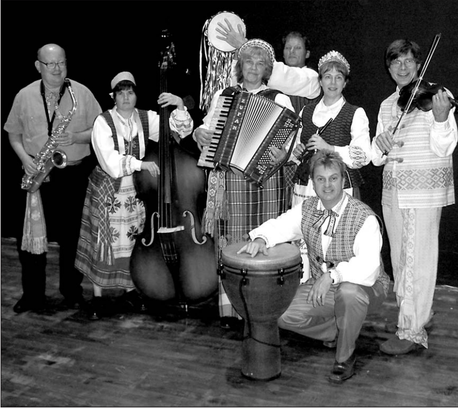
31-osios Lietuvių Muzikos namų rudeninės mugės lankytojams koncertavo iš vos 2-ųjų atlikėjų „Kaimo kapelos“ išaugęs 7-ųjų muzikantų „Varpelio“ kolektyvas, kurio sudėtyje dabar – 5 lietuvių kilmės nariai.