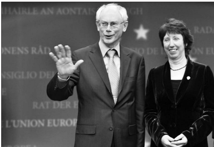
Herman Van Rompuy (k.) ir Catherine Ashton.