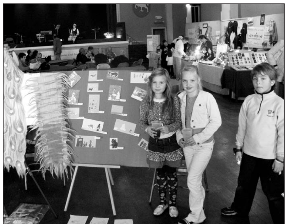
Philadelphia (PA) apylinkės lituanistinės V. Krėvės mokyklos auklėtinės mugės lankytojus pradžiugino savo gamybos Kalėdiniais atvirukais.