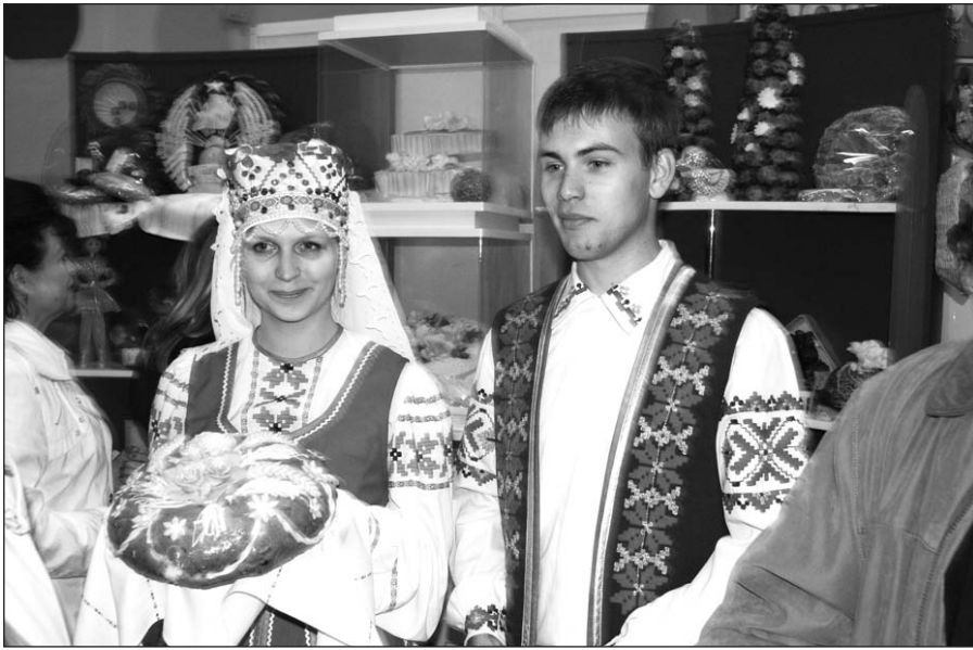
Parodoje Gardine vyravo baltarusiška produkcija.