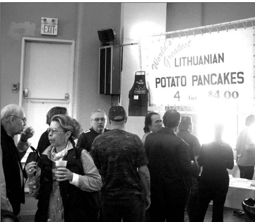
Dauguma apsilankusiųjų skanavo „gardžiausius pasaulyje“ bulvinius blynus.