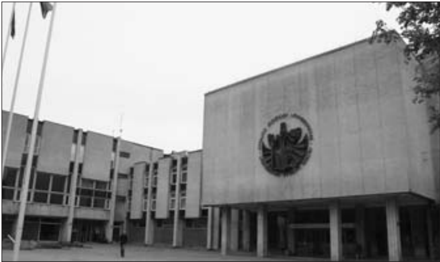
Kauno Vytauto Didžiojo universitetas.