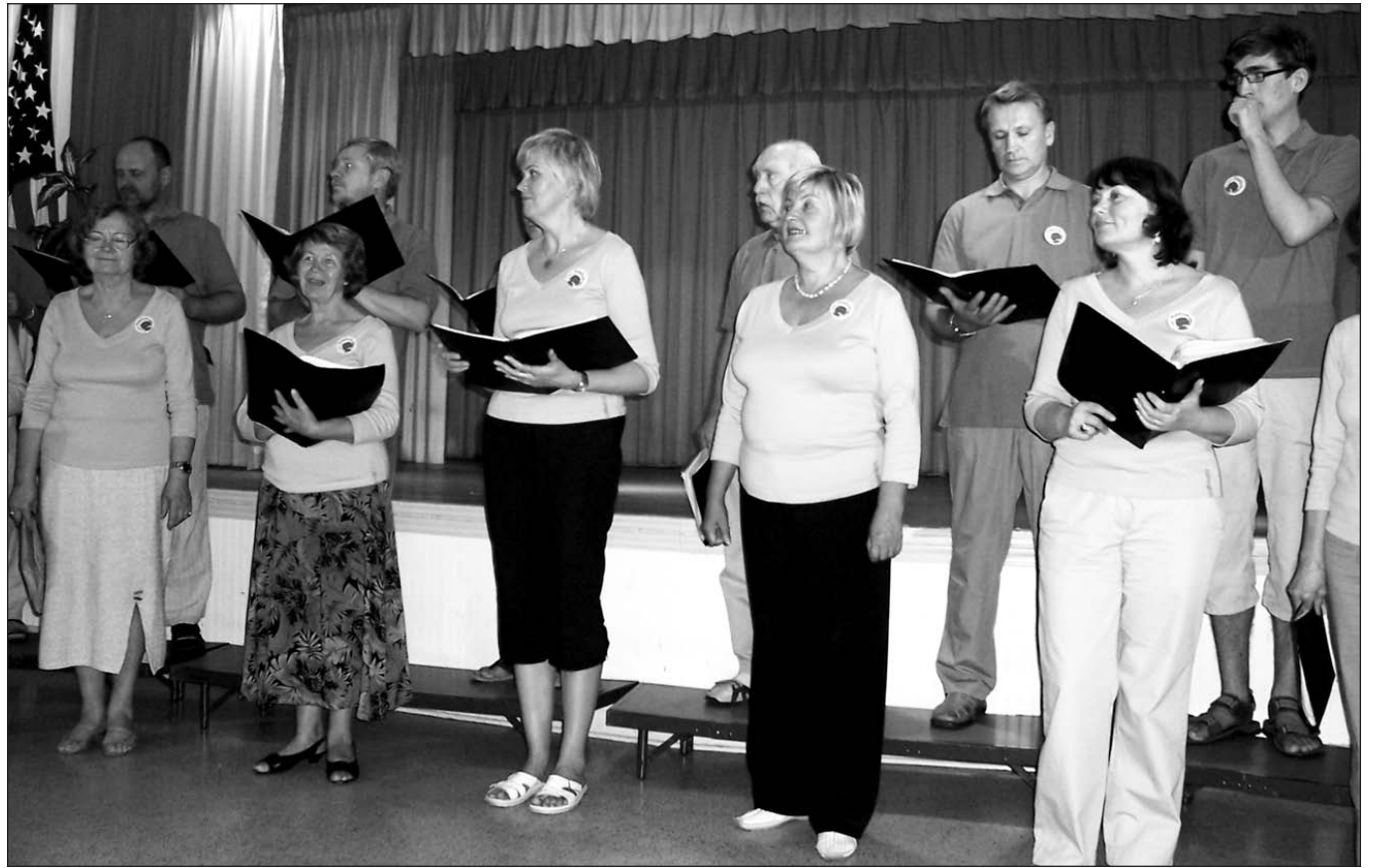
Kamerinis choras „Sodžius” St. Petersburg Lietuvių klube.

Trečiasis koncertas vyko St. Petersburg College muzikos centro auditorijoje lapkričio 10 d. vakare. Auditorijos priekyje buvo kolegijos paruoštas stalas su informacija apie studijų programą užsienyje, gaunant 3 val. kreditą ir 9 dienų studijų kelionę į Lietuvą (daugiau informaci-