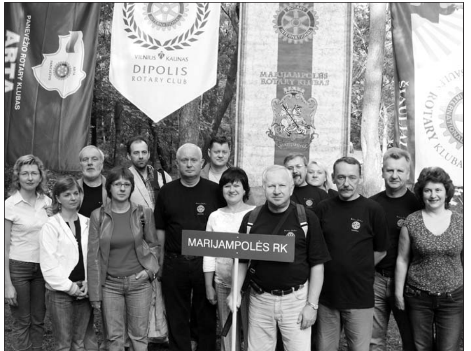
Klubai visada aktyviai dalyvauja „Rotariadosė”.

Įdomu ir tai, jog pernai pirmasis lietuvių „Rotary” klubas įsikūrė ir Čikagoje – jį įkūrė iš Lietuvos neseniai atvykę entuziastingi vyrai. Dabar vieninteliame tokiam tautiniu pagrindu suburtame „Rotary” klube Čikagoje yra apie 20 narių, kurie, kaip ir viso pasaulio panašūs klubai vykdo įvairius humanitarinius projektus.