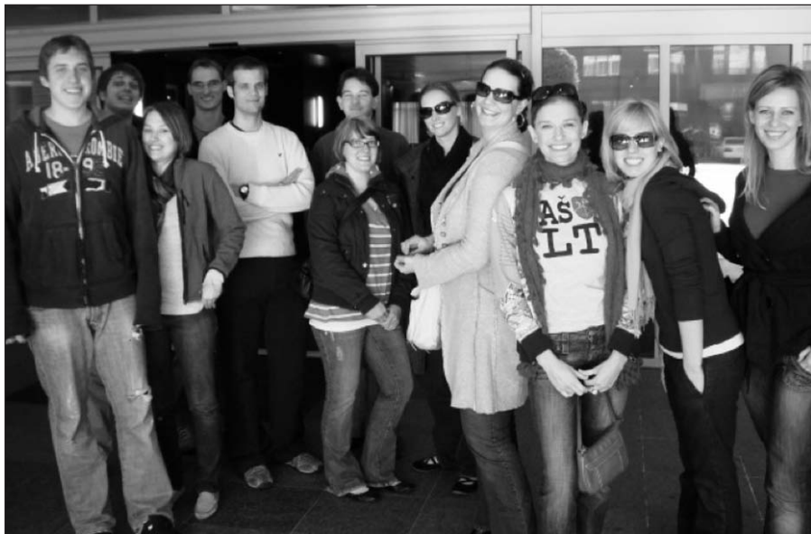
JAV LJS suvažiavimas, 2008 metai.