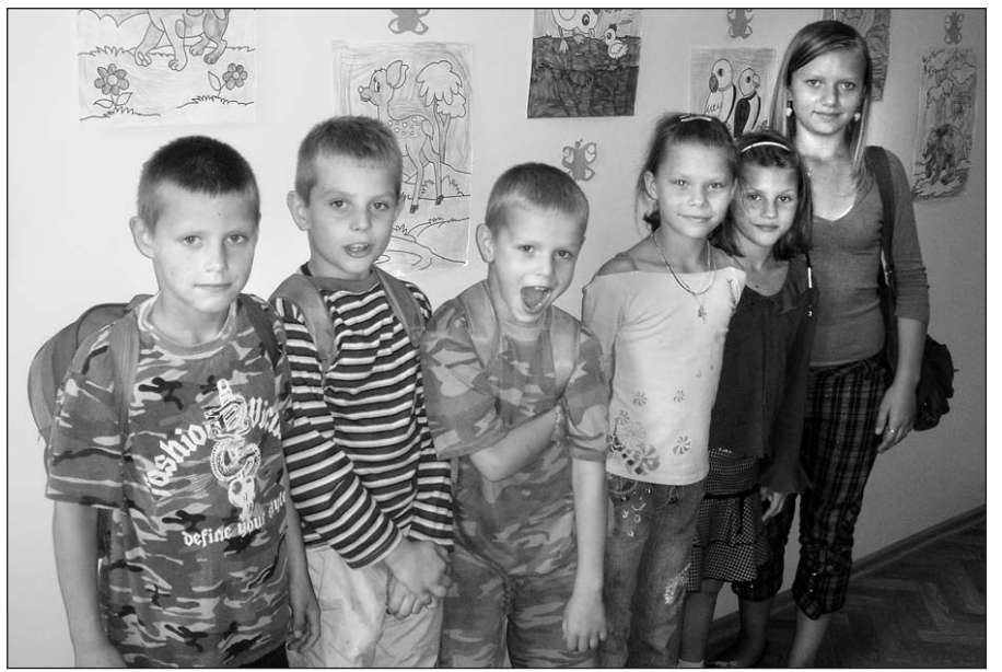
Organizacija „Vaiko vartai į mokslą“ nuoširdžiai dėkoja Lietuvių Fondui už ilgametę paramą. Nuotraukoje – „Šv. Jokūbo parapijos vaikų dienos centro“ lankytojai Jonavoje.