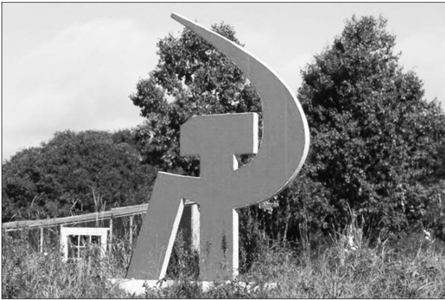
Pjautuvo ir kūjo skulptūra Kurilų salose, į kurias taikosi Japonija.