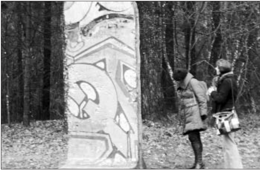
Vilnius, lapkričio 9 d. (ELTA) – Europos parke Vokietijos Federacinės Respublikos ambasada ir Gėtės institutas Lietuvoje Vilniaus miestui kaip „Laisvės paminklą“ perdavė originalią Berlyno sienos detalę. Dovana skirta Vokietijos vidaus sienos atidarymo 1989 m. lapkričio 9 d. 20-mečiui.