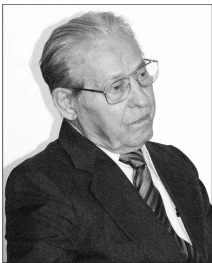
DF Kontrolės komisijos pirmininkas Antanas Pauzuolis