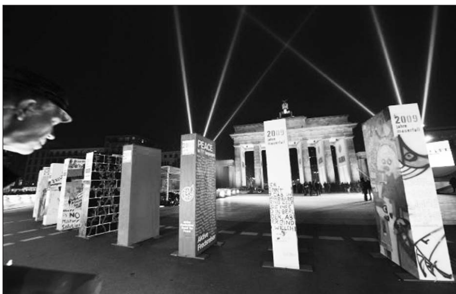
Tame ruože, kuriame driekėsi Berlyno siena, simboliškai buvo nuversta 1,000 didžiulių domino kaladėlių.

Vilnius , lapkričio 9 d. (BNS) – Buvę ir esami pasaulio valstybių vadovai pirmadienį drauge su miniomis Vokietijoje šventė 20-ąsias Berlyno sienos, kuri simbolizavo miestą ir žemyną padalijusį Šaltąjį karą, griuvimo metines. Savaitgalį Vokietijos laikraščių puslapiuose vyravo atsiminimai apie 1989 m. lapkričio 9 d., o televizijos stotys ištiesai rodė dokumentinę medžiagą, liudininkų pasakojimus ir diskusijas apie tą įvykį, kuris pakeitė Europos veidą. Įvykio, kuris paspartino Vokietijos susivienijimą, Geležinės uždangos griuvimą ir Sovietų Sąjungos žlugimą, metinių proga į Berlyną suvažiavo tūkstančiai turistų.