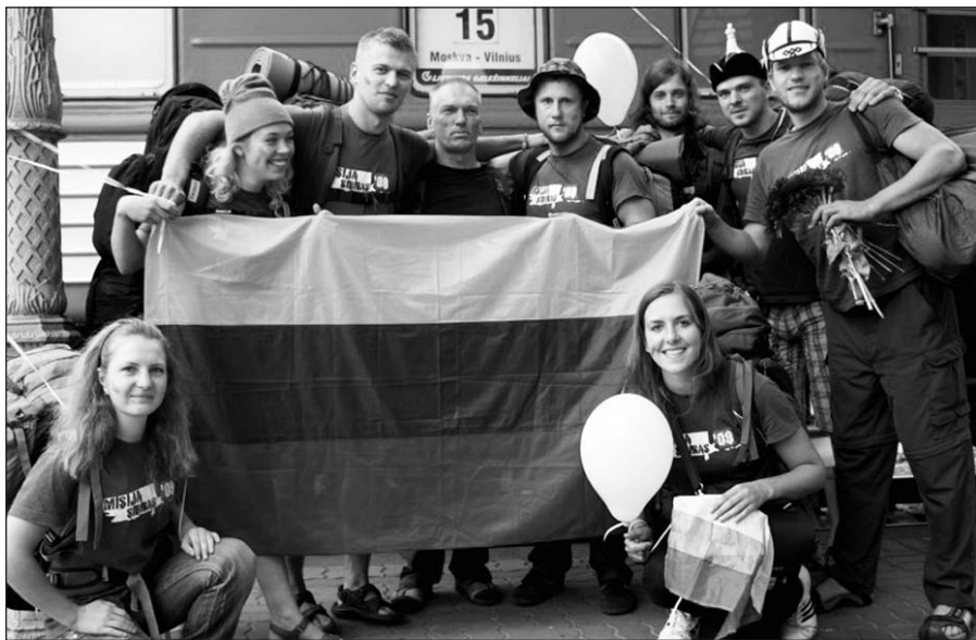
Šių metų ekspedicijos dalyviai.