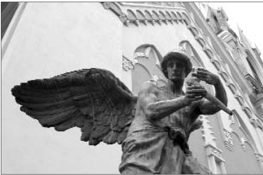
Vilnius, spalio 30 d. (ELTA) – Baigta atnaujinti centrinė Rasų kapinių koplyčia.