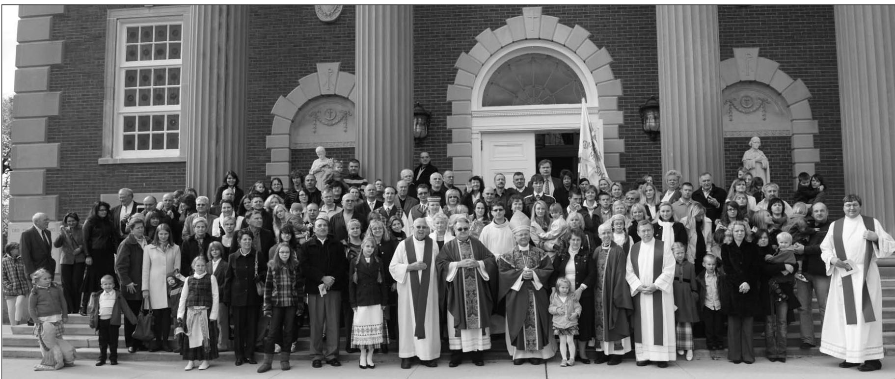
Gedimino liuanistinės mokyklos mokiniai, mokytojai ir tėveliai, atšventę savo mokyklos 7-erių metų gimtadienį, su arkivyskupu S. Tamkevičiumi, SJ ir jį lydėjusiais kunigais po šv. Mišių Mundelein kunigų seminarijoje.