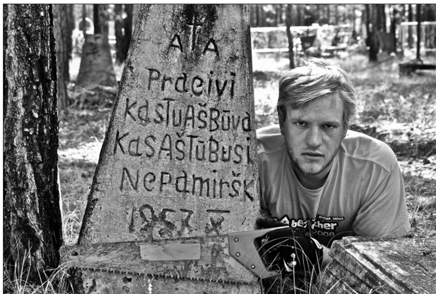
Tomas prisimena vieno bendražygio žodžius: „Šie žmonės nenorėjo būti pamiršti.“

– Kokios Jūsų sąsajos su Lietuva? Ar dažnai lankotės Lietuvoje? Galbūt ir ateities planai susiję su gimtine?