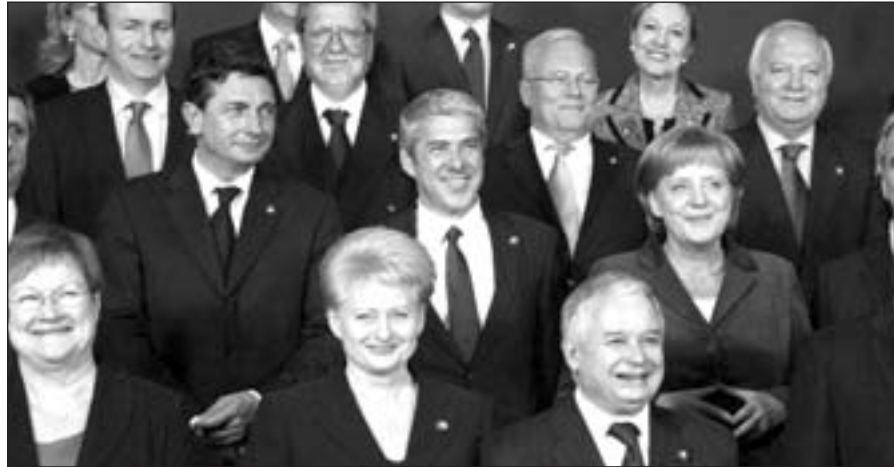
Prezidentė D. Grybauskaitė dalyvavo Europos Vadovų Tarybos posėdyje.