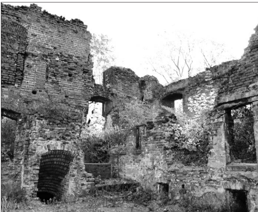
Instenburgo pilis mena XIV amžių.

Šių namų atstatymui pritaria ir Lietuvos valdžios įstaigos. Žinoma, dėl dabar esančio sunkmečio tikėtis, kad Lietuva suras kažkiek pinigų atstatymo darbams, neverta tikėtis, bet ateityje, kai bus gauta nemažai lėšų iš Europos Sąjungos fondų, kai finansinė padėtis pagerės, gal ir galima tikėtis, jog nedidelė dalis pinigų bus surasta ir šis labai svarbus Lietuvai pastatas, menantis mūsų literatūros klasiką, bus atstatytas.