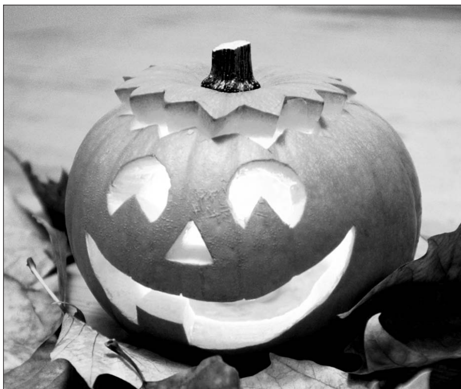
Halloween šventės simbolis – besišypsantis moliūgas.

Šiais laikais mirusieji pagerbiami bažnyčioje, lapkričio 1 ir 2 d. aukojamos šioms šventėms skirtos šv. Mišios. Nepamirškime šių lietuviškų švenčių, švęskime jas!