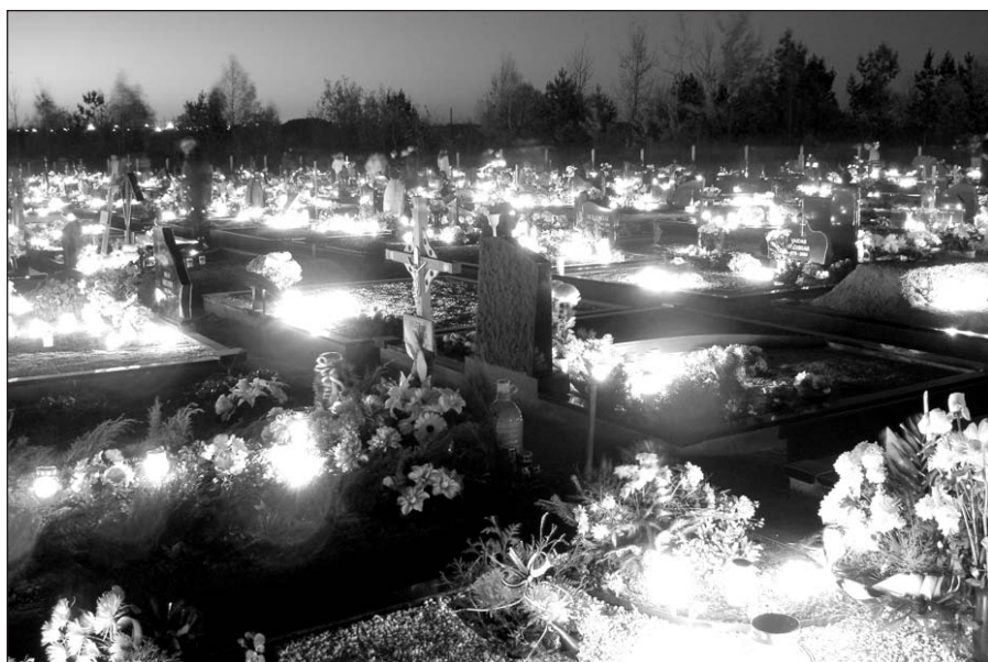
Lietuvoje per Vėlines mirusiesiems atminti deginamos žvakelės.

Seni žmonės pasakoja, kad anksčiau nebuvo papročio per Vėlines degti kapinėse žvakučių, kaip šiais lai-