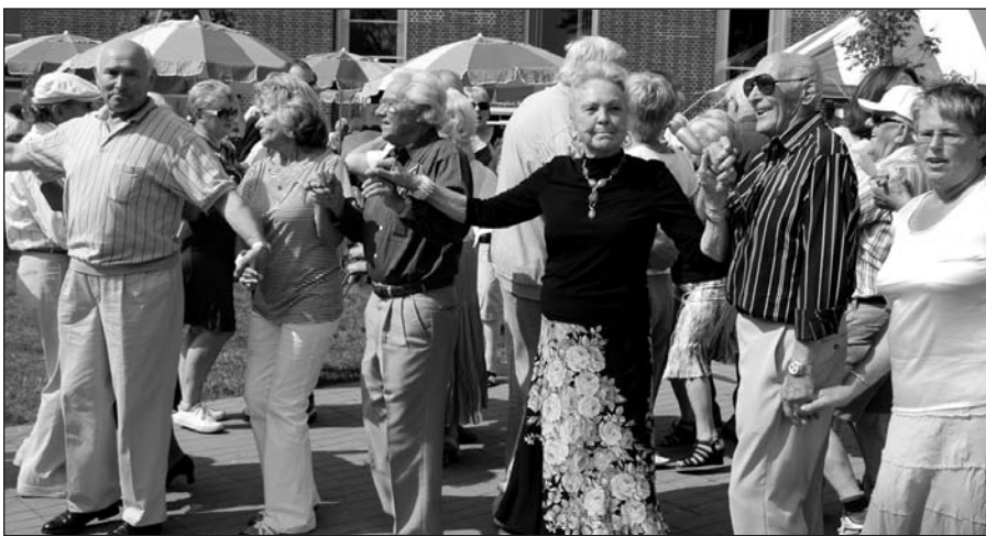
Kokia šventė be lietuviško suktinio?

Ir nesvarbu, kuriame pasaulio kampe būtų bebūtume, savo tautiškumą galime pajusti, kai esame drauge su ta pačia kalba kalbančiais, tas pačias dainas dainuojančiais, tuos pačius šokius šokančiais, tą pačią tautos istoriją menančiais.