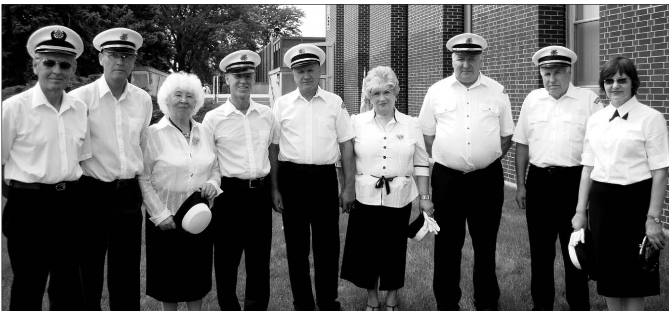
Šventėje dalyvavo gen. T. Daukanto jūrų šaulių kuopa.

Panašiai turbūt jautėsi ir 1989 metų rugpjūčio 23 d. į 600 kilometrų ilgio grandinę sustoję lietuviai, kartu su latviais ir estais sudarę gyvą grandinę per Baltijos valstybes, taip simboliškai atskirdami Baltijos valstybes nuo Sovietų Sąjungos, išreiškdami norą būti laisvais. Baltijos kelias, nusidriekęs minint 50-ąsias Molotov-Ribbentrop pakto, panaiki-