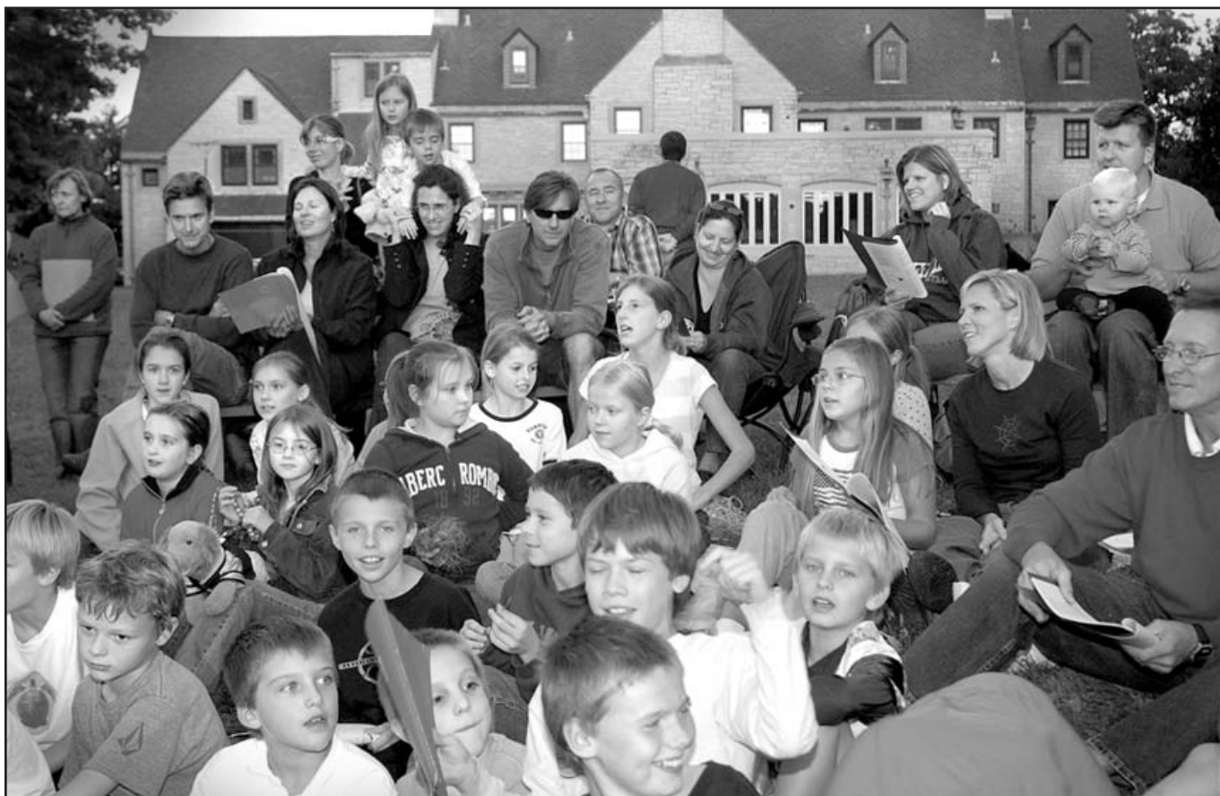
Jaunučiai ateitininkai su tėveliais Ateitininkų namų paunksmėje 2007 m. rudenį.