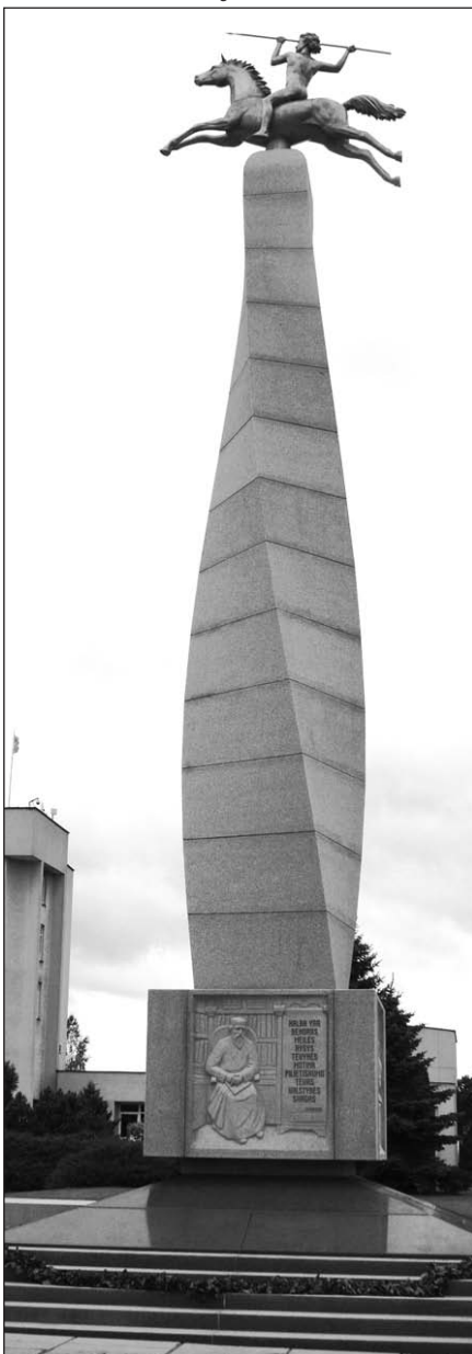
Naujasis paminklas papuošė miestą.

Atidengus naująjį paminklą, tvarkoma ir centrinė miesto aikštė. Iš viso jos rekonstrukcija kainuos 10 milijonų litų (apie 4,2 milijono dol.). Iš šios sumos 9 milijonus litų skyrė Europos Sąjungos fondai, dar milijoną – miesto savivaldybė.