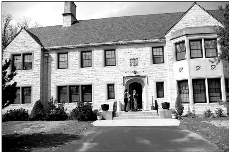
Ateitininkų namai, Lemont, Illinois, jau 30 metų tarnauja ne vien ateitininkams, bet visiems lietuviams, norintiems prisiglausti svetinguose namuose.

– Daugiausia naudojasi ateitininkai: jaunučiai bei jaunieji, moksleiviai, studentai ir sendraugiai. Po-