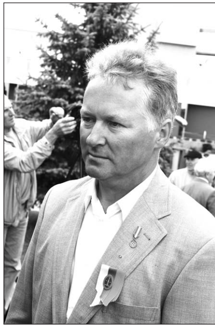
Skulptorius Balčiūnas paminklą kūrė trejus metus.

Iškilmės Marijampolėje prasidėjo iškilmingu savivaldybės tarybos posėdžiu, po to švento arkangelo Mykolo prokatedroje buvo aukojamos šv. Mišios. Centrinėje J. Basanavičiaus