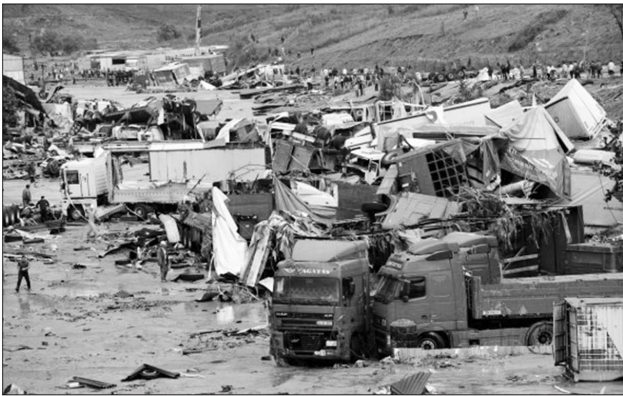
Potvynis kilo po smarkių liūčių, besitęsiančių nuo pirmadienio.