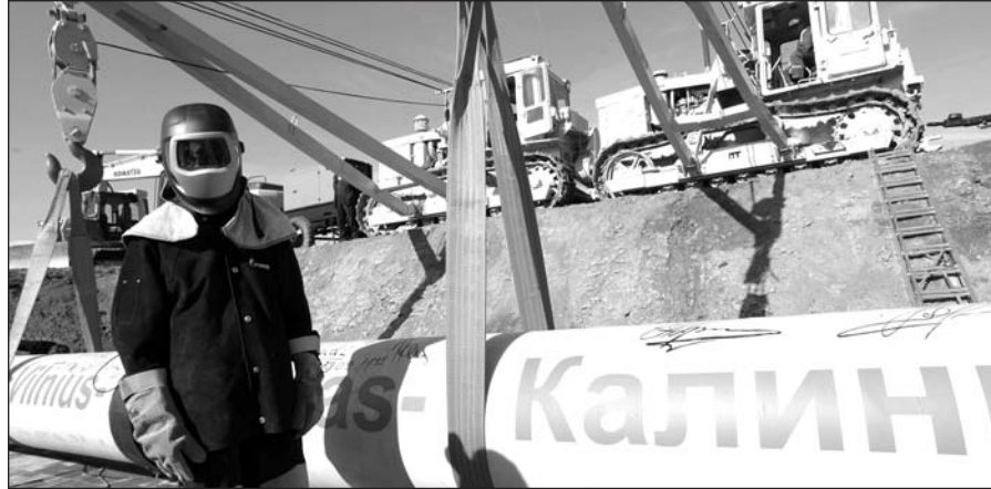
Lietuvos ir Rusijos Kaliningrado srities pasienyje Šakių rajone atidarytas tranzitinis dujotiekis.

Vilnius, rugsėjo 9 d. (ELTA) – Augant naftos kainoms, brangs ir dujos, sako Lietuvoje viešintis „Gazprom“ valdybos pirmininkas Aleksej Miler.